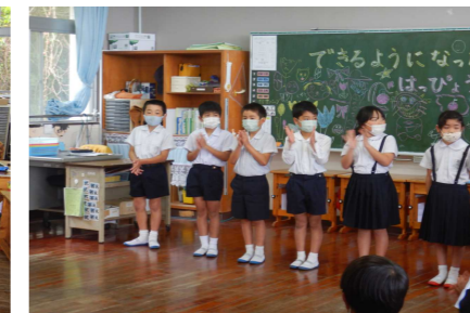
2年生「できるようになったこと」