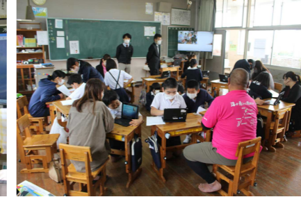
5年「早町サンゴラボ」