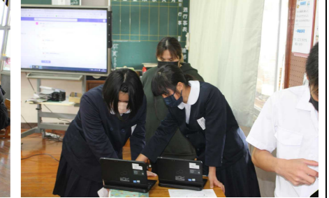
6年「学習成果発表会」