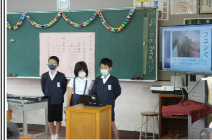
4年「学習成果発表会」