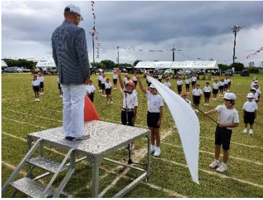
両団長による誓いの言葉

9/26（日），令和3年度早町小運動会を開催しました。今年度も午前中のみでの開催とし，昨年度より更に規模を縮小した運動会となりました。しかし，子供たちは，運動会ができることに感謝しながら，練習の成果を発表することができました。