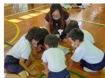
【お話にて群読の練習中】