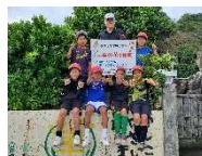
【人権の花運動の看板】