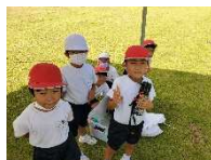
【水分補給を忘れず！】