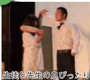
生徒と先生の息ぴったり