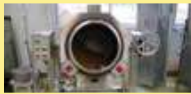
炒り機で炒ります