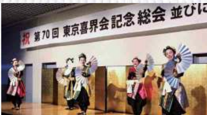
伊是名の会の創作舞踊

東京喜界会(郡弘道会長)第70回記念総会が9月10日、東京都品川区のきゅりあん(区立総合区民会館)にて400人が参加し盛大に開催された。当日は総会、記念式典、芸能祭並びに懇親会の3部構成で行われた。記念式典では功労者表彰や来賓祝辞などが行われ、芸能祭並びに懇親会は祝舞や島唄、ダンス、ギター演奏に全員での島口ラジオ体操など多彩な内容となっていた。会場内は参加者らの笑顔と笑い声に包まれ、最後は青年部による万歳三唱でお開きとなった。【報告：向田信孝幹事長】