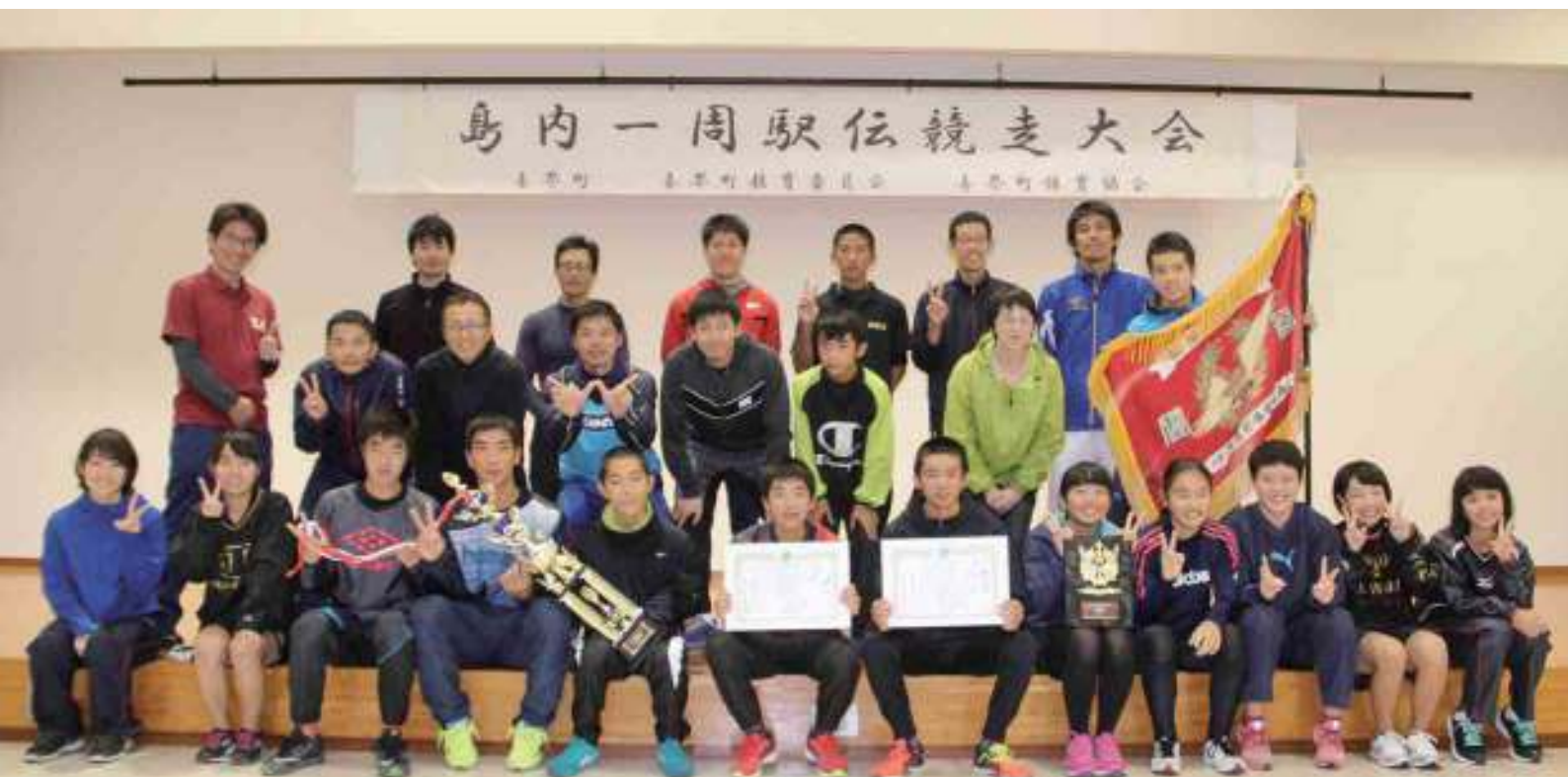
優勝を飾った湾体協のメンバー おめでとう!!