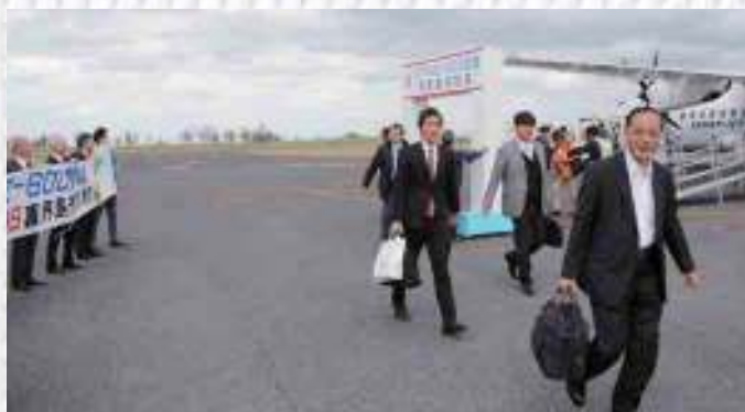
皆さん歓迎を受けて笑顔がこぼれます