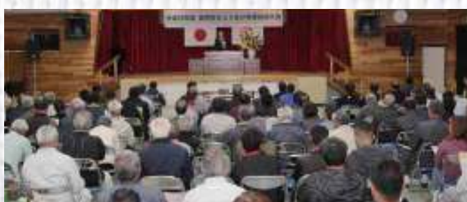
会場には大勢の農家が詰めかけた

平成29年度さとうきび生産振興大会が12月4日、町糖業振興会の主催で自然休養村管理センターにて開催された。大会では3期連続の年内操業となることが説明され、原料搬入開始は昨年より3日早い12月15日の予定で、今期産キビ生産量は前期実績（9万6,712ト）より約1万4千ト少ない8万2千トを見込む。操業期間は年内が27日まで、年明けは1月6日から4月2日までを予定。町農業振興課の担当者は「今期は豪雨災害や台風襲来などの影響はあるものの、ある程度の収量が見込まれてほっとしている。ただし、糖度があまり上がってこないなので今後の状況を注視したい」と話した。