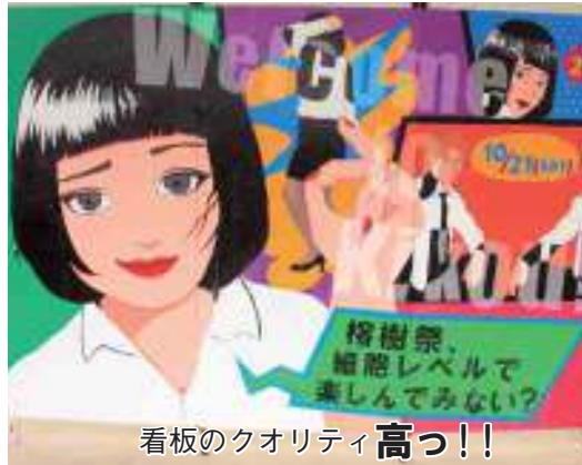
看板のクオリティ高っ!!