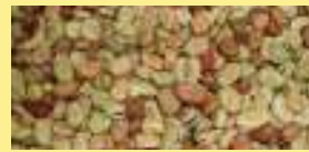
乾燥そら豆を使います

そら豆の製粉について詳しくは、農産物加工センター ☎65-3666666 まで!