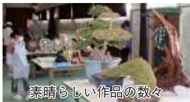
素晴らしい作品の数々