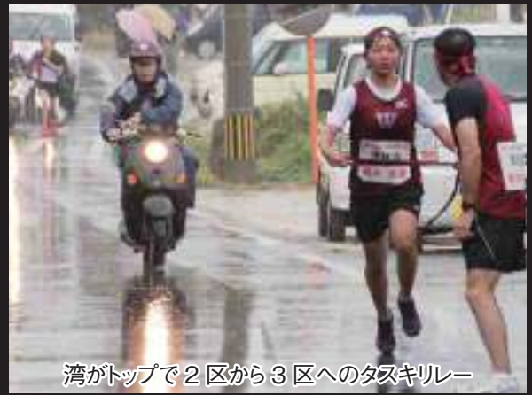
湾がトップで2区から3区へのタスキリレー