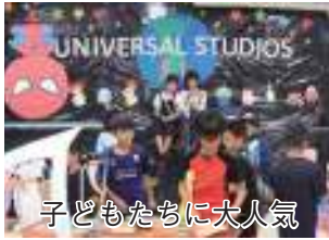
子どもたちに大人気

喜界高校の文化の祭典である第32回榕樹祭が10月21日、同校にて開催された。通常は2日間で開催されるが今回は台風21号の接近により、日程を短縮して1日のみの開催となった。短縮日程になったものの展示発表やステージ発表など、生徒たちの努力の成果が見て取れる笑いにあふれた文化の祭典となった。