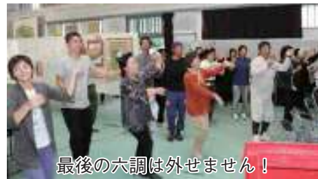
最後の六調は外せません!