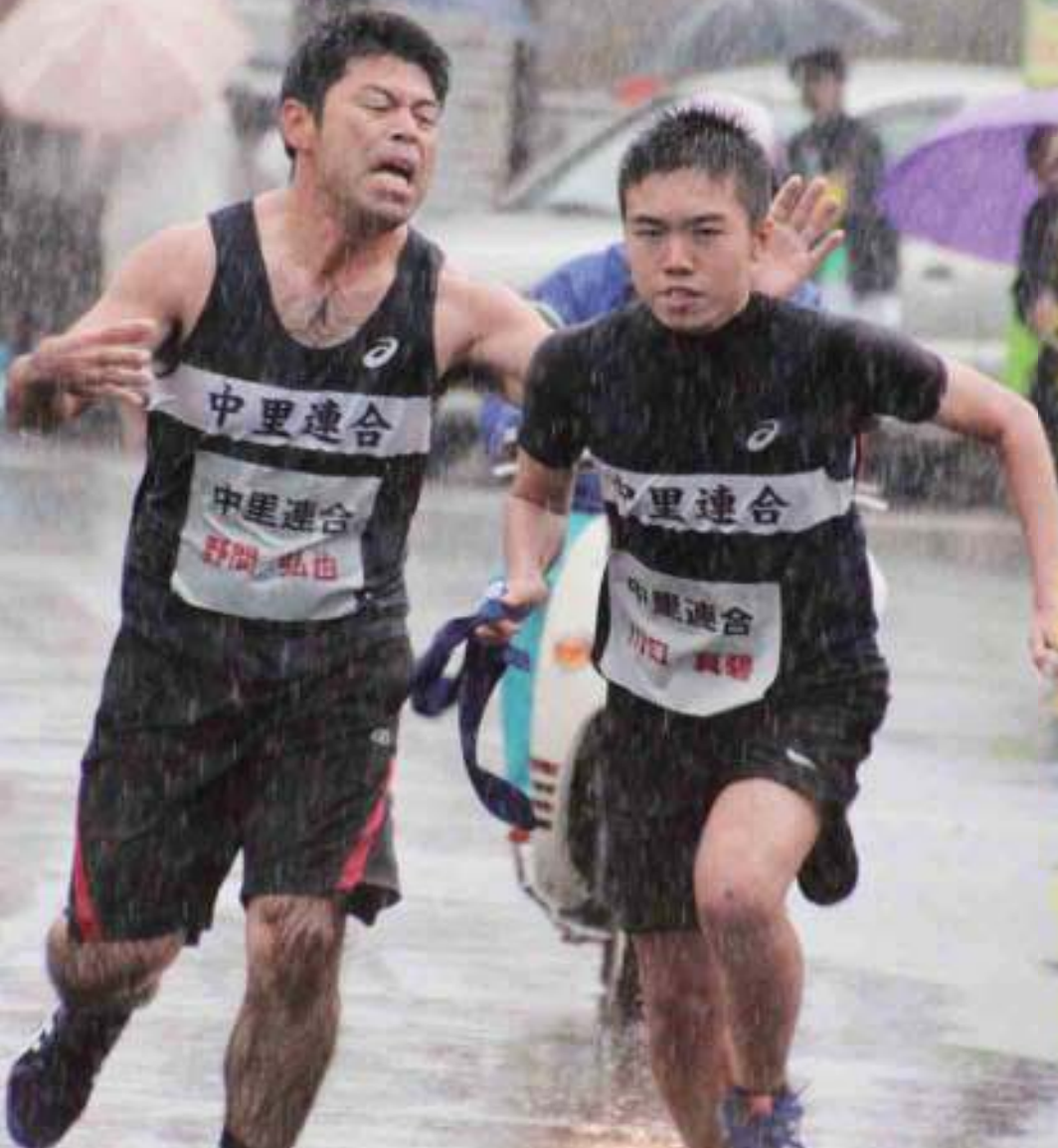
30才以上男子から中学男子へ襷をつなぐ (中里連合)