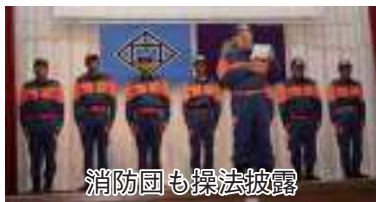
消防団も操法披露