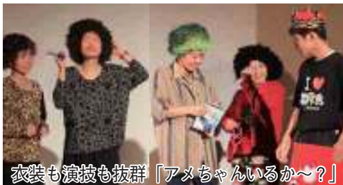
衣装も演技も抜群「アメちゃんいるか〜？」