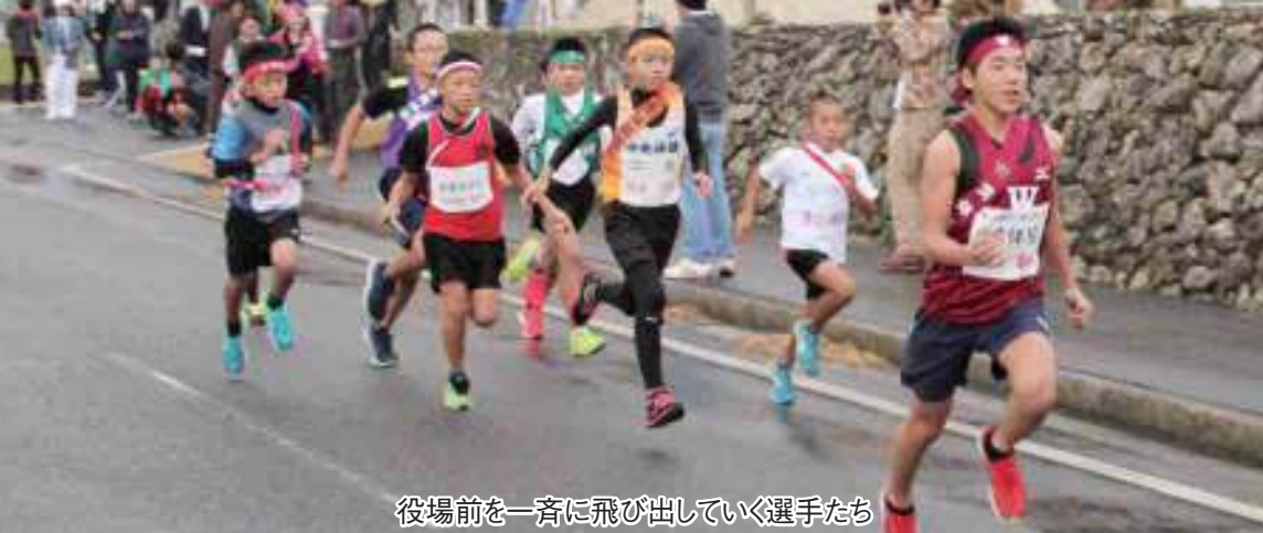
役場前を一齐に飛び出していく選手たち