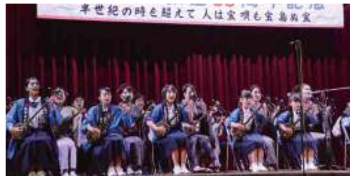
教え子らによる朝花節でスタート