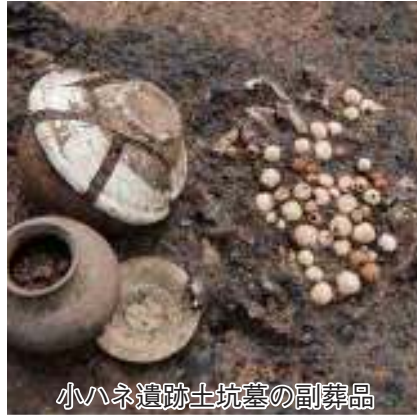
小ハネ遺跡土坑墓の副葬品