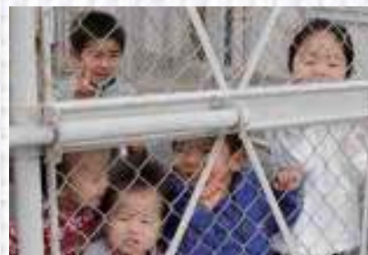
子どもたちも興味津々

航できるという。また、ATRへの乗り降りは新たに可動式の「ボーディング・スロープ」を導入したため、車いすを利用されている方もこれまでよりスムーズに機内へ移動できる。JACでは現在、ATRを2機導入しているが、今後は年間2機ずつほど増やし、2019年度中には9機での運航体制となる予定。