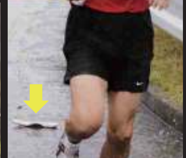
両足のソール(くつ底)を失いながらも魂(ソウル)の走りで区間賞(赤連池治)