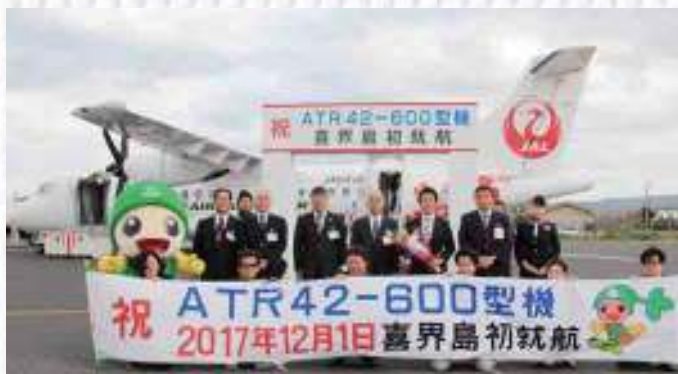
よるこびとも関係者らと一緒に歓迎しました

新型機はフランス製の最新鋭ターボプロップ機で客室は従来のサーブ 340 B型機の36席より12席多い48席で、足元スペースが広く静粛性も高まったなど、機内での快適性は向上した。サーブ 340 B型機は気象条件により定員を制限して運航しなければならない場合もあるそうだが、ATR 42-600 型機ではそのような制限がなく運