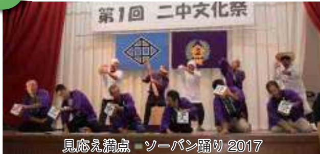
見応え満点 ソーパン踊り 2017