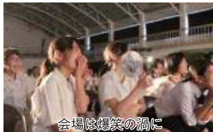
会場は爆笑の渦に

喜界高校の文化の祭典である第32回榕樹祭が10月21日、同校にて開催された。通常は2日間で開催されるが今回は台風21号の接近により、日程を短縮して1日のみの開催となった。短縮日程になったものの展示発表やステージ発表など、生徒たちの努力の成果が見て取れる笑いにあふれた文化の祭典となった。