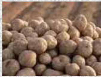
農林水産物の流通加工