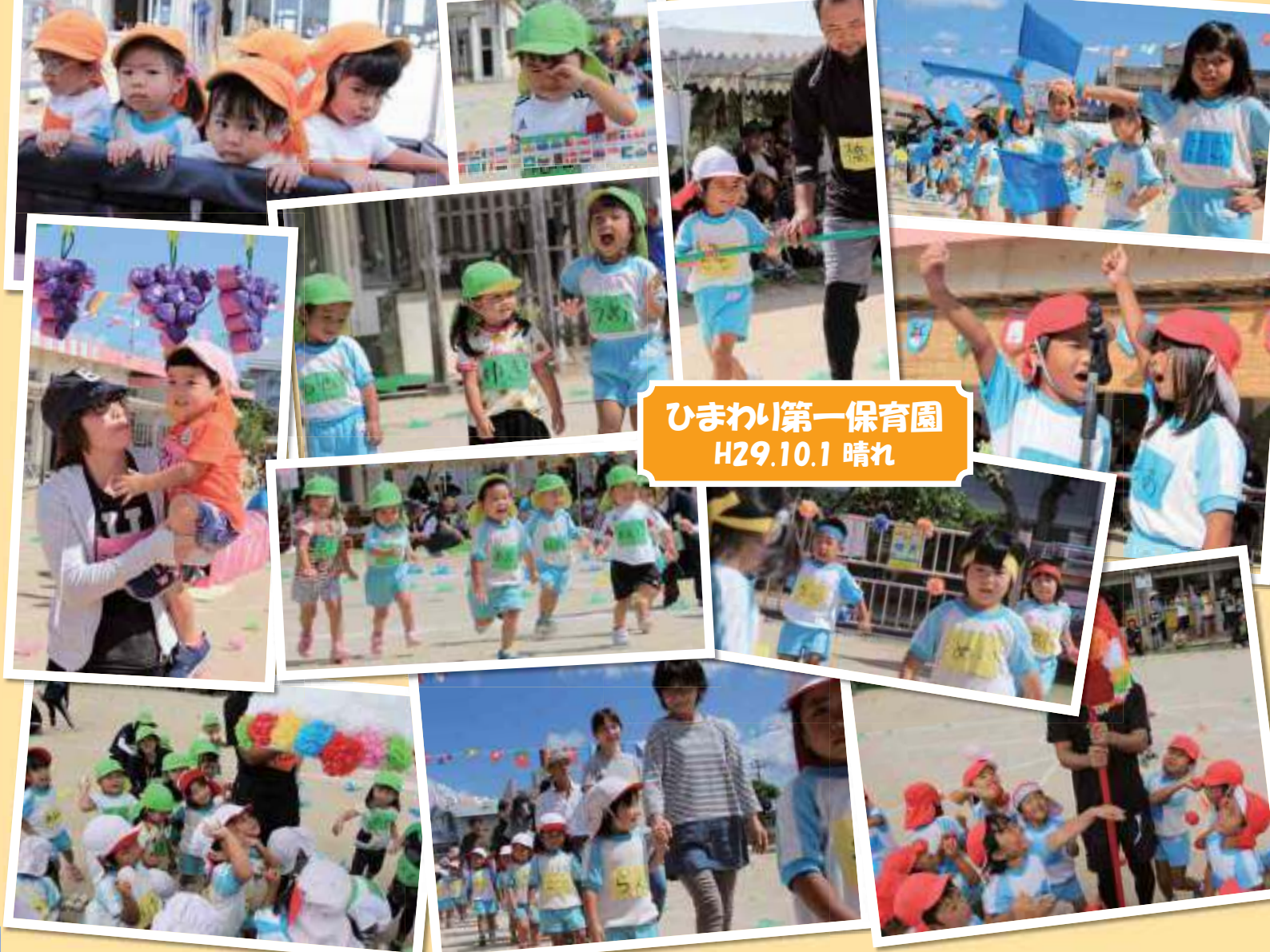
ひまわり第一保育園 H29.10.1 晴れ