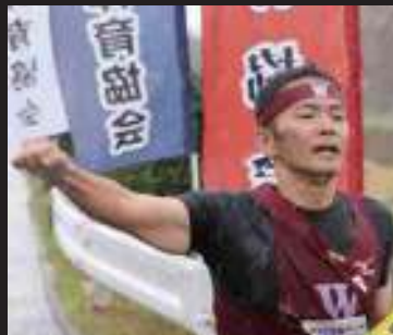
勝利のガッツポーズ (湾)