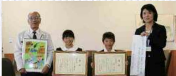
左から川島町長、中村さん、柏原くん、早町小 下屋敷校長