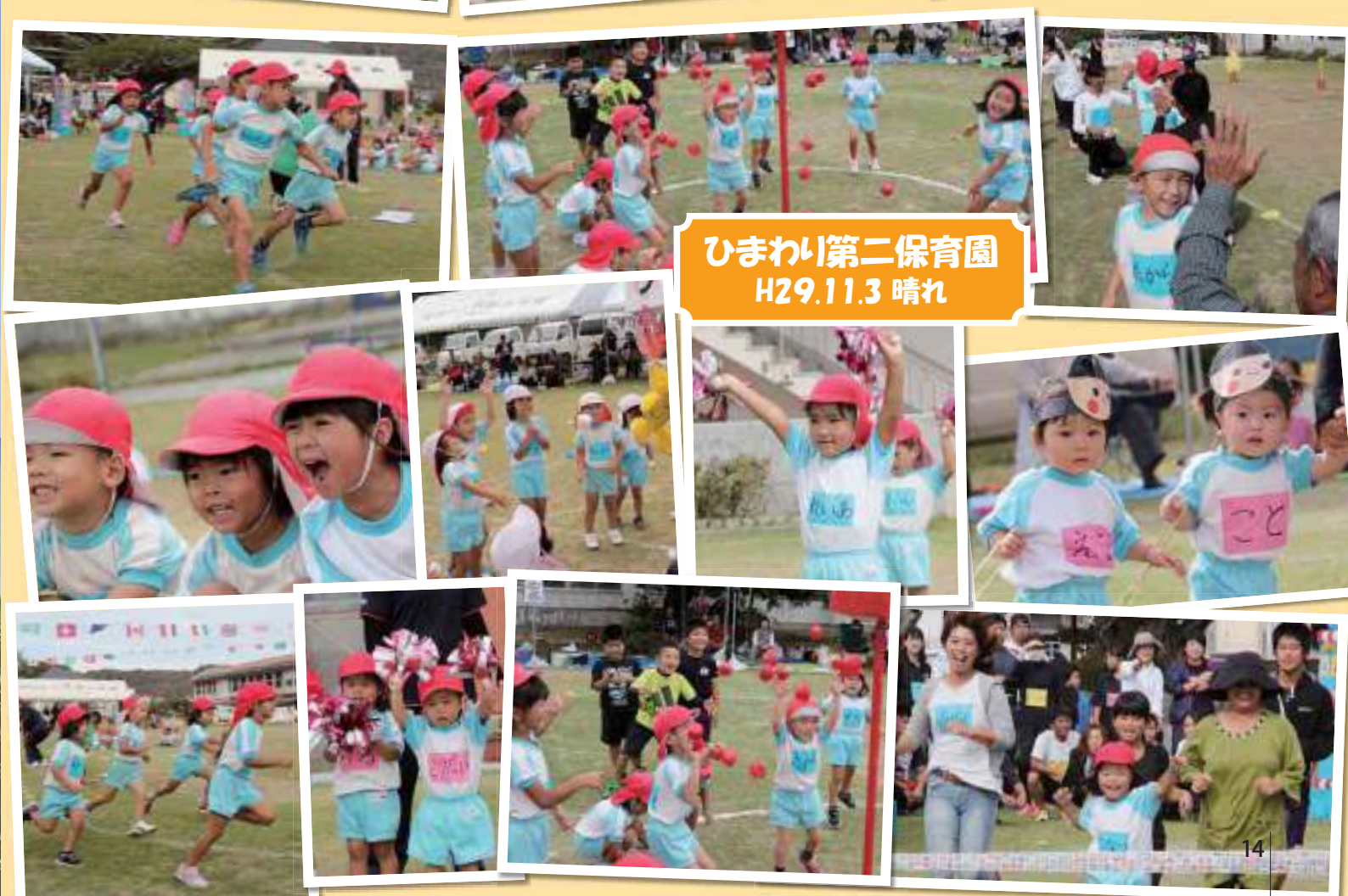
ひまわり第二保育園 H29.11.3 晴れ