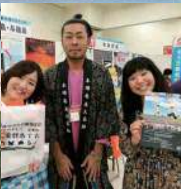
サンシャイン池袋にて喜界島をPR

最後に、観光客の受け入れをしてほしいよ!という方は今後も随時募集しておりますので(企画観光課 ☎65-36883)ご連絡ください。