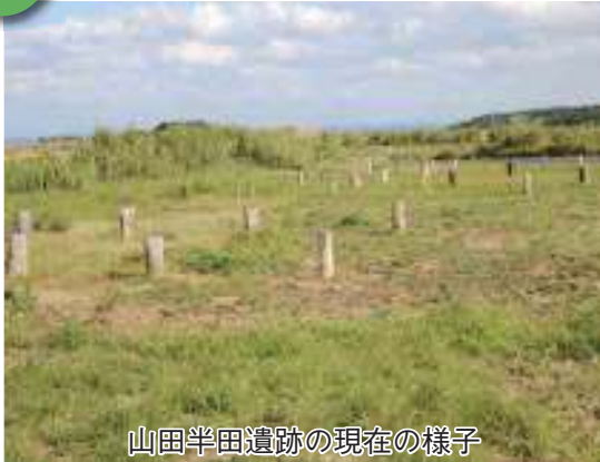
山田半田遺跡の現在の様子