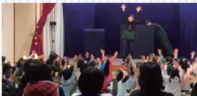
劇の合間には体いっぱい使ってレクレーション♪