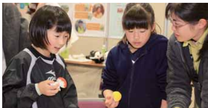
お姉さんの説明を聞きながらサンゴ染め体験