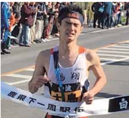
力を出し切り役目を果たした栄選手