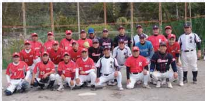
奄美市シニアチーム「奄美島人（しまんちゅ）」と試合後に