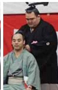
はさみ 鉗を入れる同期入門の琴奨菊関