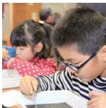
子どもたちは興味津々 サンゴの組織見たり～星砂探したり♪