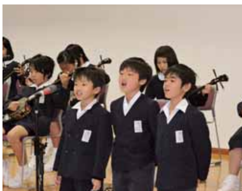
元気いっぱい「チンダラ節」を歌う早町っ子

シマ唄部門では小学生から一般の方17名が参加し、「行きゆんにや加那節」「塩道長浜節」などを披露しました。シマゆみた部門では、各小中学校の児童生徒が方言や歴史について日ごろ学校で学んだ成果を発表、さらには、特別企画のニーネーの主張に4名の方が、方言で地元集落のことや将来の夢について語りました。