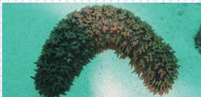
バイカナマコの通常の個体