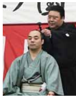
親方(元小結 両国)が最後の止め鉗を入れる