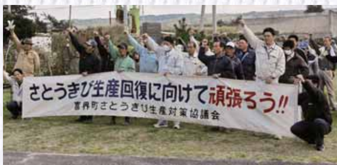
8年ぶりの豊作に活気づきます

今期搬入量の当初見込みは、7万6千トンだったが2月1日に8万4千トンに上方修正され、3月1日には9万トンへ上方修正がなされた。平成20年産の9万3千トン以来、8年ぶりの9万トン達成見込みとなった。