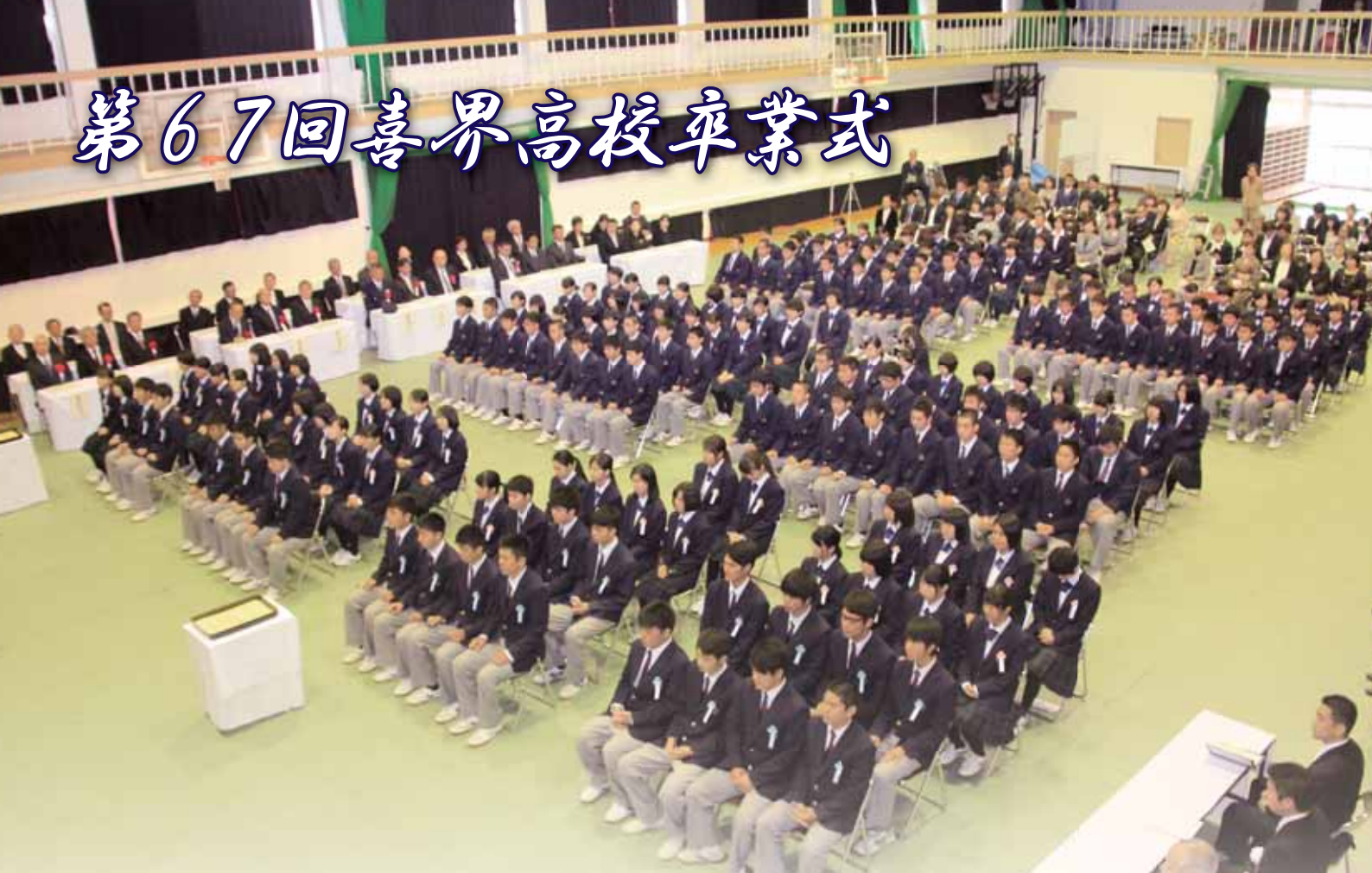
喜界高校卒業生は総勢 8,213 人となる (物故者を含む)