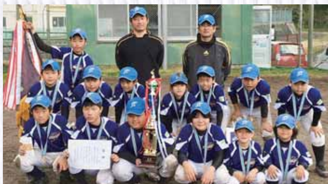
圧倒的な強さで3連覇！

小学生が参加する「第40回奄美新聞社杯小学校卒業記念ソフトボール大会」が2月12日、奄美市で開催された。きかい100スポーツクラブ・ソフトボール少年団が参加した男女混合の部には、14校17チームが参加した。きかいチームは予選から圧倒的な強さで勝ち上がり、準決勝の赤徳ソフトボール少年団戦は6-0、決勝のコンキヤーズ戦は13-0と全試合完封勝ちで見事大会3連覇を飾った。きかいチームは、3月5日から県本土各地で開催される第43回鹿児島県ちびっこソフトボール大会に参加し、188チームの頂点を目指す。