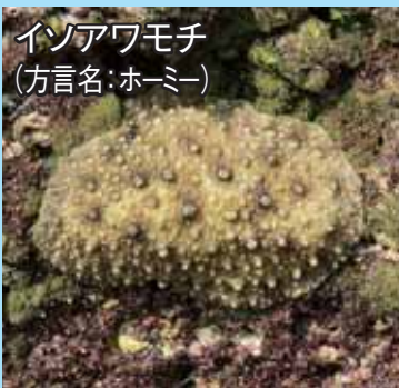
イソアワモチ (方言名: ホーミー)

▶イソアワモチ科で体長 10cm ぐらいになる。外観はウミウ シに似るが、系統的にはマイ マイ類に近い有肺類の仲間。 体の外形を栗餅に見立ててつ けられた。ミソ炒めなどで島 でも食べられてきた。味は磯 の香りが強く歯ごたえがある。