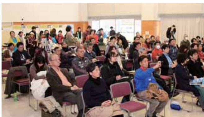
島内外から多くの来場者があり盛況だった

ステージ側では講演などが行われ、後方では子どもたちが体験コーナーを楽しんでおり、フェスらしくにぎやかな雰囲気に