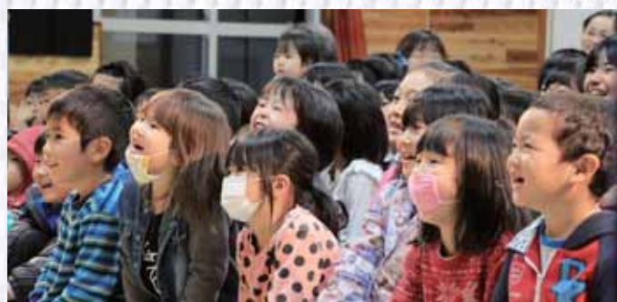
子どもたちの弾ける笑顔で準備の苦労もどこへやら