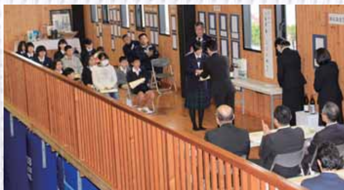
授賞式は木材がふんだんに使われた酒造蔵にて