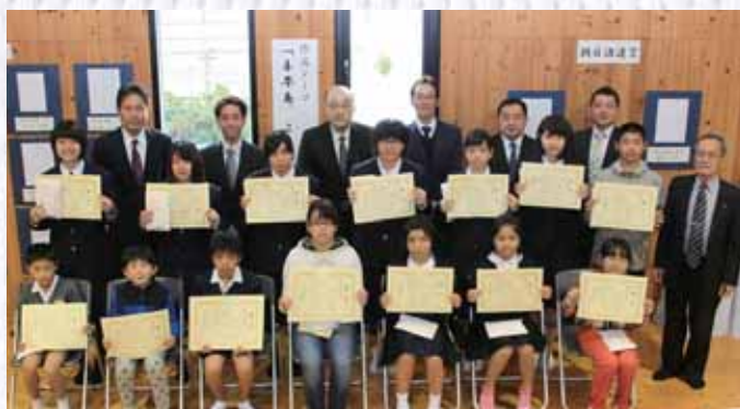
審査員泣かせの力作ぞろいでした！