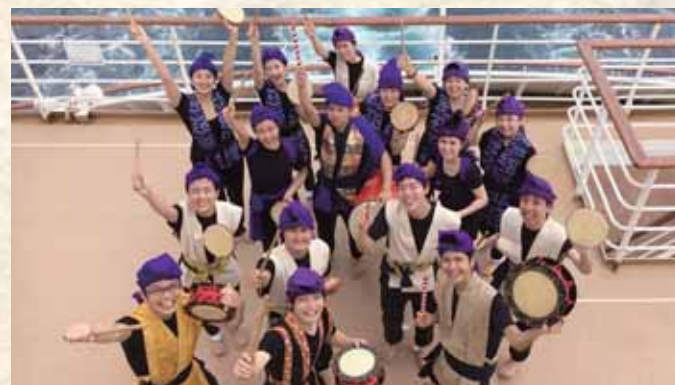
エイサーを終え、皆と記念の1枚