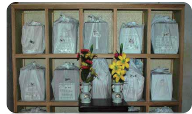
お骨・お位牌預り

「永代供養」とは、これから家や親戚のお墓を見守っていくことが難しいかたに代わって、お寺が責任を持ってお預かりし永代に供養していくことです。詳しい事はお気軽にお問い合わせください。宗教、宗派は問いません。