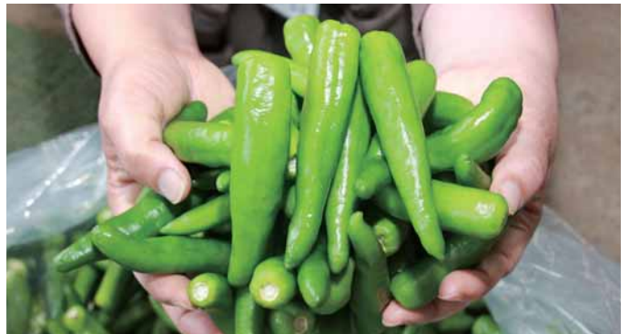
収穫したての喜界島産トウガラシ（品種は京新清水 きょうしんしみず ）