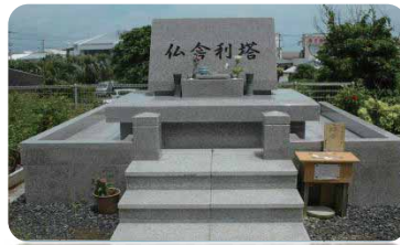
永代供養墓(仏舍利塔)