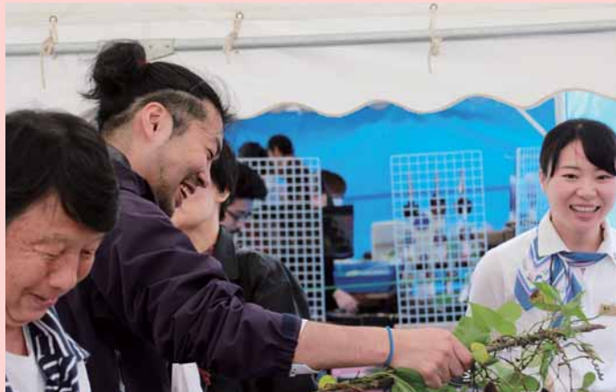
ぱしふいっくびーなす寄港時おもてなし活動中

まだまだわからないことばかりですが、地域の皆さまとのつながりを大切にしながらやってきこうと思っておりますので、よろしく願います！