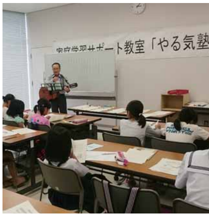
教育長のギターで英語の学習

5月21日(土)に平成28年度「喜界町家庭学習サポート教室」やるき塾」の前期(5〜10月)の開講式が喜界町役場トレーニング室で行われました。