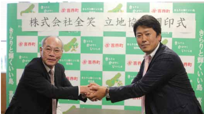
調印後に固い握手を交わす

ウガラシ栽培の普及促進を積極的に図ったことも評価され、今回の工場設置に至った。工場は、小野津集落にある旧デイサービスセンター潮観園を改修して整備する。営農支援センターの担当者は「これまで夏場の換金作物はゴマのみであったが、トウガラシが新たな換金作物として加わったことは大きい。1年を通して収穫が可能で、さとうきびと比べて単収も高いので期待できる」と話した。町としては、4月の(株)南西テレワークセンターに続き2社目の立地協定締結企業となり、雇用創出と産業振興による地域活性化につながる事が期待される。