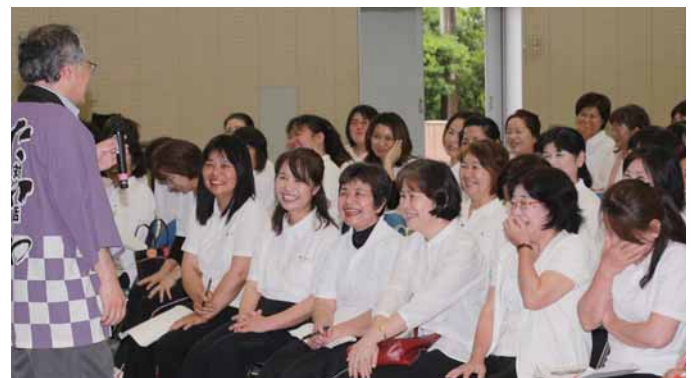
会場は爆笑に次ぐ爆笑の渦に巻き込まれた！！