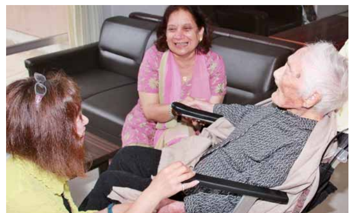
ナビさんと手を繋ぎながらの談笑