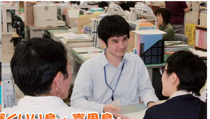
「小粒でもきらいと輝くいい島・喜界島」