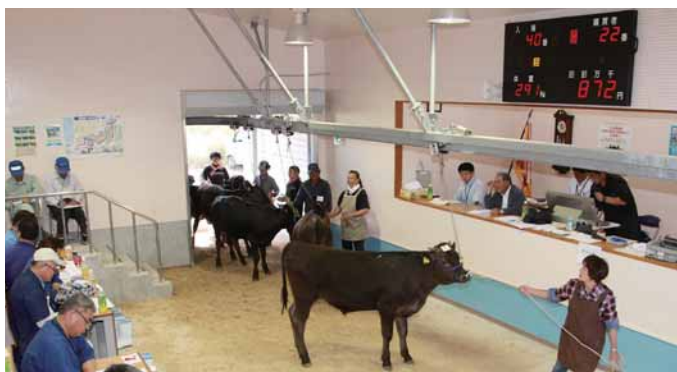
高値での取引が続出した

好調な相場をキープしている子牛セリ市が5月12日、喜界家畜市場で開催された。当日は序盤から70～80万円台の取引が続出し、前回のセリを更に上回る好調な相場ぶりを物語っていた。圧巻だったのは取引も中盤を過ぎたところ、会場内のどよめきとともに群島内最高価格の110万円の取引が成立した瞬間だった。町農業振興課畜産担当者は「高値での取引は畜産農家にとっては良いことだが、あまり高くなりすぎると購買者の経営を圧迫しかねない。今後は購買者のニーズに合う子牛育成を行い、市場価値を高めていきたい。当分は高値での取引が継続するだろう」と語った。