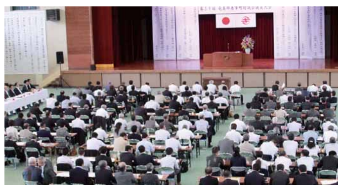
広い会場も多数の参加者で埋め尽くされた

第59回奄美群島市町村議会議員大会が5月19日、群島内12市町村の議員や首長など約200名をあつめて町体育館で行われた。大会では喜界町が提出した喜界高校に特別支援学校高等部の分教室または特別支援学級設置の議題などが採択された。会場内には、サンゴ礁科学研究所や城久遺跡群に関するコーナーも設けられ、喜界島のホットな話題に見入る参加者も多数見られた。また、昼食時には特製ヤギ汁も振る舞われ、参加者たちはシマのおもてなしに舌鼓を打っていた。