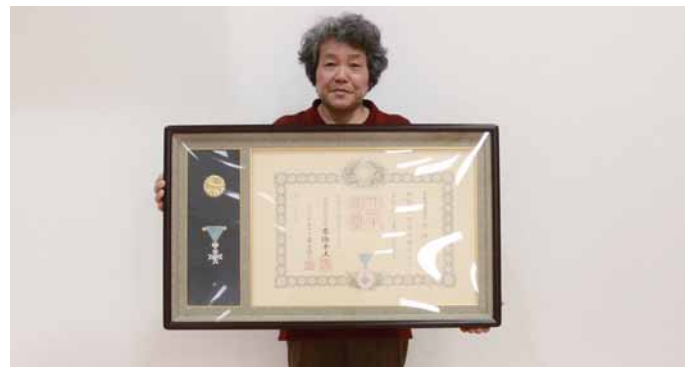
ずいほうたんこうしょう 瑞宝単光章を受章した体岡さん