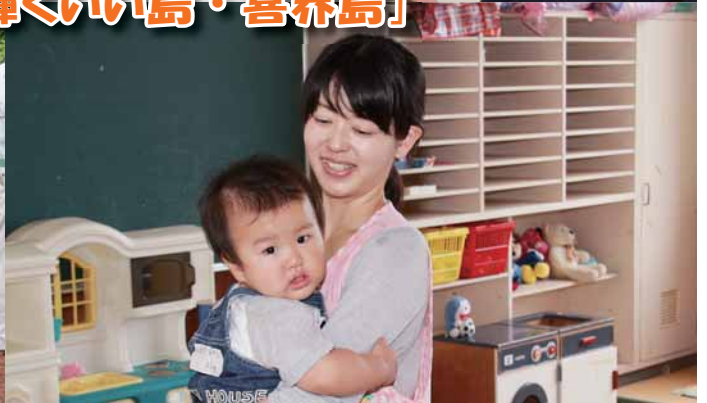
【写真は平成 28 年度採用職員】