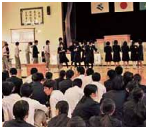
選挙の模擬体験をする喜高生ら