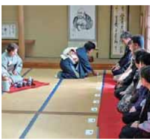
茶道教室によるおもてなし

発表は緊張しますが、いつでもどこでも演奏できるのが一番ですね。これからも頑張って続けていこうと思っています。」と満足げに話しをされているのが印象的でした。