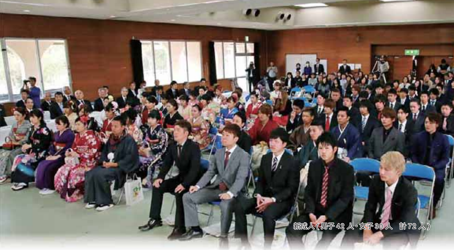
新成人(男子42人・女子30人 計72人)