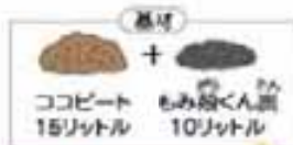
基材 ココピート 15リットル もみ殻くん炭 10リットル