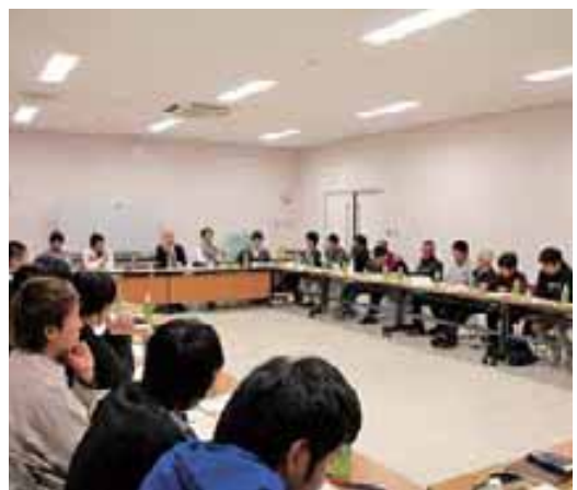
よりよい島について語り合う青年ら

町 企画観光課地方創生推進室は11月27日、役場会議室で「地方創生青年会議」を開催し、各集落から約40人の青年らが参加した。