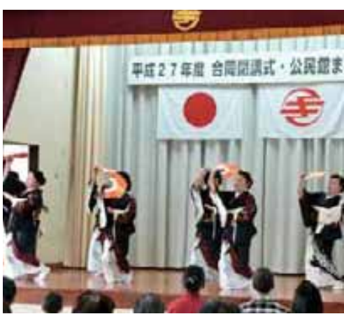
舞踊教室による発表

舞台発表では、ビデオ教室の作品放映を皮切りに、オカリナ教室の生徒による演奏や舞踊教室など多彩な演目で会場を沸かせました。