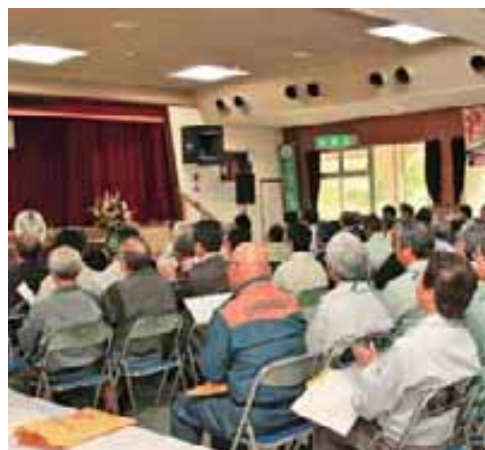
森林保護を謳ったスローガンも採択された

でマングローブ、サンゴ礁など独特の生態系があり、数多くの固有種が存在する場所。支庁でも各関係機関と連携をとり、世界自然遺産登録を目指している」と述べた。