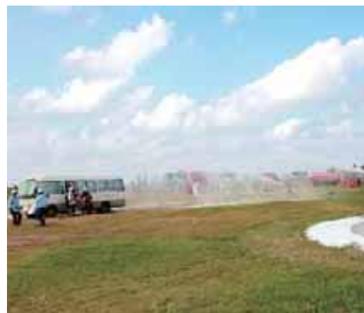
関係機関が連携し迅速な訓練が行われた

喜 界空港管理事務所は11月24日、「空港での航空機事故対処部分訓練」を喜界空港内で行った。この訓練は、奄美警察署の協力のもと各関係機関が連携し空港内の安全管理のため実施している。