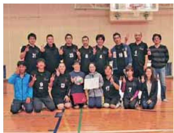
A級初優勝の昭和48年生チーム

大会には、40歳以上のチームが出場するA級の部と、50歳以上のB級の部に全15チームが出場し、年齢を感じさせない元気潑刺としたプレーで熱戦が繰り広げられた。