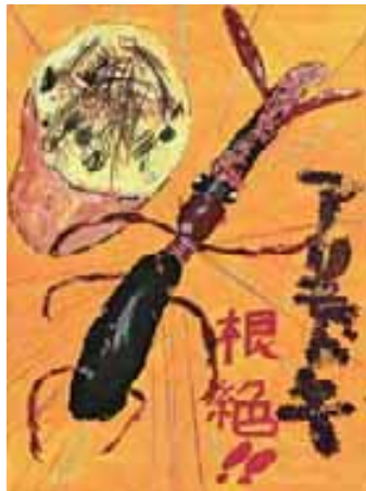
【ポスターの部・最優秀賞】