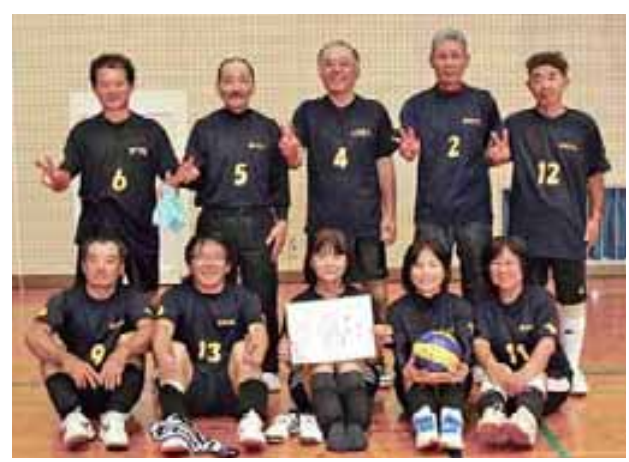
B級初優勝の昭和32年生チーム