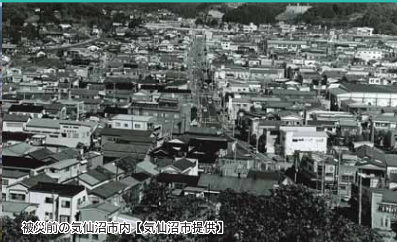
被災前の気仙沼市内

被災から3年も経つが、いまだに平日はほぼ残業で、土日も説明会などでほとんど休みが取れない状況であったが、不便な仮設住宅生活を余儀なくされている市民が、一日でも早く新しい生活を始めるためには、多少の無理もいとわないと課内全員で頑張った。