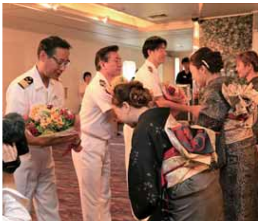
船長らに花束を渡す大島紬姿の贈呈者ら

同船は昨年3月、同じく湾港に着岸を試みたが、天候不良のため着岸できず、喜界島を楽しみにしていた乗客を出迎えた町民らは、残念な思いでその姿を見送った。今回は前回のリベンジでの寄港だった。当日はあいにくの悪天候であったが無事着岸し、関係者らはほつと胸をなでおろした。