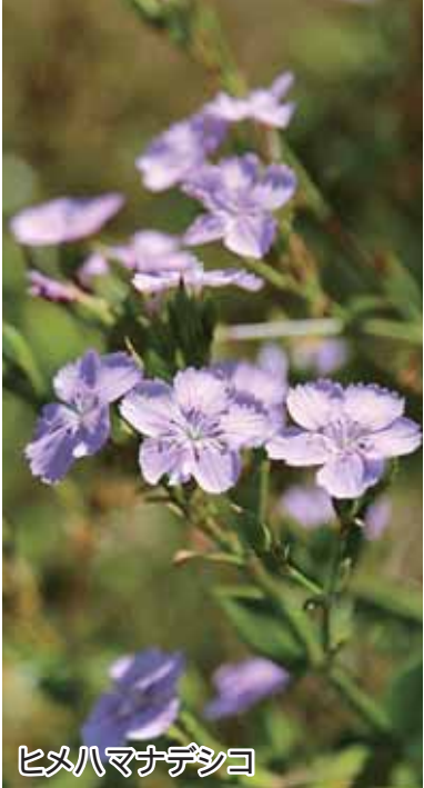
ヒメハマナデシコ

荒木漁港周辺に咲くヒメハマナデシコ。ヒメハマナデシコ(姫浜撫子)は、和歌山県から沖縄県西表島までの海岸や岩場に生える多年生草木で日本の固有種。ナデシコ科に属し、高さ10~30cmほど。花は1~6個まばらにつき、赤や紫の花を次々に咲かせる。根は木質化し、横にはうか斜上する。花言葉は「純粹」