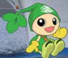
喜界町キャラクター よるこびと