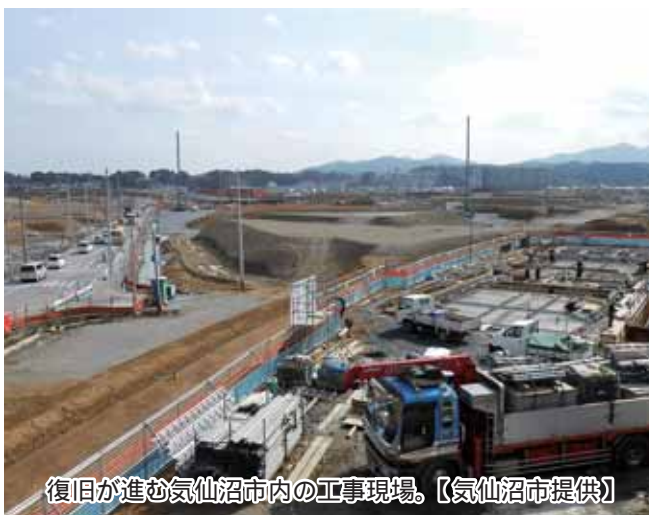
復旧が進む気仙沼市内の工事現場。

きにはまず逃げることに。命さえあればやり直すことができるので、絶対に命を落とさないこと」を再認識してください」 取材を終え、震災から4年が経過した今でも、復興は道半ばということが理解できた。これから復興にはどのくらいの期間がかかるのだろうか。これから私たちが被災者のために何ができるのだろうか。この機会にもう一度考えてみたい。