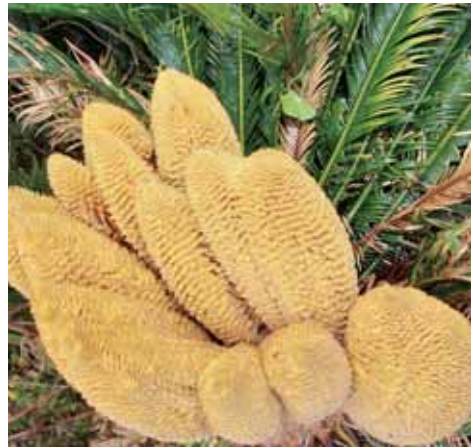
見事なソテツの雄花

立派なソテツの雄花が5月中旬旬、先山集落上の農道沿いに出現し、道行く町民を驚かせた。