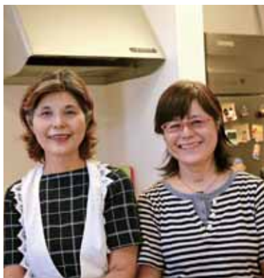
ご来店お待ちしております!!