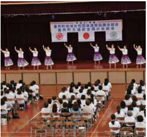
オープニングのフラダンスは会員らを魅了した

その後は、昨年度の事業経過や決算報告、今年度の会計予算案や規約改正などがあつた。さらに、『地域女性団体活動に期待するもの』と題した積山泰夫教育長の講話なども行われた。