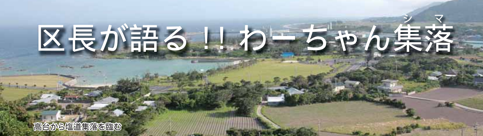
高台から塩道集落を臨む