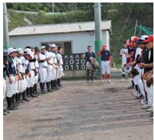
お互いの健闘をたたえ合い整列する選手ら