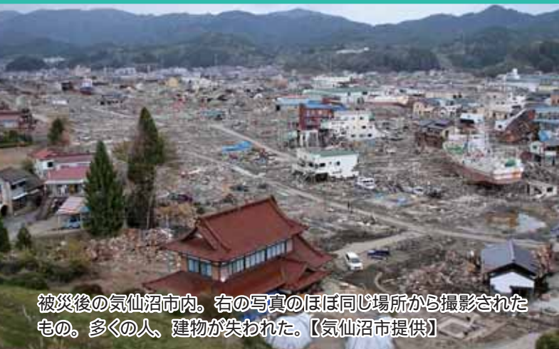
被災後の気仙沼市内。右の写真のほぼ同じ場所から撮影されたもの。多くの人、建物が失われた。