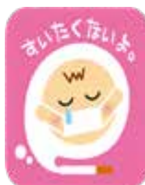
受動喫煙 シンボルマーク

換気扇下やベランダ喫煙では受動喫煙の防止にはならず、空気清浄機も有害物質の除去は出来ません。吐き出した息の中には、多くの有害物質が混じっています。一酸化炭素は最後の1本を吸い終わってから8時間は出ています。つまり、吐く息で有害物質をまき散らしていることになるのです。