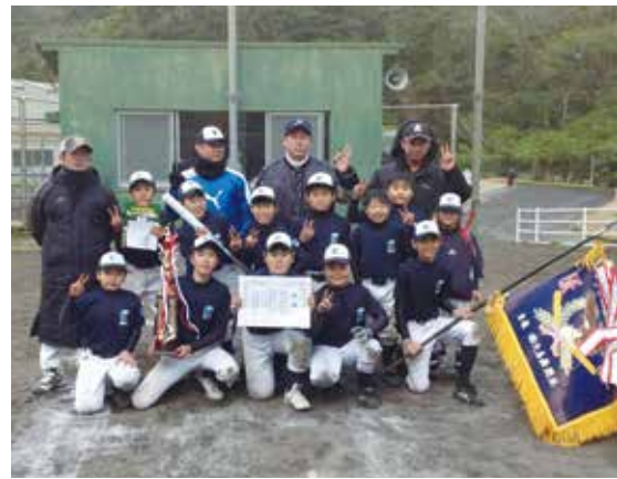
悲願の初優勝を果たし、優勝旗を手に記念撮影