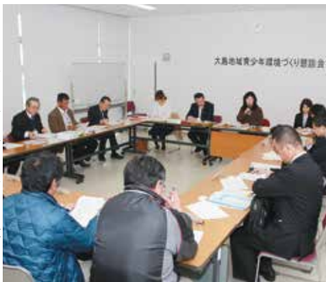
大島地域消費生活相談所からも青少年が多くの犯罪に巻き込まれているという事例が紹介された

大島支庁総務企画課が主催する『平成26年度大島地域青少年環境づくり懇談会』が2月12日、役場会議室で行われた。会には、町教育委員会や青少年育成町民会議役員など学校関係者らが参加し、青少年の現状などについて確認した。