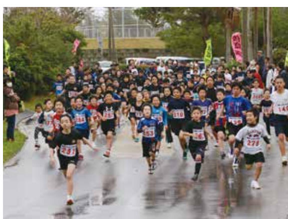
一斉に駆け出すランナーたち