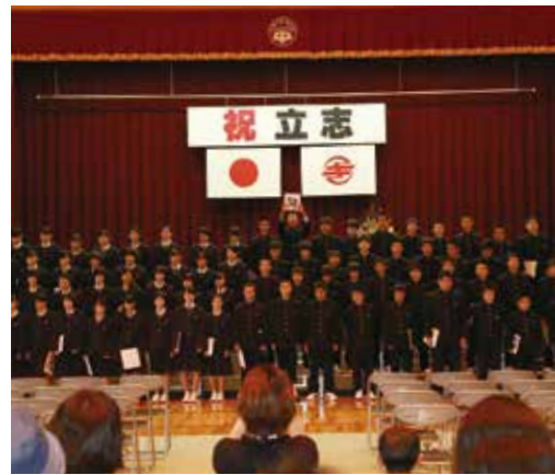
式後に行われたセレモニーの様子