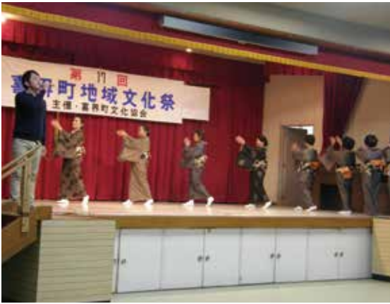
壇上で踊る赤連集落民ら

外内会長は「この祭りは地域の伝統文化を守っていくことを目的に開催している。当初に比べ所属団体も増え年々活動が活発になっている。多くの団体に加入してほしい」と呼びかけている。