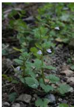
ヒメタツナミソウ

全国的に重要文化財の盗難や落書きが報告されています。本町指定の文化財は48点あり、全てが本町の貴重な財産です。文化財を後世に残し、伝えていくためにも、故意に手をかけたり、いたづら等をしないようにしましょう。