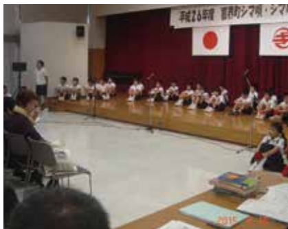
地域の人たちから習った方言を使って発表する児童

当日は、町内の各学校から約百名の児童生徒が出演し日頃練習してきたシマ唄やシマゆみたを堂々と大勢の聴衆の前で発表しました。