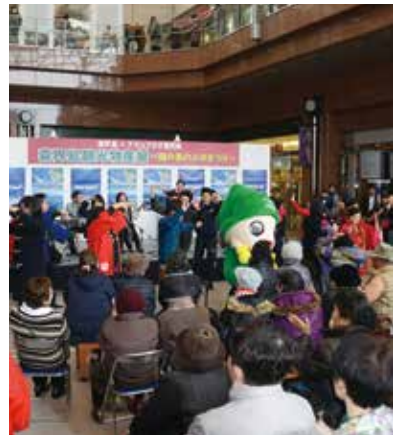
アミュ広場で喜界島をPR