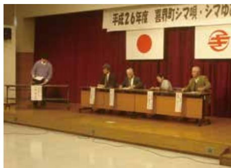
発表する集落代表の皆さん

舞台では、昨年ヒットした「アナと雪の女王」の主題歌「ありのまま」を方言で披露したり、郷土学習の成果を方言で披露するなど会場に詰りかけ