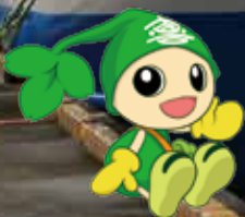
喜界町キャラクター よるこびと