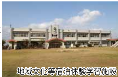
地域文化等宿泊体験学習施設

旧暦8月15日に五穀豊穡を祈願して行われる祭り。ほとんどの行事は一緒に行うが、この祭りは、前金久は金久公民館前庭、神宮はトマンニャラー（ゆき食堂