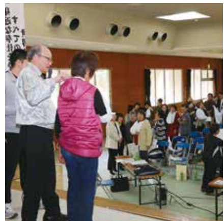
応急手当のしかたを学ぶ受講者ら