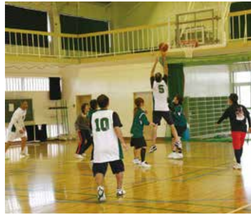
思い出が詰まったゴールでプレーする選手ら