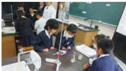
【公開研究会の様子】

1月23日（金）に早町小学校は、「学力向上」の取組について研究公開を行いました。「互いに伝え合い高め合う対話活動の実践」を研究主題とし、授業のねらいを達成するために、対話活動をどのように位置付けると効果的なのかについて研究を進めてきました。発問や提示資料の精選や提示方法の工夫、児童同士の意見が付きあがり深まってくるような教師の働きかけ、ICT活用や授業形態の工夫など研究の成果を発表しました。当日は、地区・町の教職員や保護者約68名の出席がありました。公開授業後に実施された分科会・全体会での研究協議では、学力向上に向けた授業改善の取組について熱心な意見交流が行われました。平成27年度は、喜界小学校の公開研究会も予定されています。