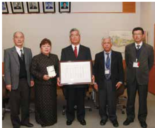
町長室で御下賜金を報告後、記念撮影