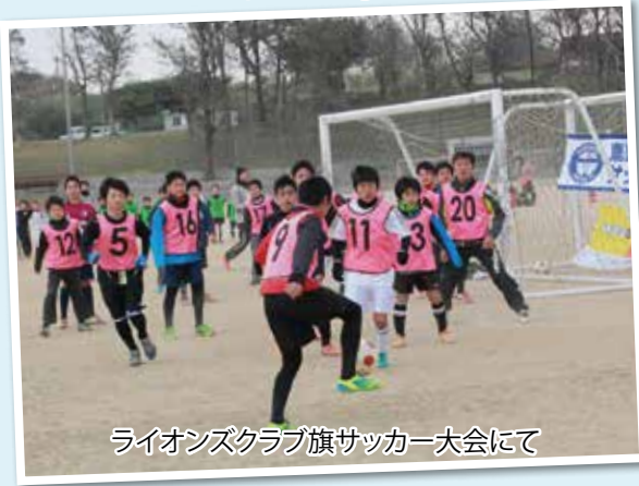
ライオンズクラブ旗サッカー大会にて