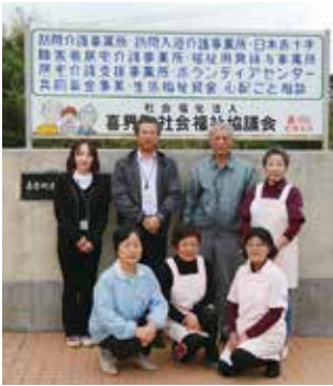
社会福祉協議会 喜界町赤連22 喜界町喜界449 喜界町喜界449 喜界町喜界449

『いきいきサロン』は、本誌の『まだわあさん』の取材中、特に女性の高齢者からよく話題に上がり、「私の生きがいです」「この日が待ち遠しい」と語る方が多い。元気のある高齢者が、これからも健康で心豊かな生活を過ごすうえでの一助となっているようだ。