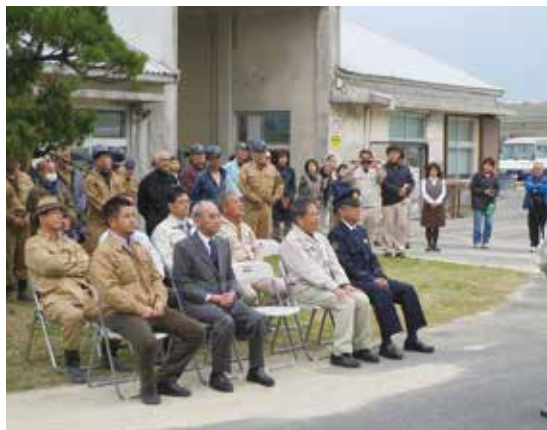
出発式は多くの関係者が見守るなか行われた

同社によると、前期実績約2千ト減の7万8000トを見込み、1日あたりの搬入予定数は、870ト。今期は10月の台風18・19号襲来により、葉部裂傷などが発生し糖度が落ち込んだ。その後も新葉の再生に時間がかかったことなどの理由から、