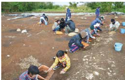
発掘体験（川寺遺跡：手久津久）

前日は午前中には発掘体験、午後からは文化財巡りを実施し、2日間の延べ参加者は約300人に上り、このシンポジウムが「町民が文化財を少しでも身近に感じる機会」となったようでした。