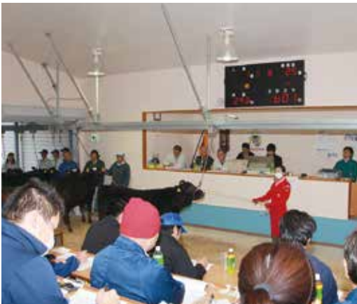
今年も好調な出足をみせた町畜産業界

近年、本町の畜産は販売頭数、総売上金額ともに増加傾向にある。昨年は総売上価格で初の6億円越えを達成しており、大島地区肉用牛振興大会でも本町の代表牛が総合の部で2連覇を達成した。