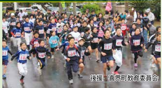
後援 喜界町教育委員会

俊寛ジョギング大会事務局 喜界町役場 黒田・古沼 TEL 0997-65-1111 FAX 0997-65-4316