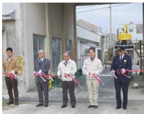
期間内の安全を祈願しテープカットが行われた

糖度上昇が遅れ、前期の年内操業（12月17日）と比べて約20日遅い操業となった。