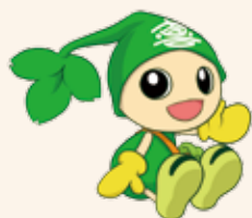
喜界町キャラクター よろこびと