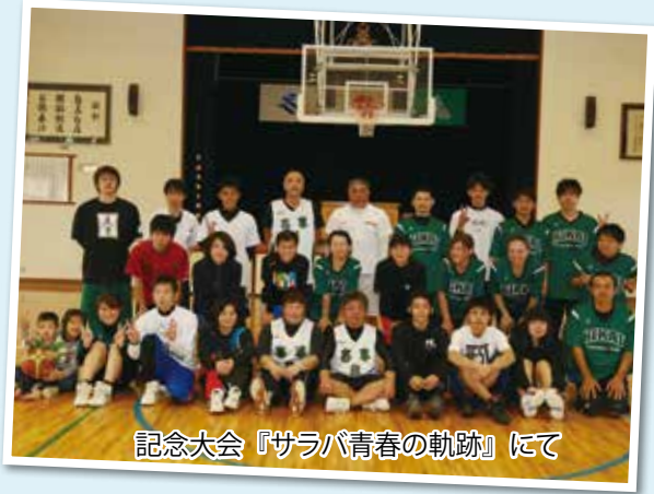
記念大会『サラバ青春の軌跡』にて