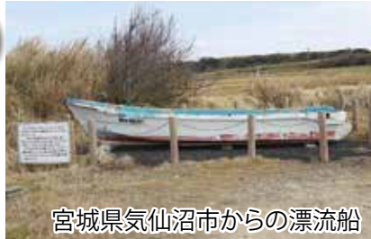
宮城県気仙沼市からの漂流船

伊実久集落区長。区長14年目。昭和15年生まれ。戦前の動乱の時期に、台湾で生を受ける。終戦後、島に帰省。早町小、早町中、喜界高校を卒業。卒業後は中京大学に通いその後、大阪の商社に入社。15年勤めたあと再び島に帰省し、現在は区長として集落のために尽力している。