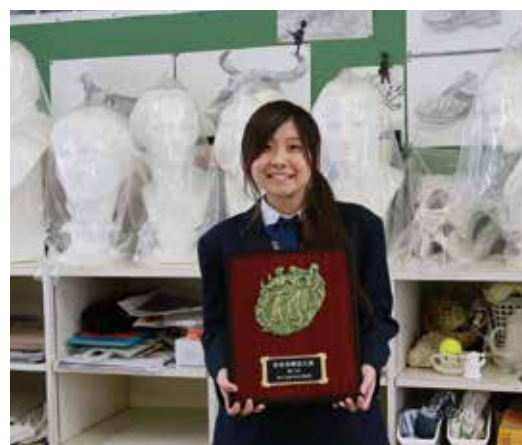
この作品が生まれた美術室で盾を持って記念撮影

る名門校・松陽高校が独占した。各賞で名門校が上位を連ねるなか、各校を抑えての受賞となった。