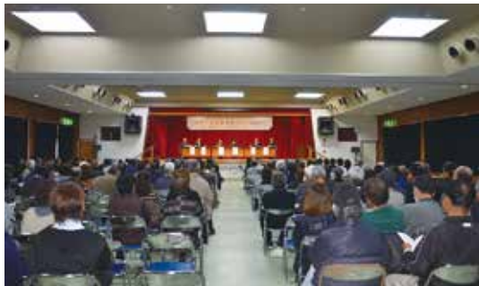
シンポジウム会場（討議）

文化庁の補助事業である史跡等総合活用支援推進事業を活用して「古代・中世喜界島からの招待状」〜城久遺跡群の発掘調査成果と未来〜と題してのシンポジウムを1月11日（日）に自然休養村管理センターで開催しました。このシンポジウムは、多くの考古学・歴史学研究者の注目を集める本町の遺跡群について、その歴史的評価を町民とともに考え、ふるさとに眠る貴重な文化財を知る機会となることを期待し、島外から5名の研究者をお招きして行いました。