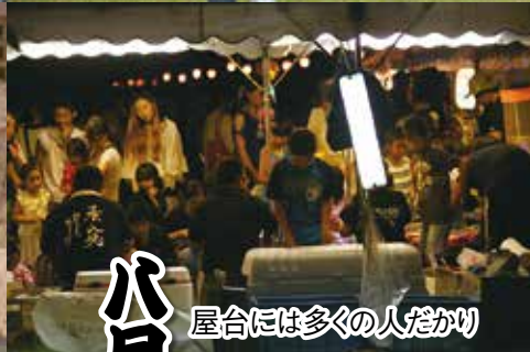
屋台には多くの人だかり