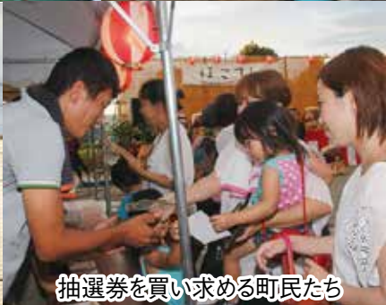
抽選券を買い求める町民たち