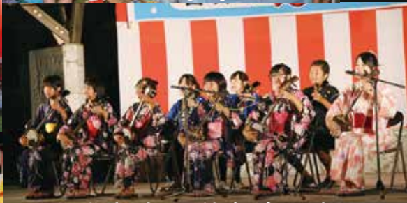
若手唄者たちが力強い島唄を歌う