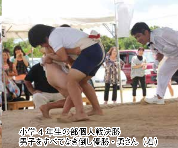
小学4年生の部個人戦決勝 男子をすべてなぎ倒し優勝・勇さん (右)