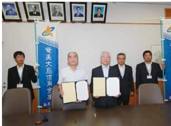
協定書にサインした町長（左）と築理事長（右）