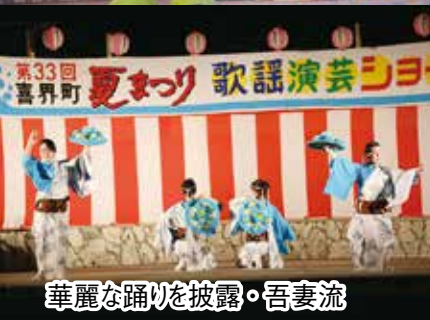
華麗な踊りを披露・吾妻流