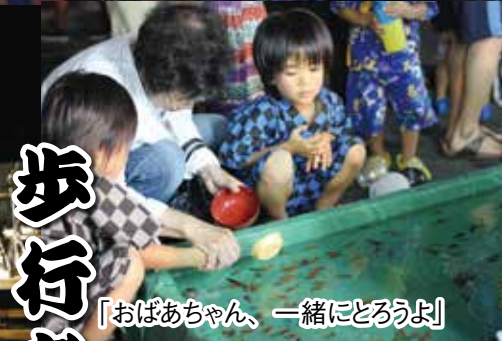
「おばあちゃん、一緒にとろうよ」