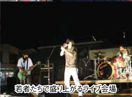
若者たちで盛り上がるライブ会場