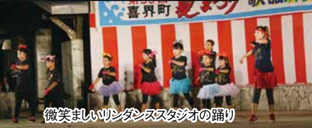
微笑ましいワルダンススタジオの踊り