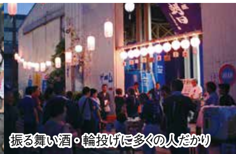
振る舞い酒・輪投げに多くの人だかり