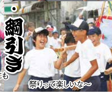
祭りって楽しいな~