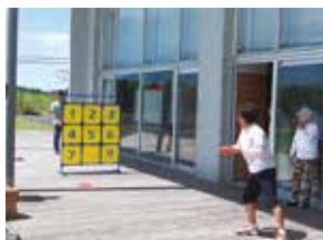
ニュースポーツを楽しむ