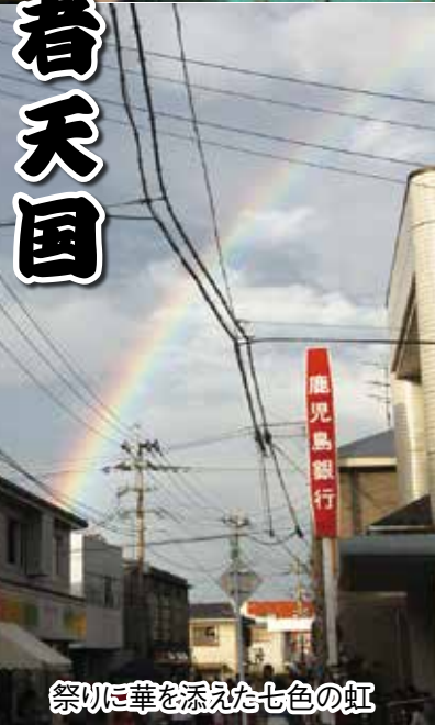
祭りに華を添えた七色の虹