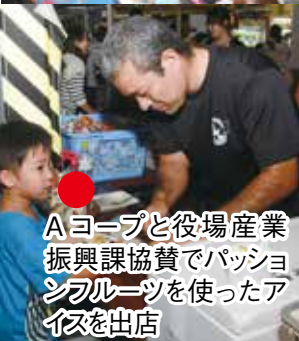
Aヨープと役場産業 振興課協賛でパッション フルーツを使ったア イスを出店