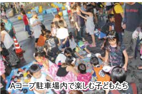
Aヨープ駐車場で楽しむ子どもたち