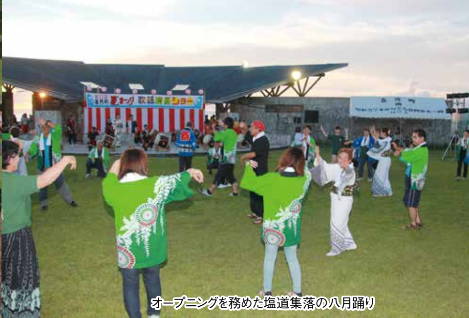
オープニングを務めた塩道集落の八月踊り