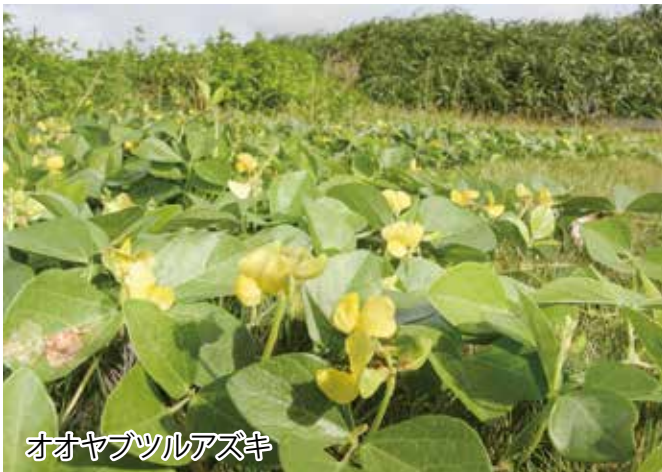
オオヤブツルアズキ