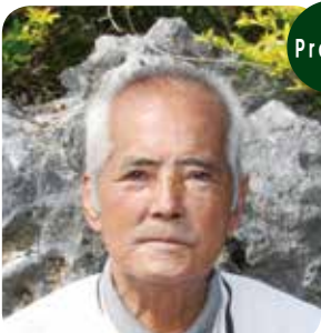
Profile 田中三三 区長(68)

先内区長。区長歴は2期目に入ってから1年目。昭和32年生まれ。32歳で島を出て、52歳の時にUターン。現在は父親の農業を受け継ぎ規模拡大を図る。趣味は「ゴルフと魚釣り」と語る。