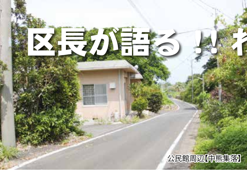
公民館周辺【中熊集落】