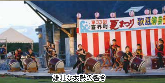
雄壮な太鼓の響き