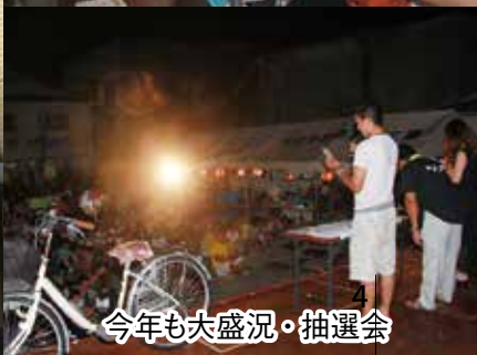
今年も大盛況・抽選会