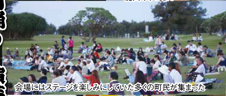
会場にはステージを楽しみにしていた多くの町民が集まった