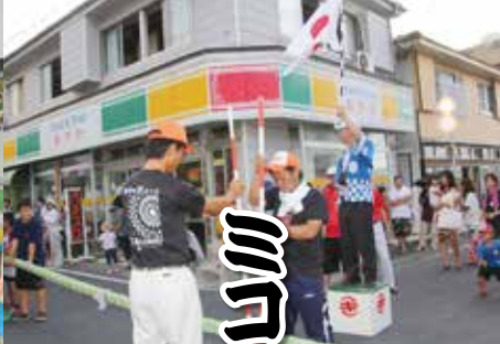
大人も負けじと引っ張る