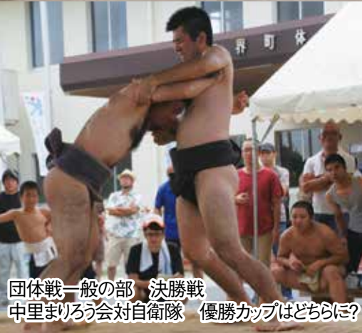
団体戦一般の部 決勝戦 中里まいるう会対自衛隊 優勝カップはどちらに?