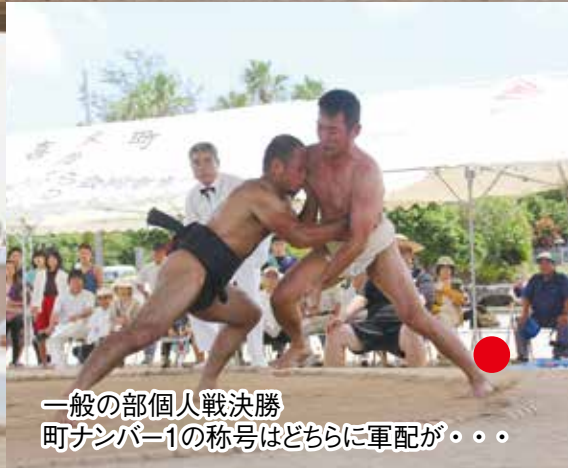
一般の部個人戦決勝 町ナンバー1の称号はどちらに軍配が・・・