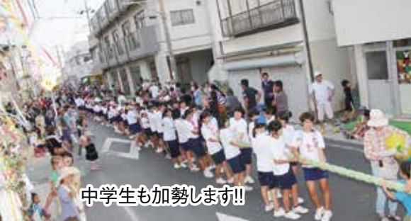
中学生も加勢します!!