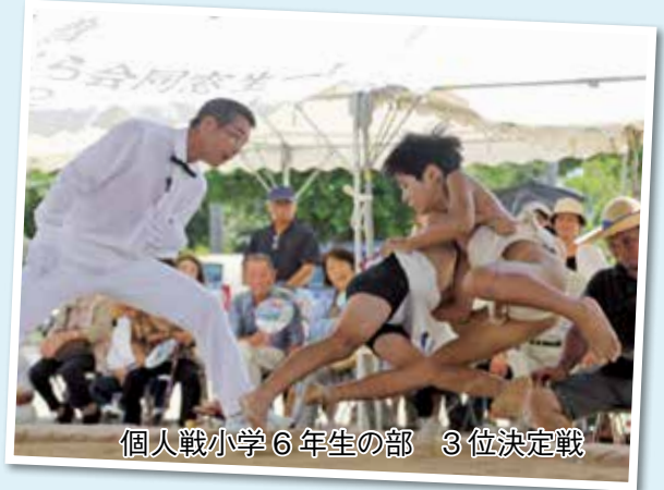
個人戦小学6年生の部 3位決定戦