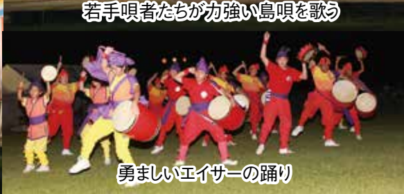
勇ましいエイサーの踊り