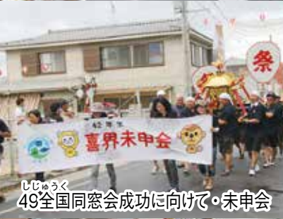
49全国同窓会成功に向けて・未申会