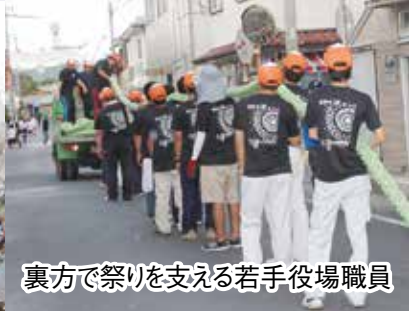
裏方で祭りを支える若手役場職員