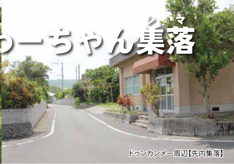
ダウンカンメー周辺【先内集落】