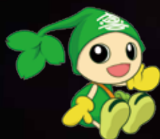
喜界町キャラクター よるこびと

「第33回喜界町夏まつり」 は台風11号の影響により延期 開催となった。詳しくは本誌 2p〜。