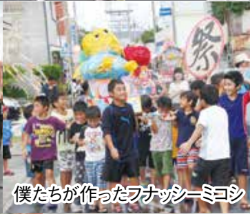
僕たちが作ったフナツシーミヨシ