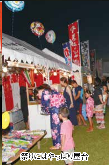
祭りにはやっぱり屋台