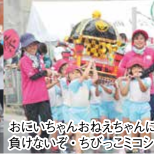
おにいちゃんおねえちゃんにも 負けないぞ・ちびっこミヨシ