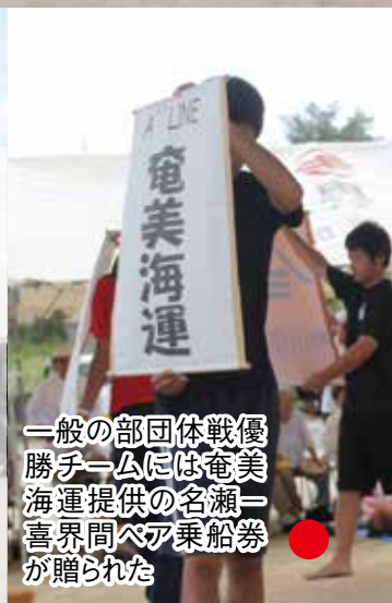
一般の部団体戦優勝チームには奄美海運提供の名瀬一喜界間ペア乗船券が贈られた