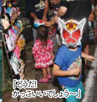
「どうだ かっていいでしょう~」