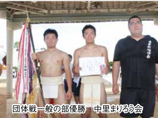
団体戦一般の部優勝 中里まいるう会