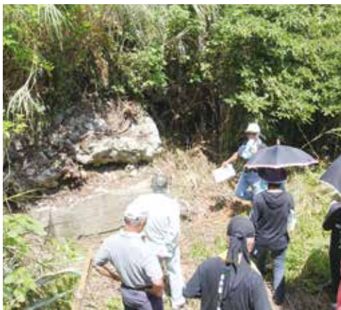
百の台海面砲台座跡で職員の説明を受ける参加者たち

中 中央公民館が主催する戦跡バスツアーが8月24日に行われ、18人の町民が参加した。参加者たちは喜界島郷土研究会の案内で町内に数多く残る戦跡のうちの9箇所を巡り、最後には戦没者慰霊の塔で献花、黙祷した。