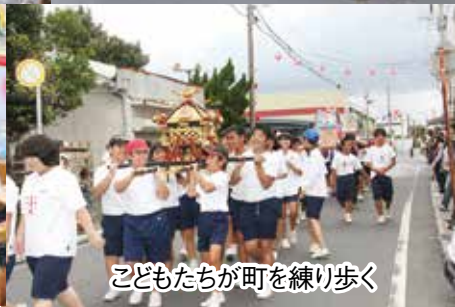
子どもたちが町を練り歩く