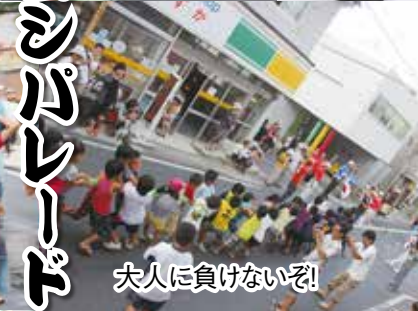
大人に負けないぞ!