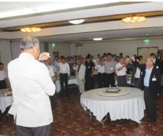
焼酎乾杯条例により『焼酎で乾杯!』

全国喜界会連合会は、東京、関西、福岡、鹿児島、沖縄に在住する本町出身者を中心とする会員で組織している団体で、会員の交流を深める様々なイベントなどを開催している。