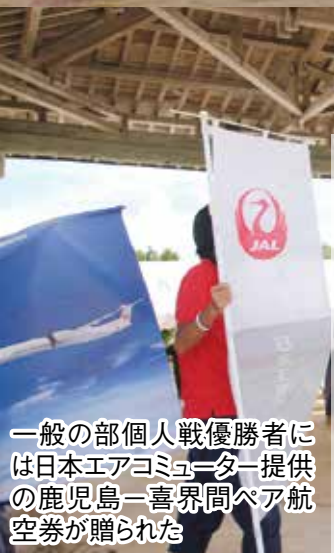
一般の部個人戦優勝者には日本エアコミュニティー提供の鹿児島-喜界間ペア航空券が贈られた