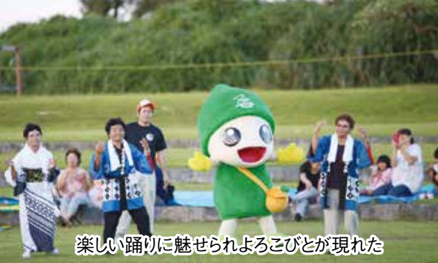
楽しい踊りに魅せられよこびとが現れた