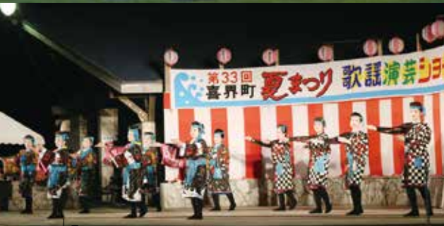
息が合った踊りを披露・寿扇流