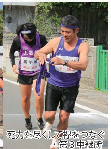
死力を尽くして襷をつなぐ ・第3中継所