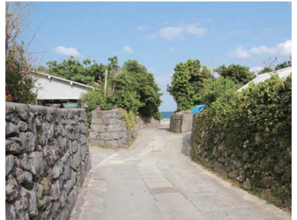
昔のままの景観を残す阿伝集落の石垣

木の処理や清掃など保存活動に努めている。空き家の管理など難しい点も多いが、これからもこの活動を継続していきたい。今まで頑張ってきた集落民みんなで、この受賞を喜びたい」と語った。