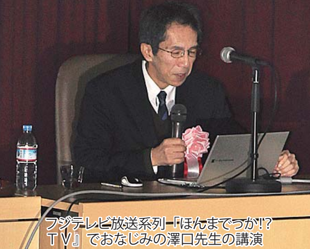
フジテレビ放送系列「ほんまでっか!? TV」でおなじみの澤口先生の講演