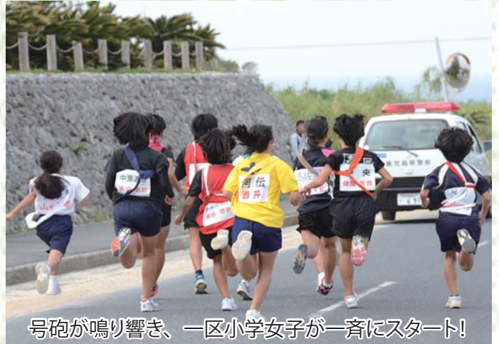
号砲が鳴り響き、一区小学女子が一斉にスタート!