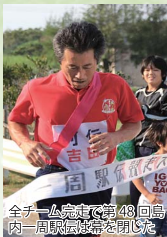
全チーム完走で第48回島内一周駅伝は幕を閉じた