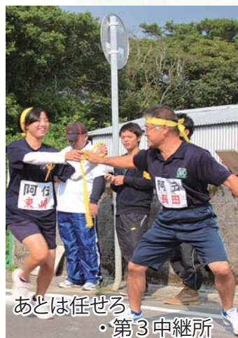
あとは任せる ・第3中継所