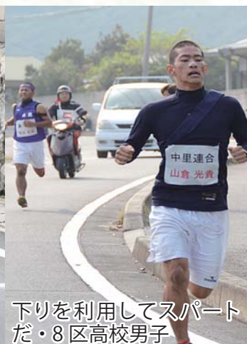
下りを利用してスパ ートだ・8区高校男子