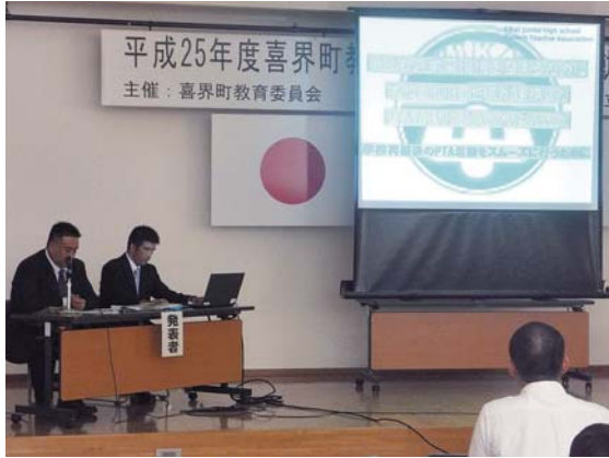
2年間の取組について、事例発表する喜界中PTA

学校再編後、第二回目となった研究公開は「子どもに家庭学習の習慣を身につけさせるためには、学校・家庭の連携や取り組みはどうすればよいか。」を研究主題に設定し、喜界中PTAから昨年度から実施してきたアンケート結果との比較や今年度取り組んだ「親子のふれ合い」や「地域との連携」な