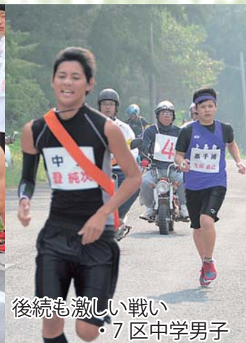
後続も激しい戦い ・7区中学男子