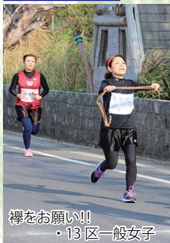
襻をお願い!! ・13区一般女子