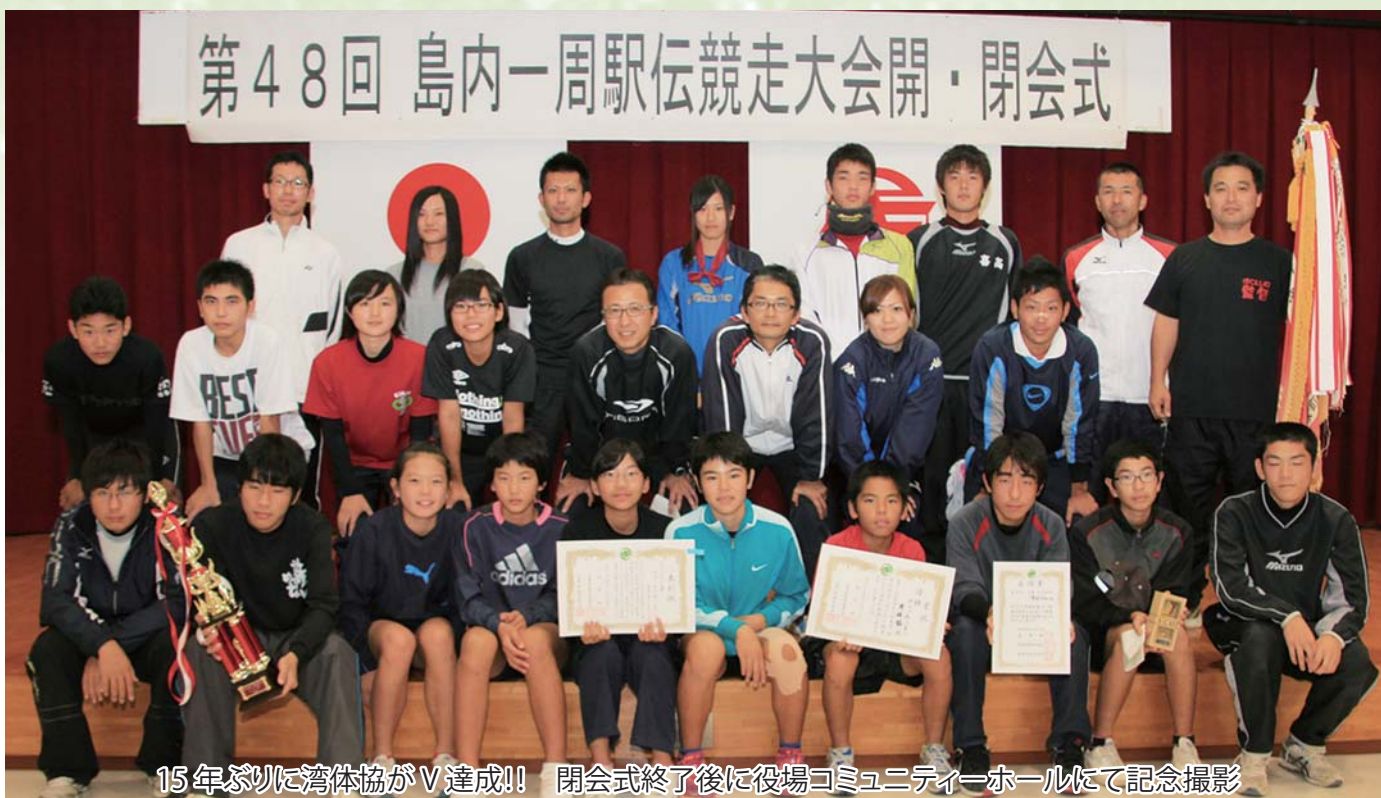
15年ぶりに湾体協がV達成!! 閉会式終了後に役場コミュニティーホールにて記念撮影