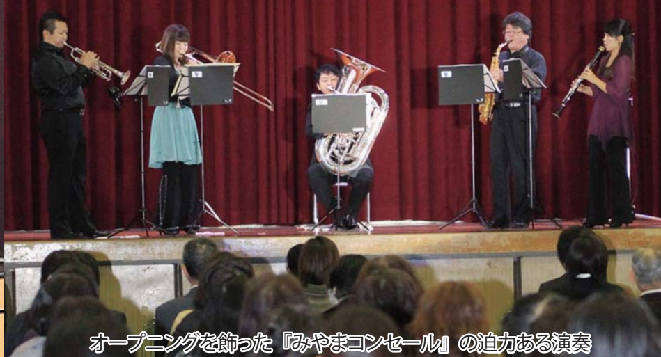
オープニングを飾った『みやまコンセール』の迫力ある演奏

「自ら学び、心豊かで活力に満ちた『うるおいのあるまちづくり』をめざして」～小粒でもキラリと輝くいい島づくり～をテーマに第17回喜界町生涯学習推進大会が11月24日、多くの町民参加のもと町総合体育館を主会場として行われた。オープニングは、鹿児島県文化振興財団霧島国際音楽ホール「みやまコンセール」の華麗な演奏が行われ、開会式では、国歌斉唱、町民憲章朗読などが行われた。式後、参加者はそれぞれの会場に分散し、分科会のテーマに沿った事例発表や実践事項について研究・討議し、次年度からの実践事項を決定した。また、アトラクションでは、アヌエヌエ・フラ教室のフラダンスや池治集落の八月踊り（西の辻）「忠臣蔵」などが披露され、会場の観客からは惜しみない拍手喝采が贈られた。