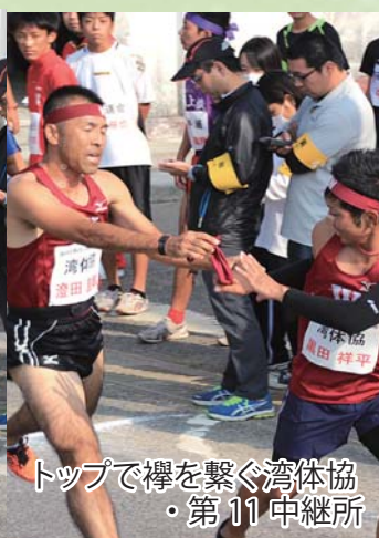
トップで襻を繋ぐ湾体協 ・第11中継所