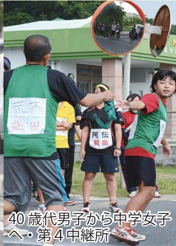
40歳代男子から中学女子 へ・第4中継所