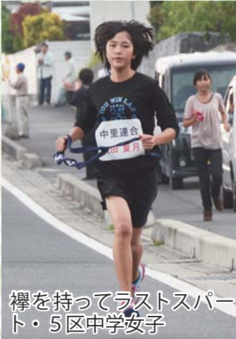
襷を持ってラストスパ ート・5区中学女子