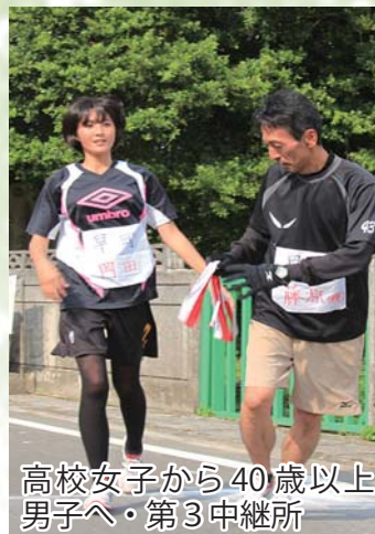
高校女子から40歳以上 男子へ・第3中継所