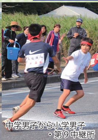
中学男子から小学男子 ・第9中継所