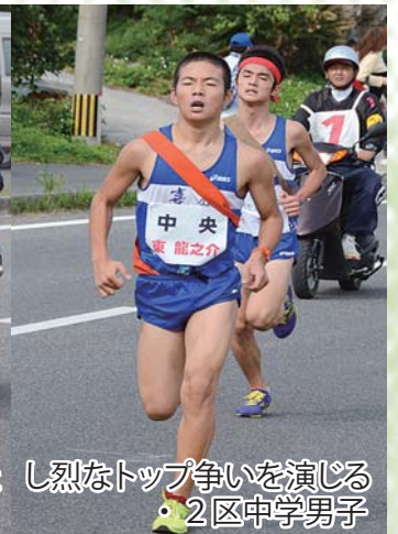
し烈なトップ争いを演じる ・2区中学男子