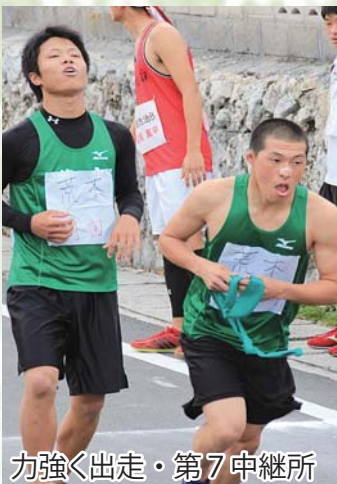
力強く出走・第7中継所