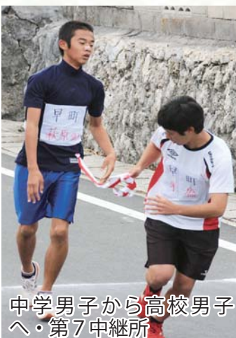
中学男子から高校男子 へ・第7中継所