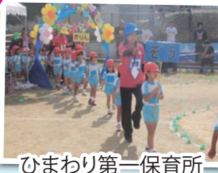
ひまわり第一保育所