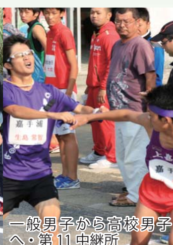
一般男子から高校男子へ ・第11中継所