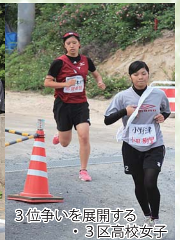
3位争いを展開する ・3区高校女子