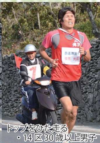
トップをひた走る ・14区30歳以上男子