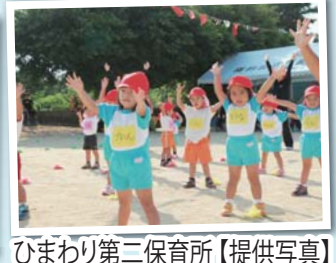
ひまわり第二保育所【提供写真】