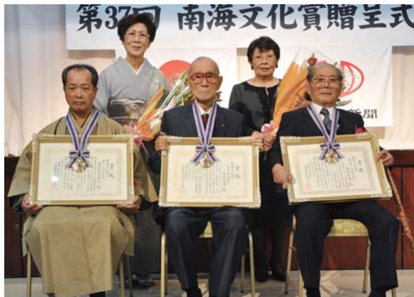
授賞式に出席した麓区長（前列左）

麓区長は「先達が残した海と石垣の景観保存活動が評価されてうれし。今も定期的に集落民総出で、雑