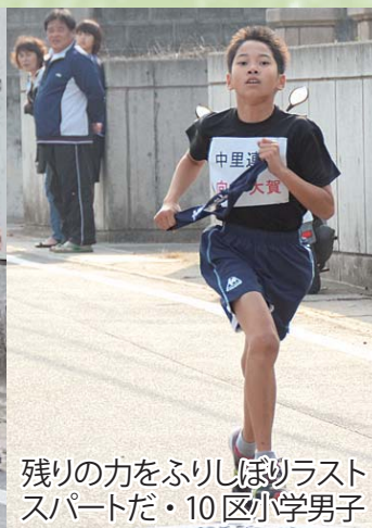
残りの力をふりしほりラストスパートだ ・10区小学男子