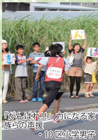
「がんばれ!!!」力になる家族らの声援 ・10区小学男子