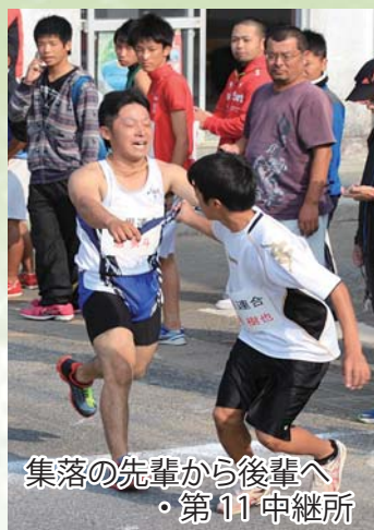
集落の先輩から後輩へ ・第11中継所