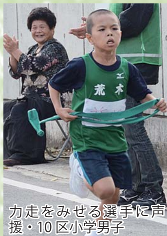
力走をみせる選手に声援 ・10区小学男子