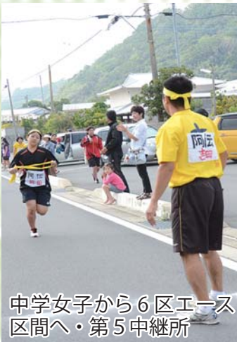
中学女子から6区エース 区間へ・第5中継所