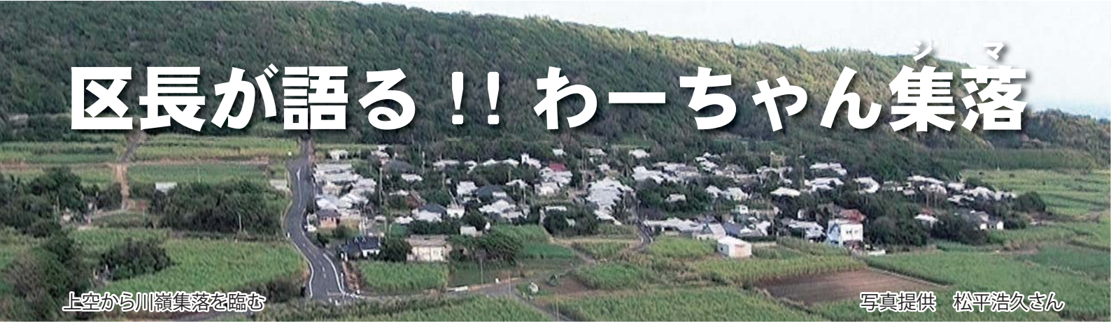
上空から川嶺集落を臨む