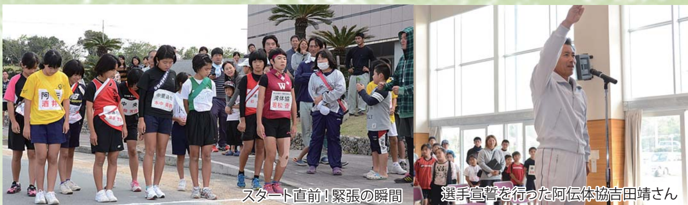
スタート直前！緊張の瞬間