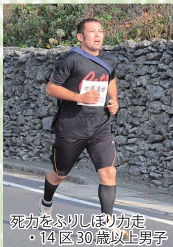
死力をふりしほり力走 ・14区30歳以上男子