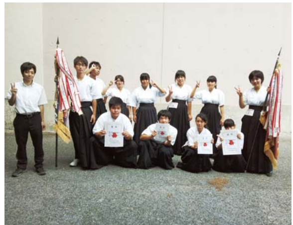
アベック優勝を果たした弓道部