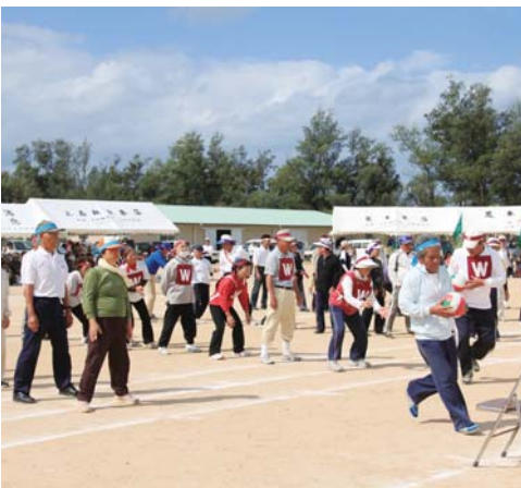
一生懸命に競技に取り組む会員ら

同連合会の会員らは、旧小学校区（旧湾小学校区は2チーム編成）10チームに分かれて、輪投げや玉入れなど11競技で競い合った。この日のために練習に励んできた会員らは高齢者とは思えない洗刺（はら）としたプレーに喜憂する姿が多く見られた。結果は、湾Aが2位の上嘉鉄から1点差で逃げ切り、10年ぶりの優勝を決めた。