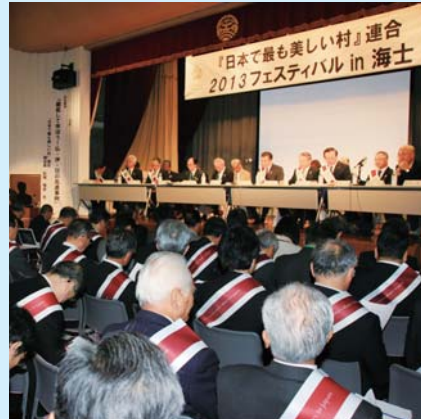
会場では加盟町村の様々な取り組みが紹介された

本町が加盟する「日本で最も美しい村」連合の「2013フェスティバル in 海士」が10月3～5日までの3日間、島根県隠岐郡海士町で開催された。同フェスには、この度新規加盟を果たした熊本県高森町などの5団体を含む54町村の首長などが出席し、同町の取り組みの紹介や活発な意見交換が行われた。