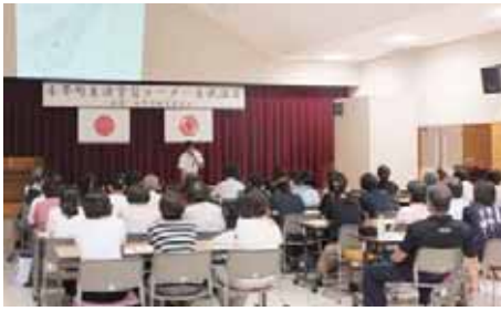
講義 「喜界島の遺跡について」では、現在、畑総事業で発掘中の手久津久地区の状況を中心に説明を行いました。

講義 「団体活動の活性化に向けて」(子ども会育成団体PTA対象)では、ブレインストーミングとKJ法を活用し、団体活動の活性化を図る目的に各自が自由に出したアイデアをグループで整理し、課題を明確に