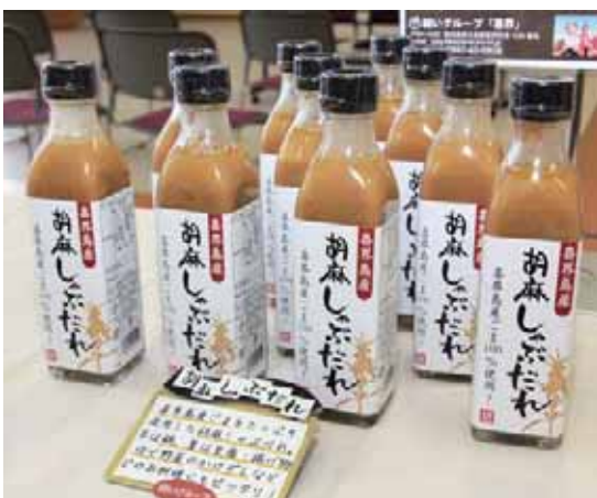
優秀賞を受賞した「胡麻しゃぶだれ」

同コンテストは、多様化する消費者ニーズに対応した商品づくりや、土産品等の開発・地域の資源を活かした各島一押しの特産品づくりを進めることなどを目的として、平成23年から開催され今回で3回目。