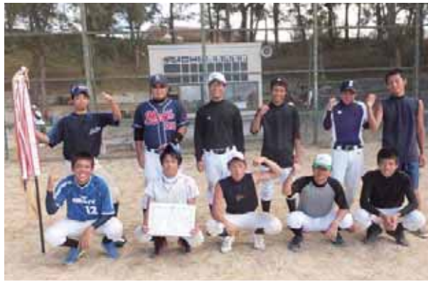
ソフトボール競技優勝荒木チーム