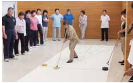
実技 「ニュースポーツ体験」では、年の差を感じさせないハッスルプレーが続出。

最後の実技 「ニュースポーツ体験」では、受講者全員が参加し、いつでも、どこでも、だれでも楽しめるニュースポーツで親睦を図りました。