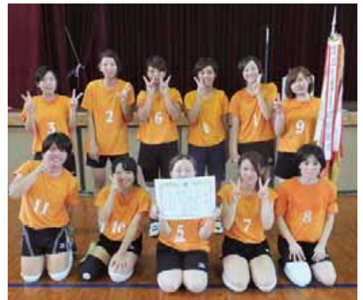
バレーボール競技優勝赤連チーム