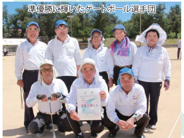
準優勝に輝いたゲートボール選手団