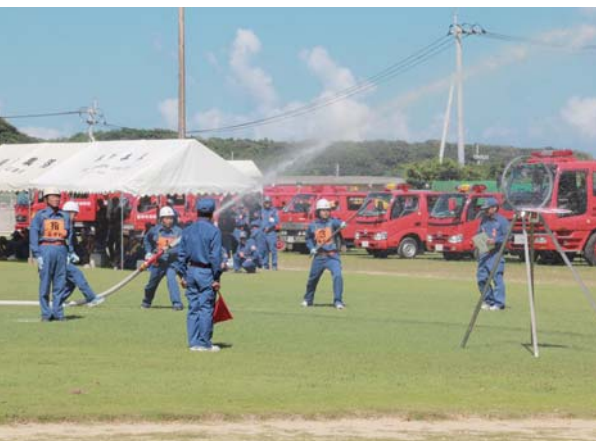
各分団の操法技術の披露があつた

勇団長は「われわれ消防団員は、町民の身体・生命・財産を守る義務がある。この日のために団員は休日を返上し練習を重ねてきた。この研修会が団員にとっていい研修会になってほしい」と期待を込めた。また、今年から加入した女性消防団員10人も研修会に参加した。