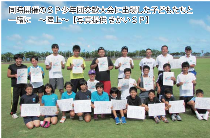
同時開催のSP少年団交歓大会に出場した子どもたちと一緒に ～陸上～