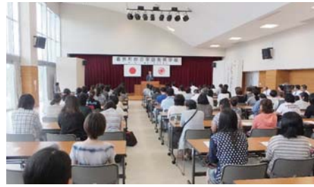
役場コミュニティホールに多くの関係者にお集まりいただきました。

の二つの自尊感情を育むために親は何をすべきか、どのように接するべきか、ご示唆をいただきました。