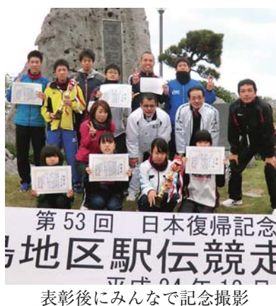
表彰後にみんなで記念撮影

第53回日本復帰記念大島地区駅伝走大会（奄美大島市町村体育協会主催）がこのほど、知名町役場を発着点に男女5区間（男子31.9キロ・女子15.8キロ）のコースで開催された。今大会には各市町村の精鋭男女25チームが参加。地元威信を懸け、健脚を競った。