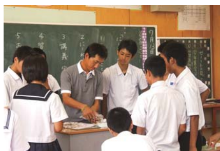
「にーねー先生に学ぶ」の様子

喜界中学校は、進路を選択する能力・態度を育成する「キャリア教育」の充実について功績が認められ、平成24年度文部科学大臣賞を受賞しました。喜界中学校で取り組んだ「キャリア教育」は、職場体験学習、職業人として活躍する先輩を講師として招聘する「にーねー先生に学ぶ」、連携型中高一貫教育における進路講演会や総合的な学習の時間「きかい学」の成果発表などで、6年間を見通した進路指導を行っています。多くの地域の方々を支えられて受賞できた賞です。心より感謝申し上げます。