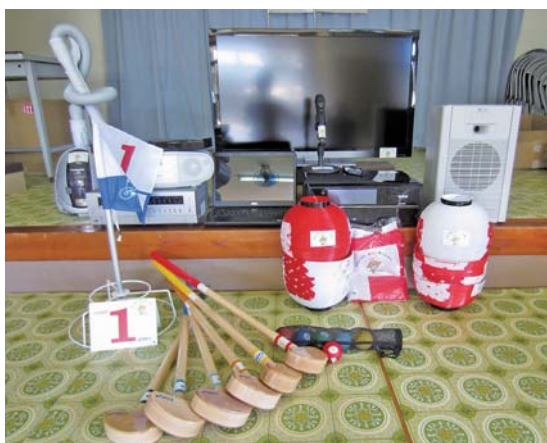
3集落で購入した備品

先山（会議用テーブル・カラオケシステム・エアコン・ゲートボールステイク・テレビ台など総額160万円） 滝川（ノートパソコン・テレビ・机・椅子・三味線・六調太鼓・草刈り機・回転黒板など総額180万円） 志南（グラント水銀灯・提灯コード・ワイヤレスアンプ・太鼓・掲示板・液晶テレビなど総額190万円）