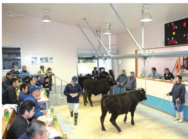
高値で終えた喜界家畜市場内の初セリの様子

全ての市場で前回の平均価格を上回り、喜界家畜市場でも平均価格40万1,797円（前回比約2万8千円増）と高値で取引され、好調な出足で初セリ市を終えた。町畜産担当者は「年末の県内肥育農家の購買が進まなかったことが、今回の購買意欲につながった」と安堵の表情を浮かべた。県内各会場で行われた市場でも平均価格は軒並み上昇、4年8ヶ月ぶりの高値となった。