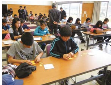
「やる気塾」算数教室の様子

また、後期の「やる気塾」では、中学校の英語教師や中学生のボランティア講師による英会話教室を3回計画しています。これまでに、12月と1月の2回実施しました。12月の英会