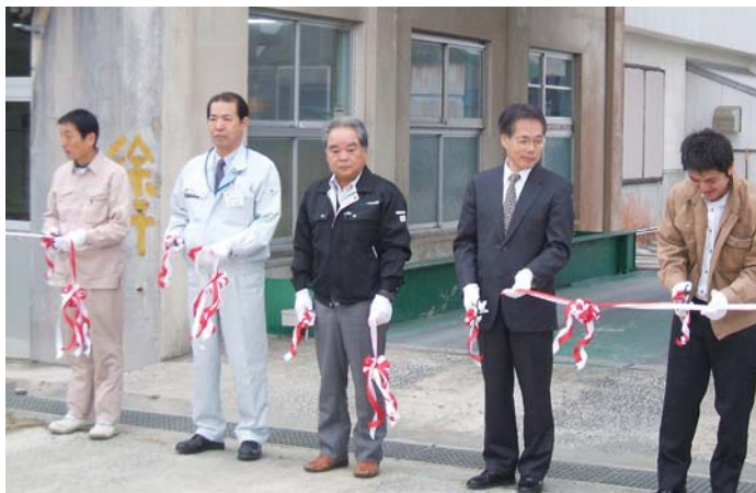
安全を祈願した生和糖業の原料輸送出発式

※ブリックスとは、サトウキビに含まれる固形物の含有量。甘しや糖度は固形物に含まれる糖分含有量を示したものの。即ちブリックス数値が低いとキビは軽くなり甘しや糖度も上がらない。