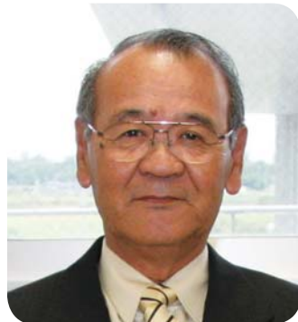
町議会 議長 長 島 智

町民の皆様、新年あけましておめでとうございます。新しい年を迎え、喜界町議会を代表し、新年のご挨拶を申し上げます。