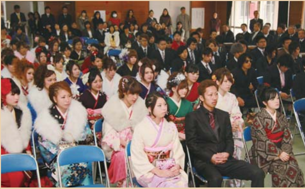
成人式に臨む89人の新成人(男子48人・女子41人)

ほくが生まれてから、12年になるうとしています。12年と言うと、長いようですがあつという間でした。次の年男を迎えるときには、化学の仕事に就いているように、これからも努力して勉強をしたいです。巳年生まれバンザイ!!