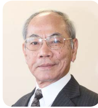
喜界町長 川島 健勇

新年、明けましておめでとうござい ます。新しい年・平成25年（2013 年）を迎え、謹んで町民の皆様のご健 勝をお喜び申し上げます。