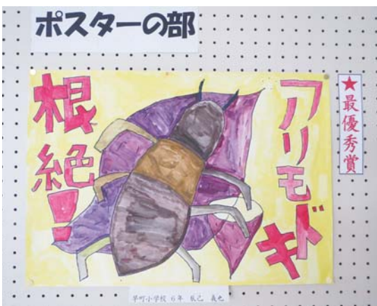
最優秀賞を受賞した辰己くんの作品