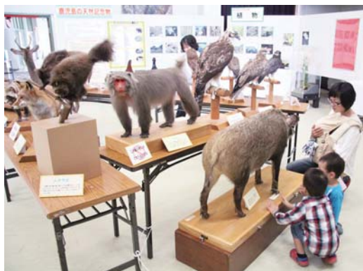
様々な展示物が置かれた旧中央公民館ホール

鹿児島県立博物館（水流芳則館長）主催の「博物館がやってきたin喜界島」が11月7〜12日、中央公民館旧館ホール等にて開催された。同事業は町民が故郷の自然を親しむことを目的とする。期間中は、秋の星座や月を観測する「星空観測会」や喜界島に生息する鳥類の講演会など、様々な催し物を行った。