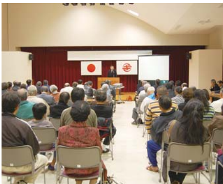
多くの町民にご来場いただいた文化財についての講演会

講演会の来場者数はこちらの予想を上回る100名近くへのぼり、町民の歴史や文化財に対する関心の高さがうかがえる講演会となりました。