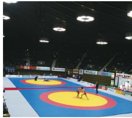
天皇杯の会場の様子

「2012年度天皇杯全日本選手権大会」が12月21日からの3日間、東京・代々木競技場第2体育館で開催された。天皇杯は、オリンピックの日本代表選考会も兼ねる日本最高峰の大会。レスリングを志す者はこの大会を目標に日々の練習に励んでいる。ゆえに出場権を得ることは至難を極める。