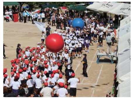
保護者も一緒になって大玉送り