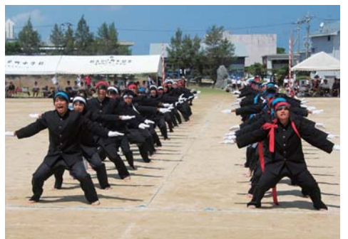
見事な応援団演舞

台風16号の影響で平日開催となったが、生徒達の気合いは十分、白熱した戦いを繰り広