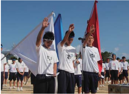
元気な声で選手宣誓する三人