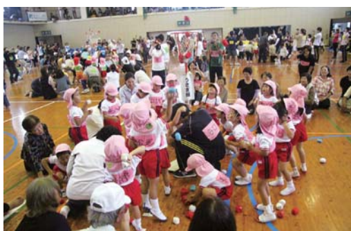
たくさん入るかな

命頑張りました。」と一日頑張って競技した園児達を誉めた。 各幼稚園、各小・中学校の記念すべき「第1回」運動会は、台風等の影響により日程等の変更を強いられたが、無事全日程を終了した。