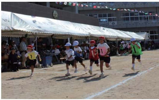
各学年の精鋭が競う紅白リレー

ラムもあつたが、児童達の意気込みは変わる様子はなく、元気がいっぱい取り組む姿が見られた。そして、定番の「喜界小エイサー」や「全校つなひき」、「短距離走」などで児童達の力一杯の声援が校内に響き渡った。 白組団長撰くんは「応援団のセリフを覚えることが大変