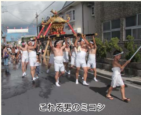
これぞ男のミコシ