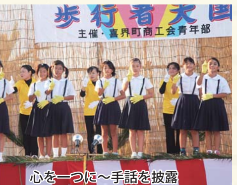
心を一つに～手話を披露