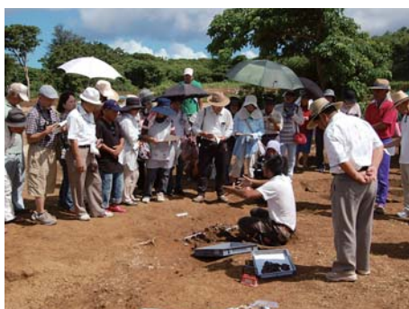
現地説明会には多くの町民が参加

教育委員会は今後、木炭粒などの発見資料についても年代測定のための科学分析をする予定。