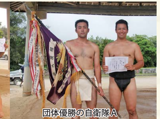
団体優勝の自衛隊A