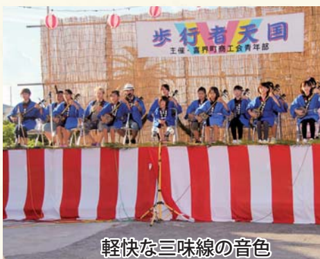
軽快な三味線の音色