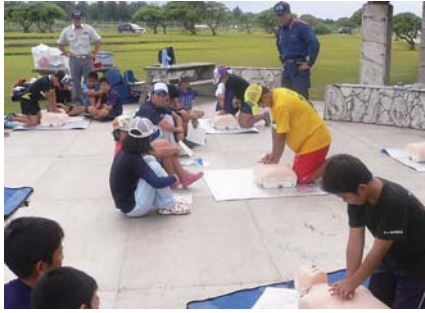
消防職員による救命処置やAEDの使い方などの指導

当日は25名の島内の児童生徒が参加し、寝食を共にしながらリーダーとしての資質を高めました。