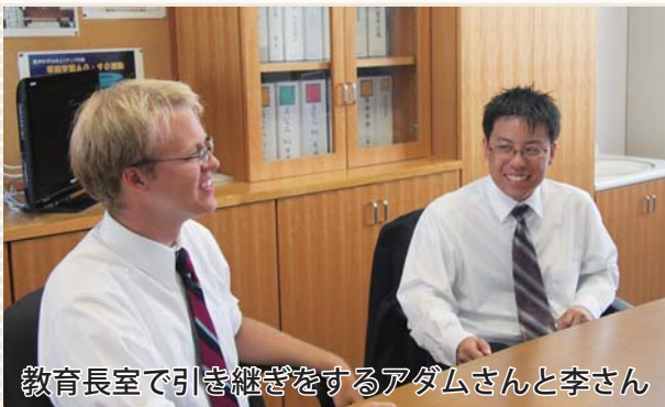
教育長室で引き継ぎをするアダムさんと李さん