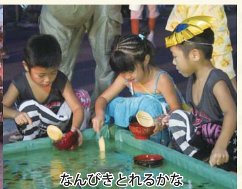
なんびきとれるかな