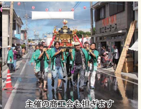
主催の商工会も担ぎます