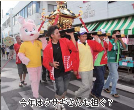
今年はウサギさんも担ぐ？