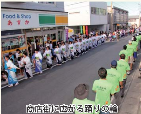
商店街に広がる踊りの輪