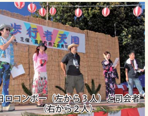
ヨロコンボー (左から3人) と司会者 (右から2人)