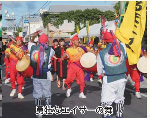
勇壮なエイサーの舞