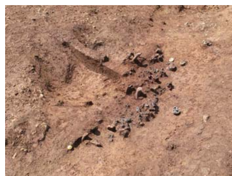
多数の製錬滓を発見した土坑36号

長指導の下、調査を継続した。そして6月、周辺の土坑も含めて掘り下げていく段階で大量の鉄滓が出土した。7月8～10日に村上センター長に再度、現地指導を受け、現地の状況や取り上げ済みの鉄滓などを見せられ、製鉄関連資料の存在を確認した。これにより、鉄を作る技術が12世紀に存在し、砂鉄などの原料から鉄を作り出す作業をこの「崩り遺跡」で行っていたことが推定された。