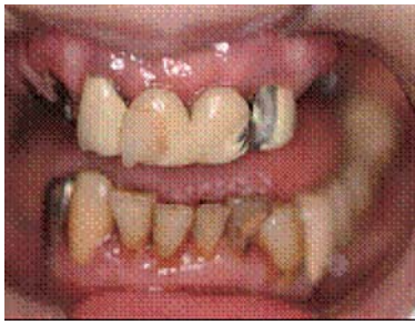
歯みがき後！！きれい！！