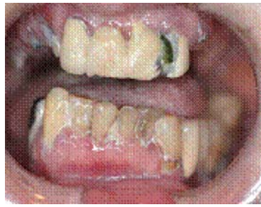
歯みがき前、汚れがめだちます

口の中の細菌は、虫歯や歯周病 のほか、肺炎の一因にもなります。 そのほか、全身の血管障害を引き 起こし、心臓病や脳梗塞の原因に なっているといわれています。