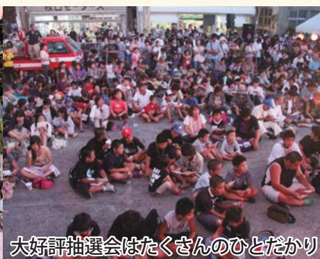
大好評抽選会はたくさんのひとだかり