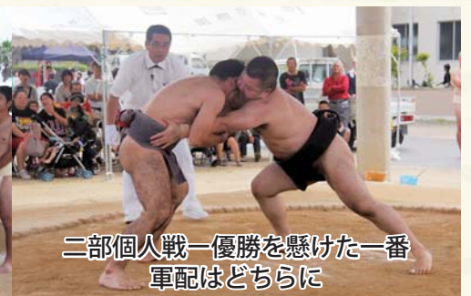
二部個人戦一優勝を懸けた一番 軍配はどちらに