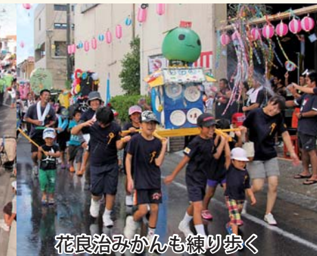
花良治みかんも練り歩く