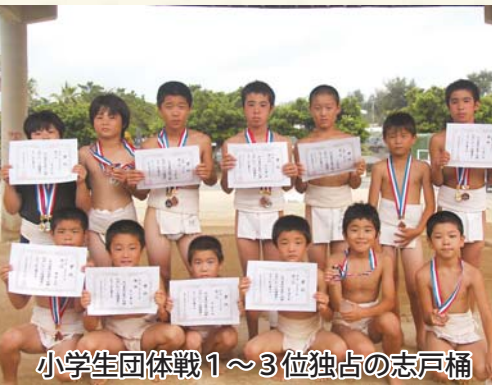
小学生団体戦1～3位独占の志戸桶