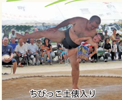
ちびっこ土俵入り