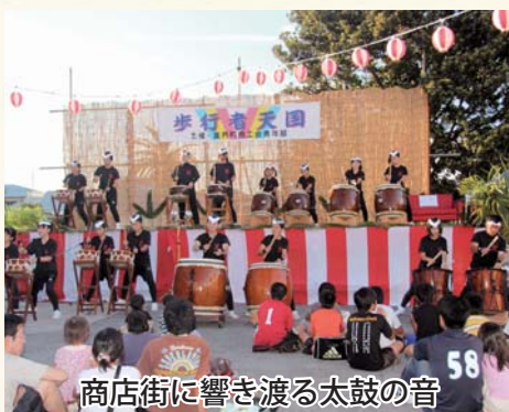
商店街に響き渡る太鼓の音