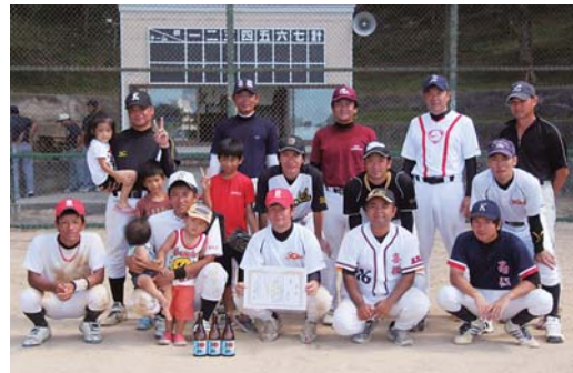
優勝した湾集落メンバー

ている9人とベンチにいる選手が一体となって戦い、チームの「和」を感じた」と話した。