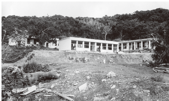
旧校舎（昭和39年に2教室を増築）