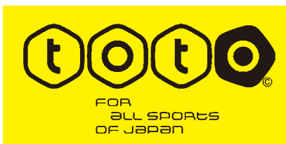
スポーツ振興くじ助成事業

最後に参加者にお楽しみ抽選会を行いました。参加者は、「ポップダンスは色々な音楽に合わせて踊るのがおもしろい」や「ニュースポーツで子ども達と交流ができた」、「ストレッチは分かりやすくてよかった。家の人にマッサージしてあげたい」などみんな楽しんで参加しているようでした。