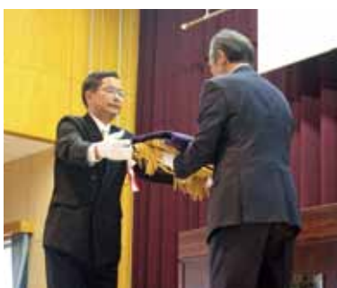
校旗の返納 (第一中、2月13日)