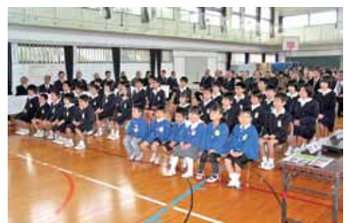
閉校式の様子 (荒木小・幼、2月8日)