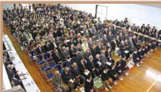
会場いっぱいの参加者（坂嶺小、2月26日）