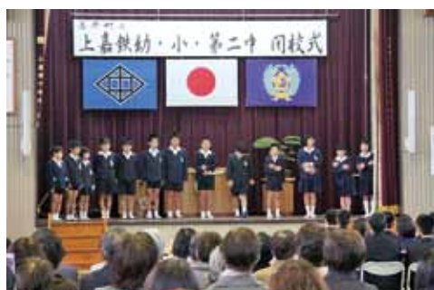
式の前の方言発表 (上小、2月26日)