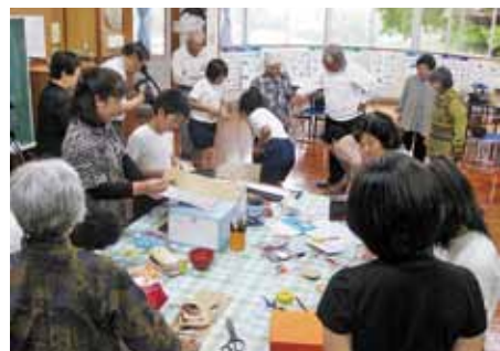
高齢者ふれ合い参観で昔のオモチャづくり

三 花かげ木かげ校庭に 学びの友は相むつび 双葉の命健やかに はばたく希望歌おうよ ああ輝く滝川小学校