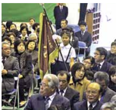
校旗入場で閉校式ははじまった

式の終了後は、ひきつづき閉校を惜しむ会があり、参加者らは時間を忘れて思い出話に花を咲かせていた。