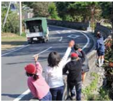
ばいばい! またあそぼうね!!

おわかれ会で、ティーダとコ ティーダに、さとうきびで作った かみにかいた「いままでありがと う」のてがみをプレゼントして、 『やぎさんゆつびん』のかしをか えて、みんなでおわかれの歌をう たったよ。あとね、ティーダとコ