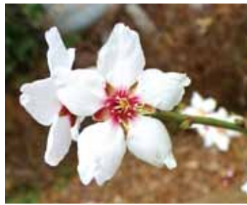
アーモンドの花(資料写真)