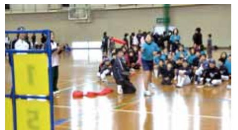
フリスビーでの的を当てる「RDチャレンジ」