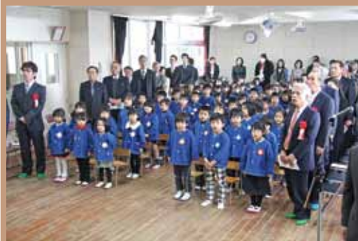
大きな声で園歌斉唱（湾幼、2月2日）