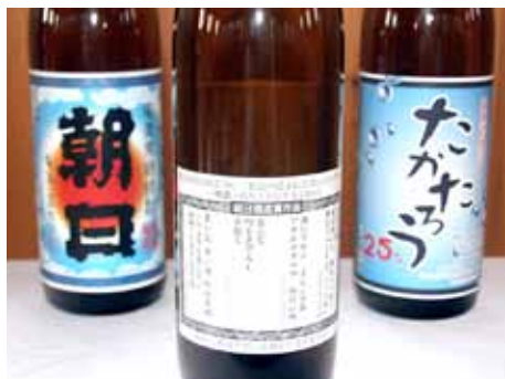
受賞作品はラベルに使用される