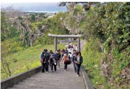
鹿児島神社の参道を登る参加者ら

参加者らは「焼酎ができる過程に触れたので、今晚から味わって飲みたい」、「各課ごとに町民からよく聞かれることを、課を越えて全員で共有できる学習会をしてみては」、「役場職員として島の動植物や文化財をもっと深く知りたい」などと話し合っていた。