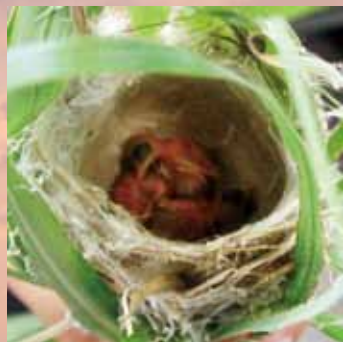
集落によってはフガー？

タマゴという新しい単語が入って来たために、タマゴに押されて、もともと卵のことをさしていたフガーは生き延びるために、片や「ひよこ」に、片や「擬卵」に意味のズレを起こしたと考えられます。このように単語の意味は変わり、方言差ができるのです。