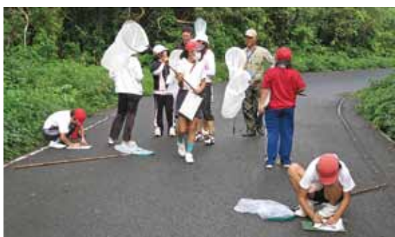
アサギマダラ・マーキング活動の様子