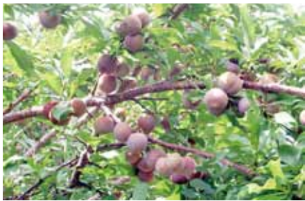
6月にはたわわに実る