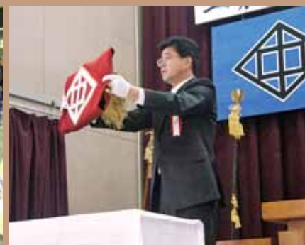
いよいよ校旗とお別れ（二中、2月26日）