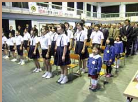
幼・小合同で開催（小野津幼・小、2月16日）