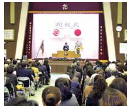
滝川小閉校式の様子

4月からは再編された喜界小学校となりますが、最後の校長として、子どもたちがたくましく、生き生きと成長することを願うばかりです。長きにわたり本校を支