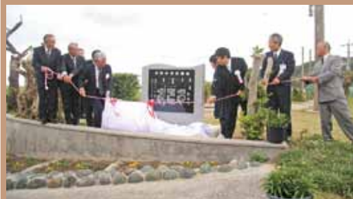
記念碑の除幕（早中、2月27日）