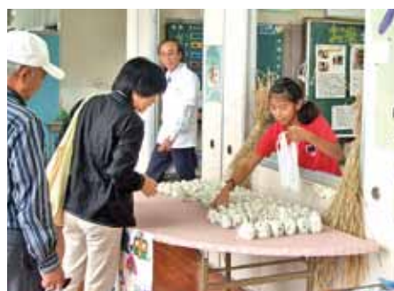
志小ブランドおにぎりを販売

現在、「システム上だけの学校」、「勉強のための勉強をする学校」ではなく、「物語のある学校」づくりをテーマに学校運営をしている。教師と児童が「何をしたいか。楽しみたいか」を話し合い、それらの目標達成のために必要なことを児童みずからイメージし、授業や家庭での学習に活かしている。