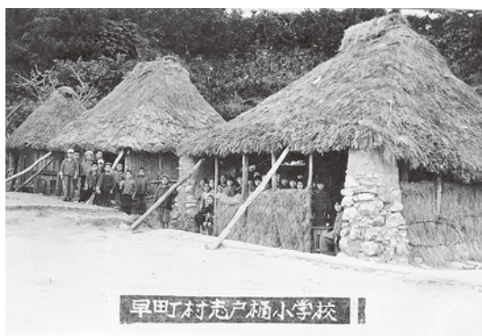
早町村志戸桶小学校