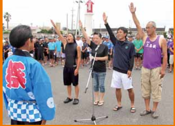
▲今年も爆笑を誘った選手宣誓