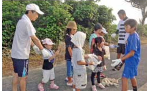
毎年7月の最終日曜日を中心に行われるふるさと美化活動