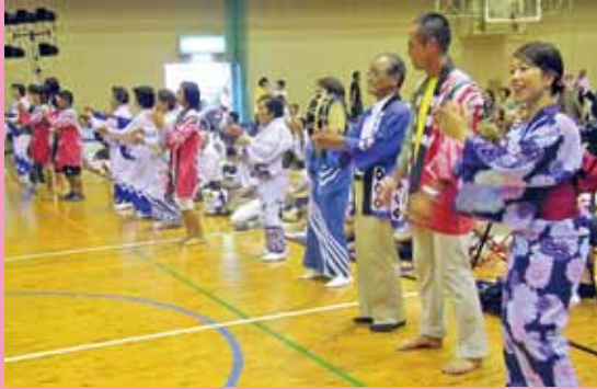
▲早町・白水の八月踊り