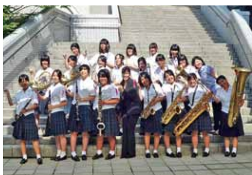
南九州コンテスト演奏直後に記念撮影