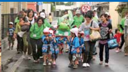
▲沿道から水をかけられ喜ぶ園児ら