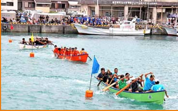
▲ブイをまわって「あとは直線勝負！」