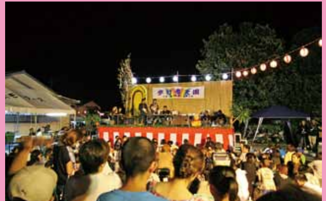
▲メインステージの様子、他にもホコテンの露天やイベント、サブステージなどでも盛り上がった