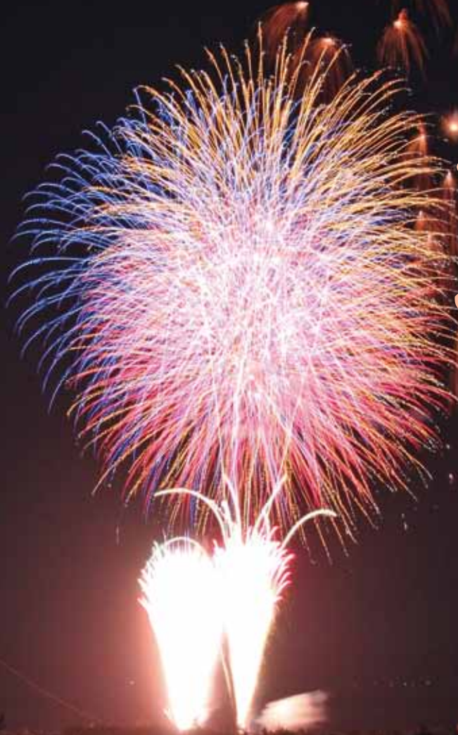
花火大会 (8月17日)

第30回喜界町夏まつりは、台風9号の影響を受け、一部の予定日時・会場を変更して開催された。