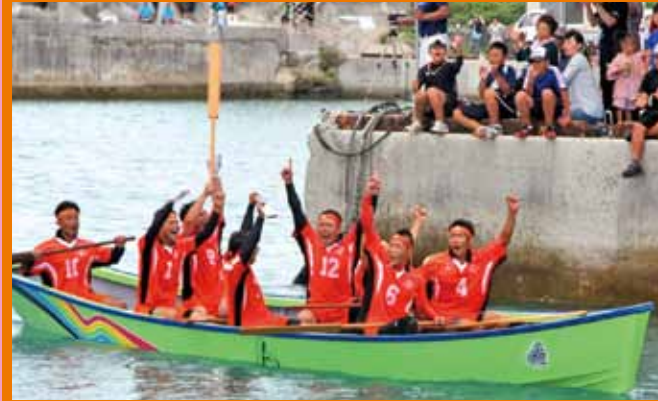
▲メインイベント「手舵の部」は峰山建設 A がリベンジを果たした