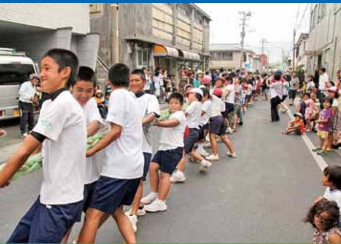
▲2-1で湾方の勝利！(写真は赤連方)