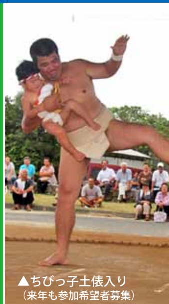
▲ちびっ子土俵入り (来年も参加希望者募集)