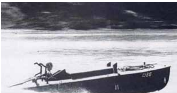
米軍に接收された震洋艇(写真はアメリカ合衆国の著作物、パブリックドメイン)

役場企画課では「地元でも震洋艇の基地があったことを知る人は少ない。島に多く残る他の戦跡とともに、前の戦争を後世に語り継ぐ一環として、周辺整備と説明板の設置をした」と説明する。