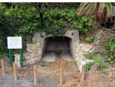
震洋艇格納壕跡（説明板あり）

第二号議案で承認された事業計画では、次の12項目の取組事項が確認された、①栽培基準の遵守及び適期肥培管理の励行、②土づくりに対策、③春植・株出面積拡大による増産推進、④病虫害防除対策、⑤機械化一貫体系確立による省力化の推進、⑥株出管理作業の普及、⑦優良品種種苗の普及ならびに地域に適した優良品種への更新、⑧側枝苗を活用した種苗供給体制の確立、⑨作業受委託体制の整備および推進、⑩さとうきび共済の推