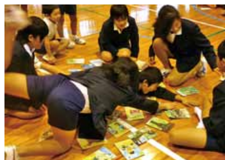
手製の郷土カルタでカルタ取り大会

一 明けゆく朝の陽に映えて 黒潮近く寄るところ われら仲よくほがらかに 学ぶ 志戸桶小学校 希望の鐘が鳴っている 二 そのかみ遠くふるさとの 岩に根ざした天の梅 絶えずたゆまずいっしんに 励む 志戸桶小学校 豊かな花が咲いている 三 ゆかしい歴史誇らかに 七城おろし吹く庭で 心とからだきたえつつ 進む 志戸桶小学校 日本の明日が待っている