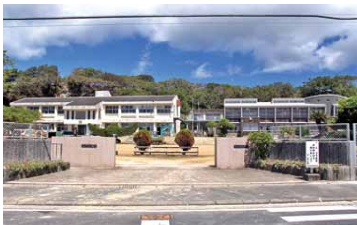
のぞみ幼稚園開園(来年4月)に向けて改修工事がすすむ