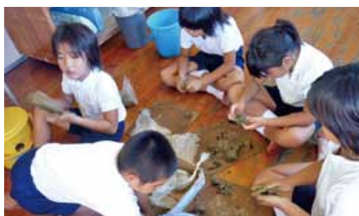
敷地内でとれるクチャミチャ(島尻層の粘土)で“志戸桶焼”づくり