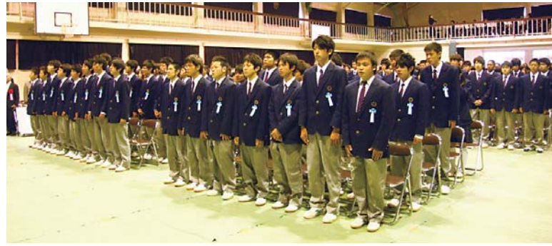
喜界高校卒業生は総勢7,812人となる（物故者を含む）

喜界高校卒業生65人が「二度と戻らぬ美しい日々」に、ありがとうございます。そして、さようなら。