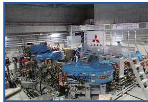
●加速器(シンクロトロン)