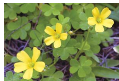
こちらはカタバミ