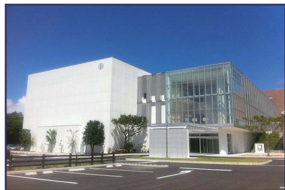
財団法人メディポリス医学研究財団 がん粒子線治療研究センター