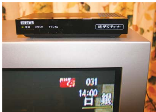
チューナー設置で従来のテレビでも 地デジ視聴が可能