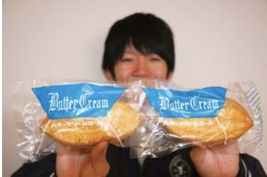
伐採のお供に 『バターサイパン』！ おうちでたべても おいしーよー！

農家からの人気を裏付けるよ うに、製糖期が終わるとピタリ と売れ行きが止まり、同時に製 造も休止するという。