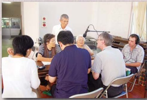
志戸桶での方言調査の様子

言葉は常に変化していくのが自然の流れであり、誰もそれを防ぐことができません。訛りや言葉の乱れを批難する人は自分の言葉がどれだけの変化を経ているのかを考えたことがないでしょう。どの言語や方言も変化しますが、変化する部分や変化の方向は異なります。時間を経てもあまり変わらない部分もあります。喜界島方言調査団リレーエッセーが、それも方言によって異なります。日本語の歴史を遡るには、各方言に残された古いものを集める必要があります。それらを合わせた時に初めて元々の姿が見えてきます。どんな方言も重要で、その方言のかけらがなければ日本語史のパズルが完成しません。喜界島の方言も例外ではなく、筆者が専門とする歴史言語学にとっても重要であり、残さなければならぬということを、昨年九月の調査で改めて確信しました。