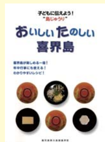
おいしい たのしい 喜界島（定価 300円）

※島外から購入希望の方は、保健福祉課 ☎65-1111 までお問い合わせください。