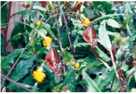
ハンダマは栄養満点だよ!!

大人になったら結婚して、今度は僕らの子どもたちが、また島に帰ってくるから、その時はよろしくお願ひしますね。