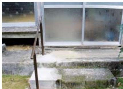
外部の入り口の手すり