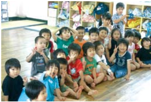
シマの未来を担うチビッコたち

児童相談関係については、県・町・保育所など関係機関と連携を図り、虐待情報の収集や意見を交換を行い、子育てに悩む親を孤立させないような方策を進