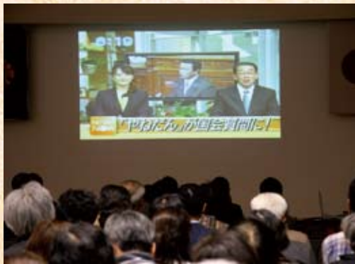
活動の様子もビデオ上映された

「会費を徴収しない」の提案には全員が賛成の拍手をしたものの、「行政の補助金に頼らない」と提案したときは、集落の長老たちから激怒された。