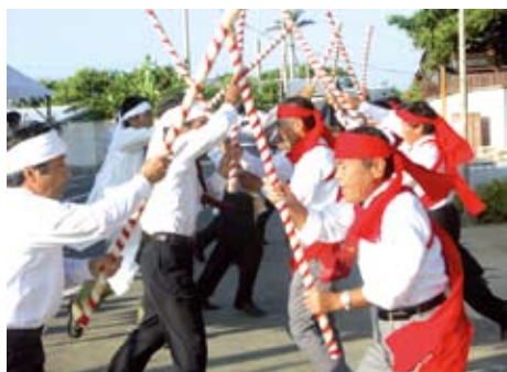
将来に残すべき財産「島中棒踊り」