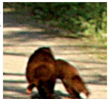
必死に逃げるイタチ