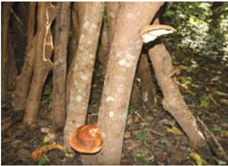
実証試験中のシイタケ

役場産業振興課では、島に多く自生するホルトノキを利用して、シイタケの試験栽培に乗り出した。