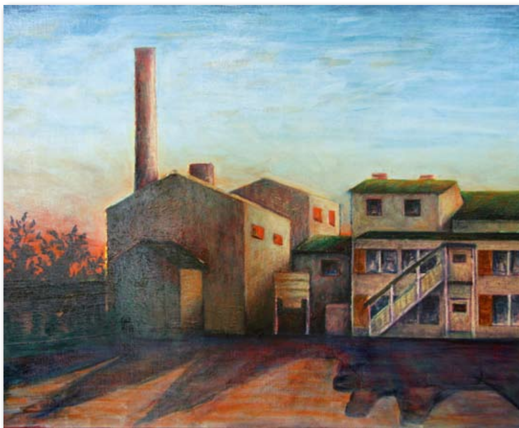
「製糖工場の夕暮れ」（南海日日新聞社主催：奄美を描く美術展 奨励賞）