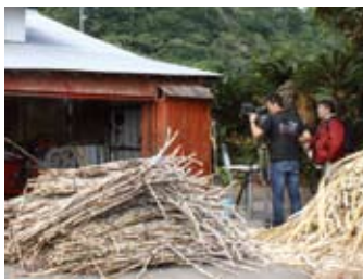
佐野製糖での収録風景

NHK 総合の、一枚の古い写真に残された記憶をたどりながら、今もそこで生活する人たちの暮らしを紹介する番組「こんなステキなにつぼんが」の収録が2月28日から3月3日にかけて本町各所であった。