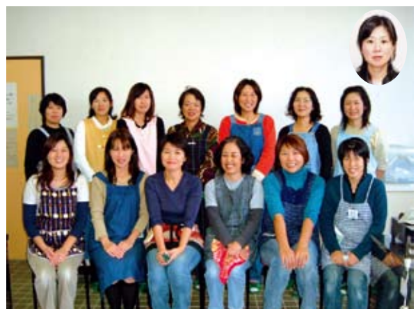
島じゅうり伝承委員の皆さん

この冊子を制作したのは公募により選ばれた13人からなる、ほとんどが主婦という「島じゅうり伝承委員」。2年前から作業を始め、取材やアンケート調査などの慣れない作業に取り組んだ。島じゅうり伝承委員らは「子育て中の若いお母さんは家庭で島料理を作っていたら、島出身者には島を懐かしむ一冊として、次世代への伝承の一助として活用して欲しい」と訴える。