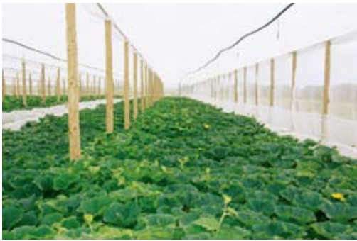
低コストで高収益が期待される「平張り」

を記録し、名実ともに日本一のゴマの産地として品質の向上を図りながら生産拡大を図ってまいります。