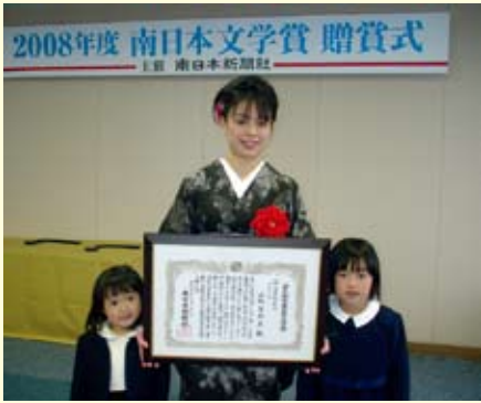
母が織った絁をまとい、娘達と記念撮影

※受賞作「プライド」は、喜界島を舞台とした島娘と特攻兵の果たされぬ恋愛と、その彼女の孫にあたる女性の道ならぬ恋愛を対比させながら、自由を手に入れた反面、生きづらさを感じている現代女性の葛藤と決意を描いた作品。 3月25日付南日本新聞に2面に渡り掲載されている。