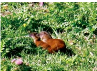
まわりを警戒するように、辺りを見まわす

場所は伊実久の県道で、犬や猫が子を移動させるように、大きなイタチが半分ほどの大きさのイタチの首をくわえて移動し