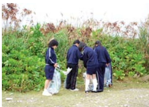
美しい観光資源を損なうポイ捨てゴミ

本町のごみ排出量については、引き続き徹底した分別集を推進し、減量化に努めてまいります。クリーンセンターから排出されます焼却灰につきましても、これまで同様県外の指定業者に依頼し適正処理に努め、またダイオキシンの汚染防止調査も随時実施し安全対策に努めてま