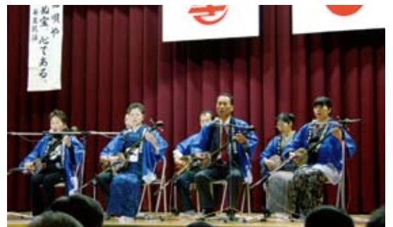
ふるさとへの想いをバチに込める

目を披露した。最後は出場者全員による六調のにぎやかな調べが会場を覆い、約4時間にわたったシマ唄と踊りの競演は、最高の盛り上がりを見せた。 奄美古来の伝統芸能をこよなく愛し、またその伝承者ともいふべき約120人の保存会。出演者のひとりには「メンバーの島唄への真剣な取り組みを通じて、皆の故郷に対する強い想いを肌で感じました」と話し、大阪からの参加者が幼馴染みという観客は「島にいる私は唄や三味線が全くできないのに、大阪で練習していてカンシンジャ」と話した。 翌8日、公演を終えた一行は、疲れも見せず「はまゆり学園」や「グループホームがじゅまる」などを訪問し、入所者と交流するなどして喜界島を後にした。