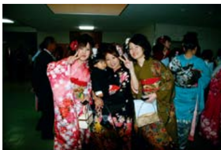
お母さんも成人式