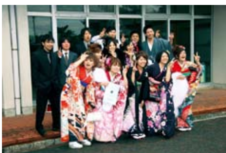
舞美のお父さん！綺麗に撮ってよ！！