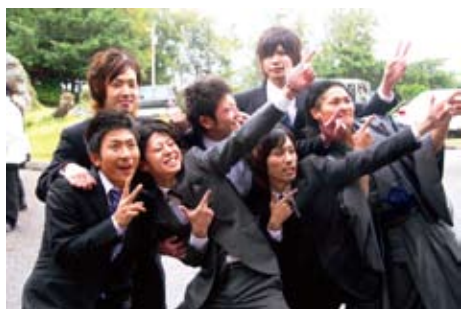
あかるい未来は？「あっち！」