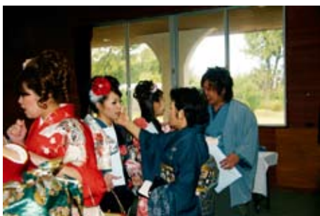
成人の喜びを恩師とともに