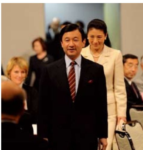
皇太子・雅子妃両殿下がご臨席された