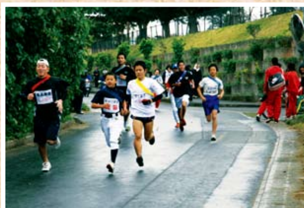
11チーム235人が健脚を競った元旦マラソン