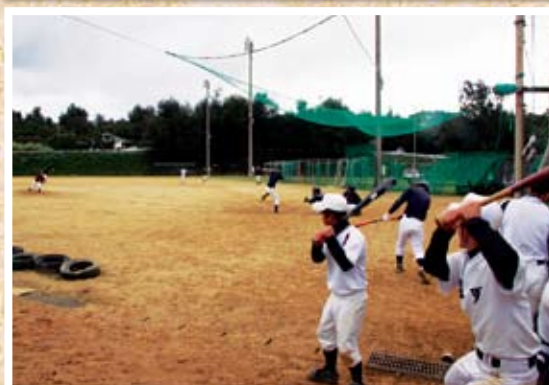
喜高野球部OBと現役の新春試合