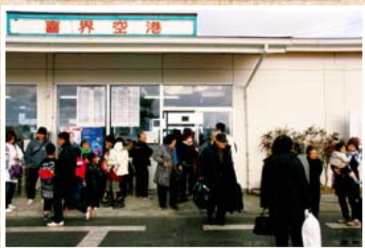
帰省客でにぎわう元旦の空港

今春、新しい生活が始まる喜界高校3年生が願をかける。闘牛のように突っ走れ！（百之台にて）