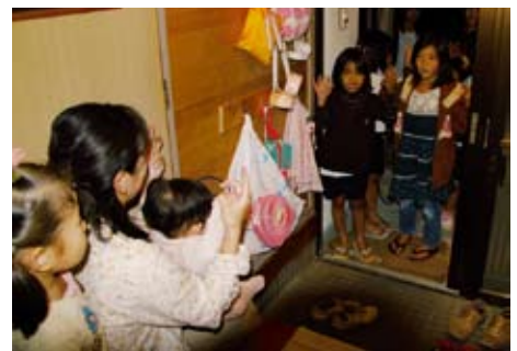
ちゃんと踊ったらチンメーあげるね

中里集落にあつて「ジヌナー トウツチュ」以外の住民がほとんどのコーラル団地でも餅もらいが行われた。男女ごとに団地内の集会所に集まり、各家々を回つたが、同伴する保護者たち