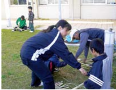
基幹作物であるサトウキビの葉でしめ縄を作りました。

町子ども会育成連絡協議会恒例のしめ縄作りが12月20日、役場におきまして開催いたしました。