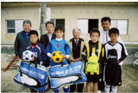
ライオンズクラブの面々と記念撮影