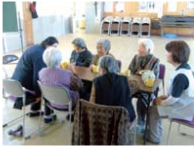
集落すこやか教室

幼稚園年長組、中学1年生、高校3年生のMR接種（はしか・風しん）は、3月までです。接種率が低いようです。期限内に接種しましょう。