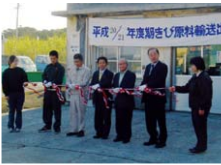
関係機関代表によるテープカット