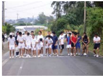
各島々で同時刻に出発(スタートラインに立つ5km・10kmにエントリーした参加者)

12月21日(日)に県下一周市郡対抗駅伝競走大会などの選手選考を兼ねた標記競技大会を開催いたしました。