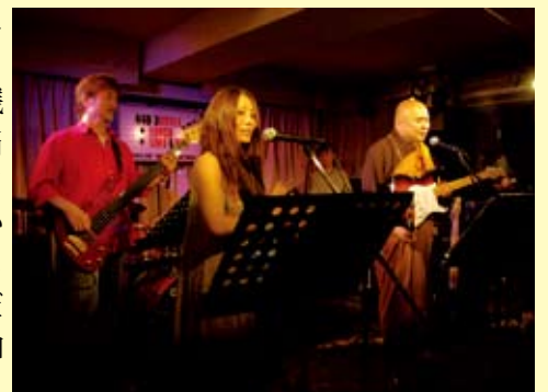
東京でのライブ風景

これからの目標として「泣いたり笑ったりの人生の大切なことを伝えられるように、唄で幸せを与えられるように、シマのことを忘れずに唄っていきたいです」と話し、「皆さんに直接伝えることができなくて残念ですが、本当に喜界島の皆さんに感謝しています。これからも応援してください」と付け加えた。