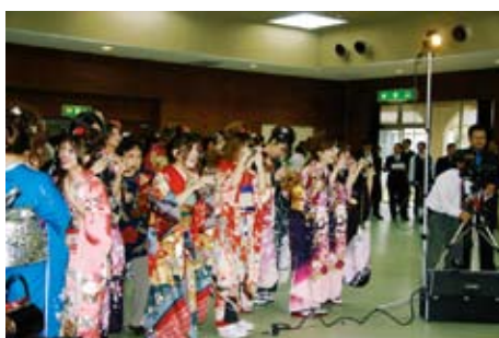
プロを差し置いて記念撮影