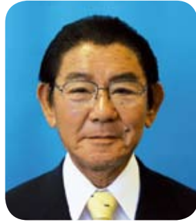
喜界町長 加藤啓雄