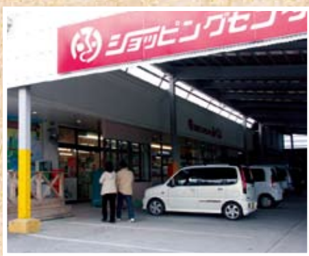
今では商店も元旦営業