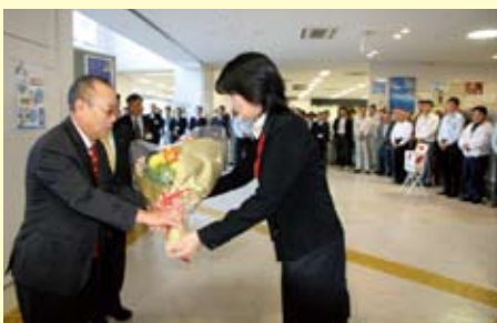
職員に見送られ「最後の退庁」

私の通算公務員生活41年5ヶ 月は、同僚職員はもとより、町 民をはじめ、各関係機関や全国 喜界会の皆様方のお陰であるも のと、心より感謝致しております。 す。ありがとうございます。 今後とも今まで同様のご指 導、ご鞭撻を賜ります様、よろ しくお願い申し上げます。更なる 喜界町の発展を心よりお祈り 致します。