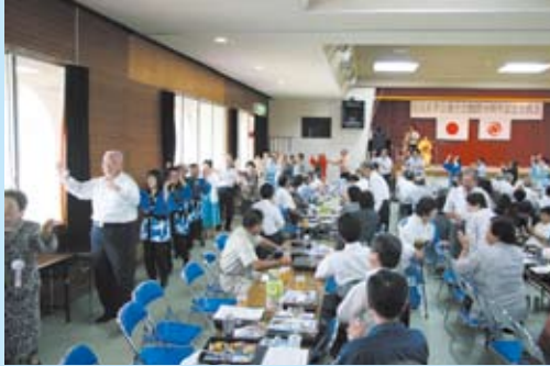
最後は「タビニウンチュム シマニウンチュム ヒンニヤジ八月踊り」～郷友会交流会にて～

第27回喜界町夏まつり（喜界町夏まつり協賛会主催・加藤啓雄会長）が8月2・3日の二日間、湾漁港やスギラビーチなどで開催された。初日は、町相撲場で小中学生や社会人らによる相撲大会、湾赤連商店街でみこしパレード・綱引き大会、夕方には湾赤連商店街で歩行者天国が開催された。二日目は、湾漁港で祭りの華であるフネインカー競漕、夕方からはスギラビーチにて町地婦連による踊りや赤連集落の八月踊り、地元演芸者らによる歌謡ショーがあり、大花火大会でフィナーレを迎えた。また、第5回全国喜界会連合会総会および創設10周年記念交流会も自然休養村管理センターで開催された。