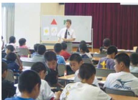
算数・数学の楽しい話

が参加者でぎっしりです。 また、毎回、ボランティア講 師による楽しい授業があり、参 加者には非常に好評です。 授業は、参加者の関心・意欲 を高める内容で、算数や図工、 社会など教科も様々です。前期 は九月七日、十月十九日、十月 二十六日の残り三回ありますの で、時間がありませんでしたら、子ど もたちの頑張っている様子を参 観に来てください。