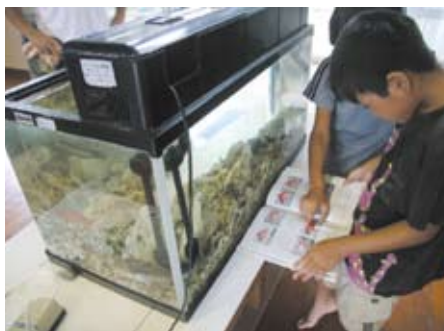
「あっ!このさかなだよ」