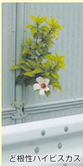
ど根性ハイビスカス

花言葉は、「常に新しい美」「勇ましさ」「勇敢」「新しい恋」「繊細な美」「上品な美しさ」「華やか」など、品種の数に比例して多数。