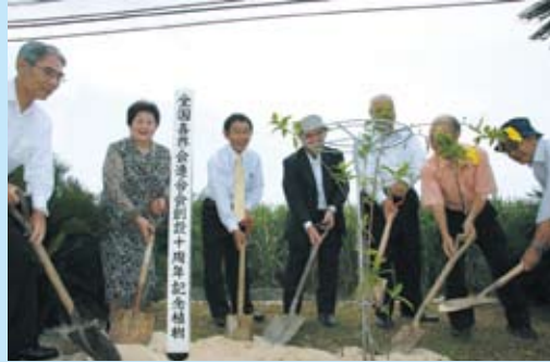
連合会寄贈の「アラマンダ」10本を記念植樹