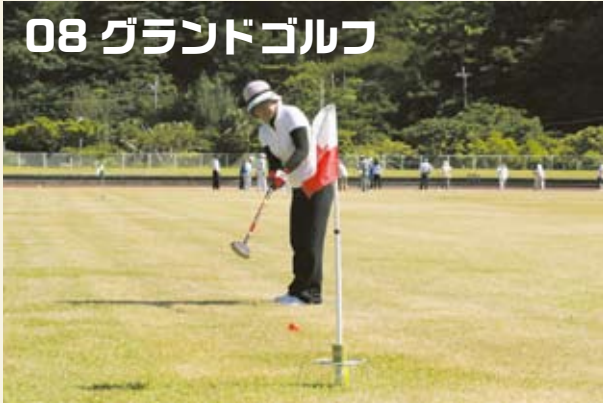
ホールボールに向かって一直線