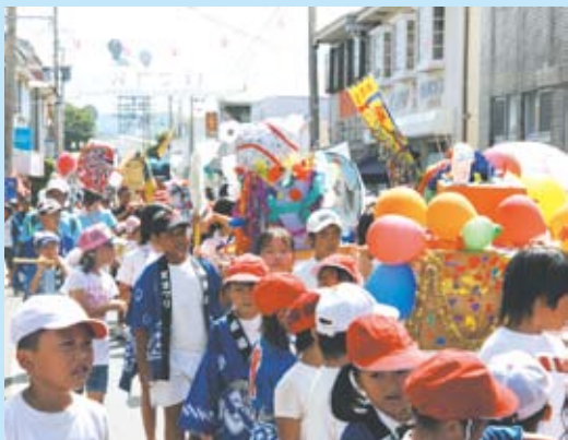
子どもたちの手による趣向を凝らした色々なミコシが商店街を練り歩いた