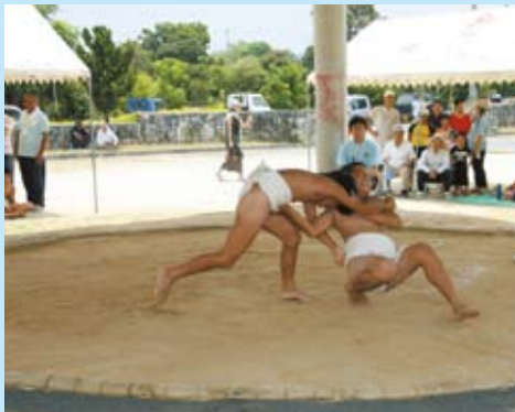
最後まで「あきらめません」