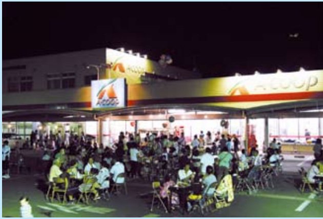
タイアップしたAコープ 駐車場のオープンカフェ？も大盛況