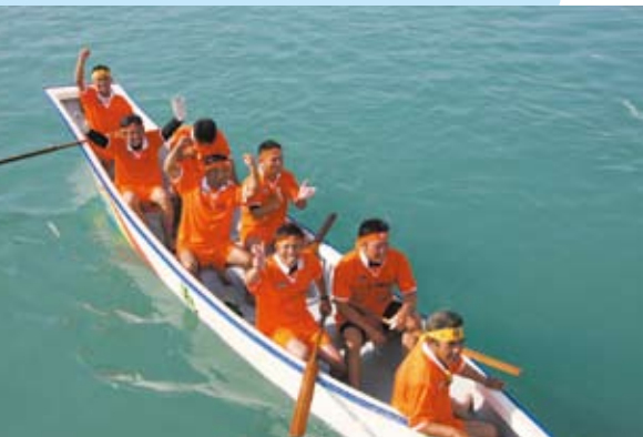
「やったー!」今年も強かった峰山建設