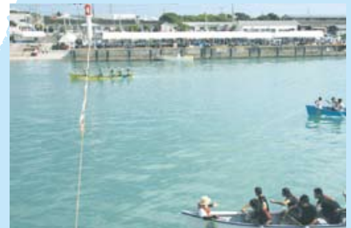
半艇差で生和糖業キビ増産チーム勝利 来期も豊作決定だ!(固定かじの部)