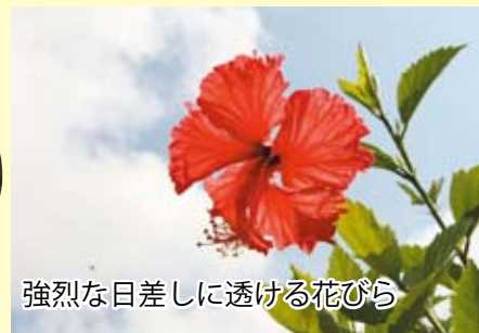
強烈な日差しに透ける花びら