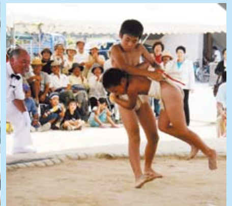
しがみついたら離しません