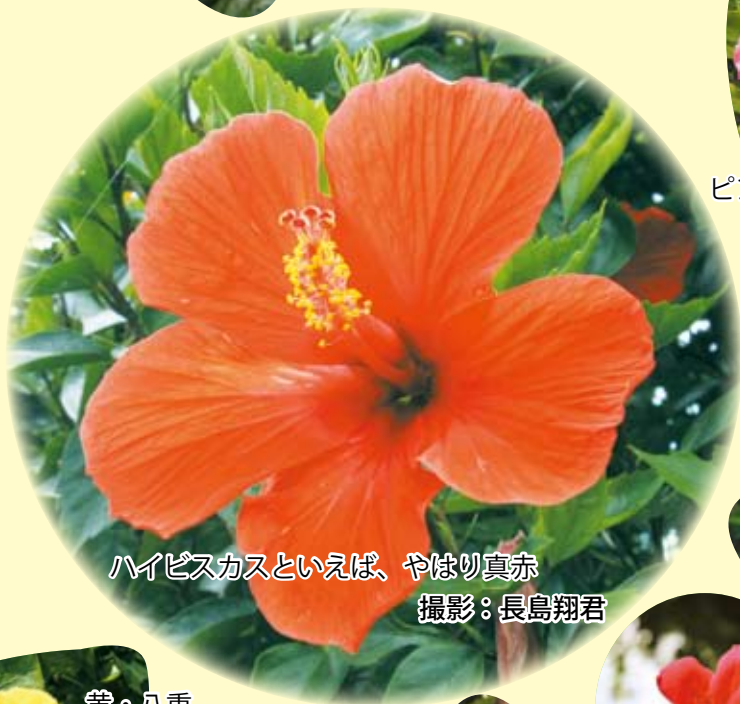
ハイビスカスといえば、やはり真赤