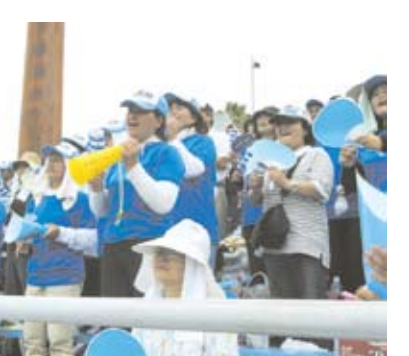
力のこもった応援をする“おかあさん”たち