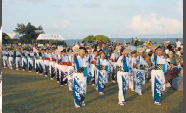
夕日を浴びながら整然と踊る婦人会のみなさん