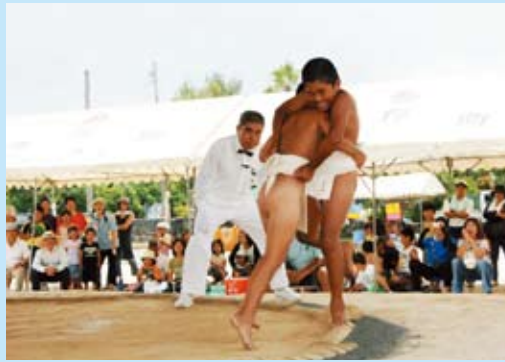
薄"俵"を踏む思いでノコッタノコッタ