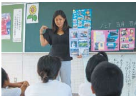
小学校での授業の様子

教具を使って授業をしました。 中学校や高等学校では、重要視 されている「話す」「聞く」を 伸ばすため、英語教師とともに チームティーチングで授業を しました。どの学校でも、分か りやすく、楽しいと評判でした。