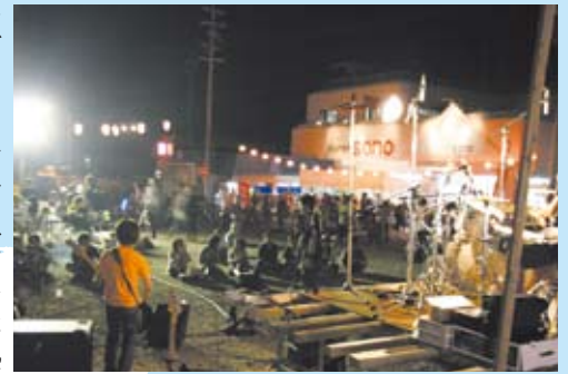
サブステージではバンドが熱いパフォーマンス