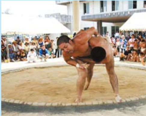
豪快な上手投げが決まる