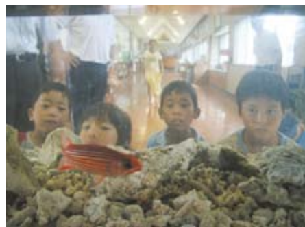
「こんなサカナが学校のすぐそばにいるんだあ」