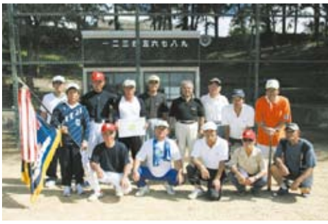
嗚呼 栄冠は池治チームに輝く 合言葉は「小よく大を制す」

野次「吉之、ダア きゃっちゃー みっとネーラ ンスナ」 里居「（ナートウユ ミタ丸出し で）アアイ、 ハニガアリ バジャガヨ オー」 野次「みっともない・・・」