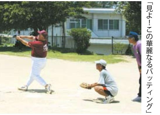
「見よ！この華麗なるバッティング」

鉄壁の守備陣を誇る上中Bチーム。上嘉鉄地区は中西東で5チームの大選手団を派遣した