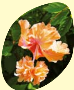
花柱の先に八重咲き