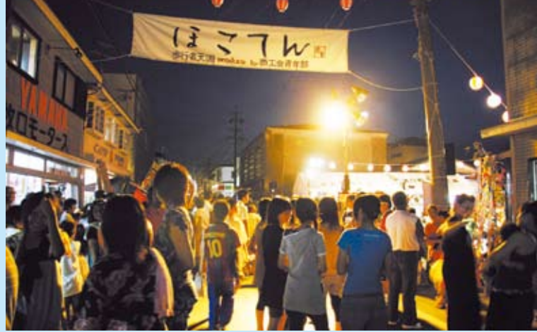
たくさんの人出で盛りあがった「ほこてん」