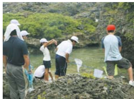
「校長先生大きいウミヘビがいるよ!」 「大丈夫、あれはナマコだよ」