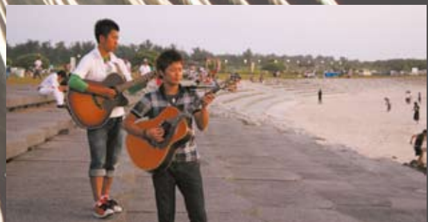
バックステージでリハーサルに余念がない dokidoki

各方面からの協力で運営される夏まつり。漁協の皆さんにはフネインカー競漕会場周辺の清掃をしていただいたが、その翌日には目を疑う無惨な光景があった。我々も含めた戒めとして、恥ずかしながら写真を掲載します。