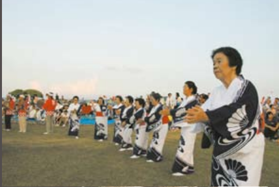
今年の八月踊りは赤連集落