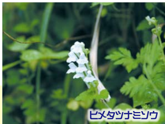
ヒメタツナミソウ