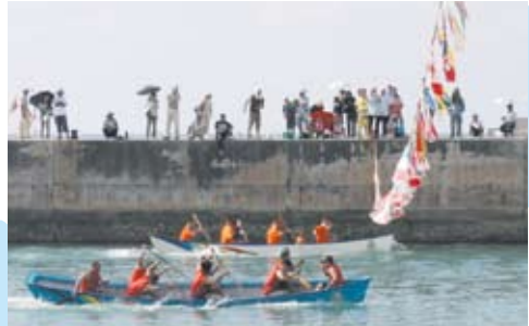
ハナ差の決着となった決勝戦(手かじの部)