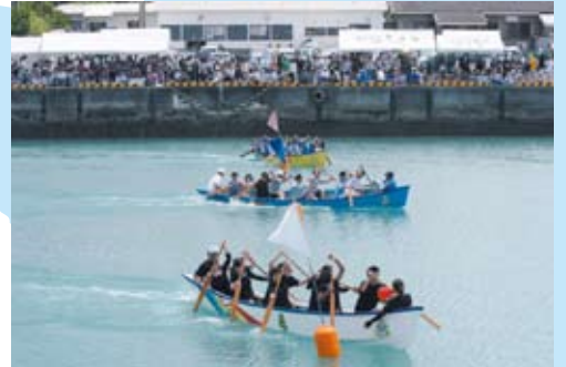
さあ、後半の直線勝負だ!