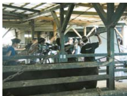
伊実久のグローリー牧場にて

之島でも撮影が行われ、放送予定は11月1日夜9時から毎週土曜日（全5回）となっております。主題歌は奄美出身の中孝介さんによる『路の途中』。