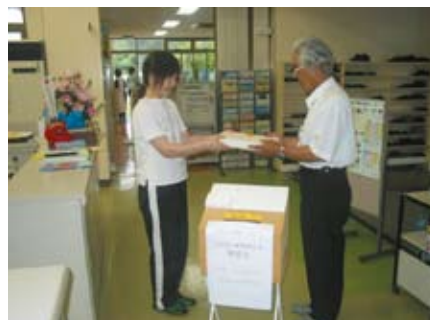
中国四川省の被災者へ届けられる