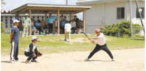
はやく落ちて来い