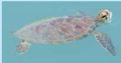
なんだか騒がしくなってきたソ