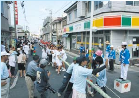
最後尾が見えない大綱引きは赤連側が2-0で勝利