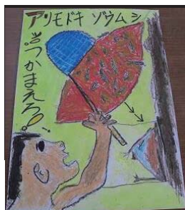
荒木小1年 岩崎 元気さん(2011)