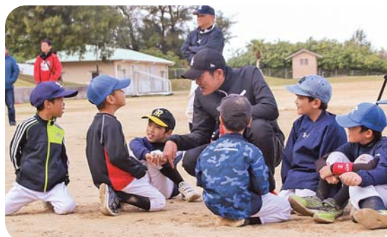
ちびっ子と“あっちむいてホイ”をする一幕も

ださい。」とエールを送った。終了後、子ども達は2人と写真を撮ったり、サインを求めるとしていった。