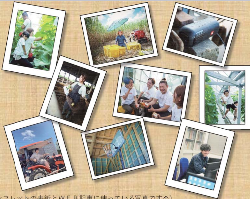
(↑パンフレットの表紙とWEB記事に使っている写真です↑)