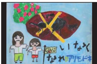
喜界小2年 向井 沙奈さん(2019)

現在、湾、赤連をはいめとする 各地の集落において、ノアサガオ、 放置サツマイモ等の本種の寄主植物 の除去を実施しています。