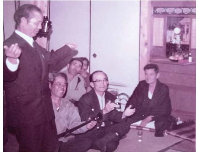
シマ遊びの集合写真 昭和57年 嘉鈍