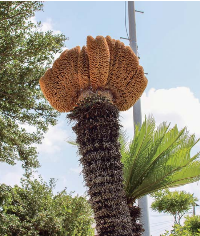
野球のグローブ のようなソテツ（湾）