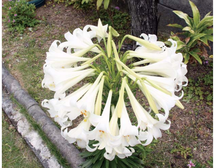
40個以上ついたユリ（上西）