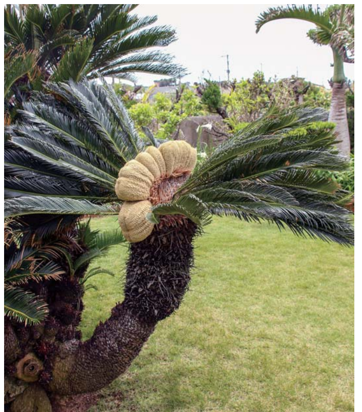
モヒカン刈り？鳥？ のようなソテツ（坂嶺）