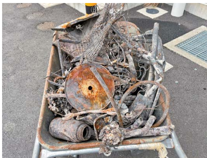
ピットに投げ込まれた鉄くず等