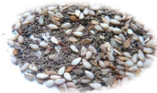
土砂が多い、ホコリっぽいゴマ カビが発生・異臭がするゴマ