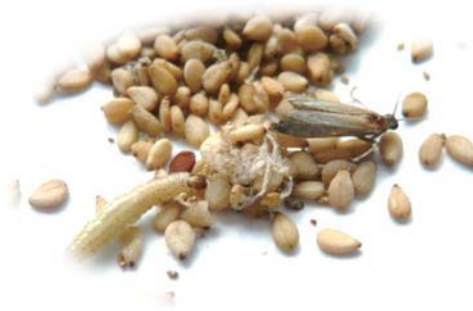
虫が発生(ダニ・ガの幼虫など)