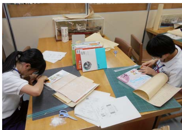
新刊図書のブックコーティング作業