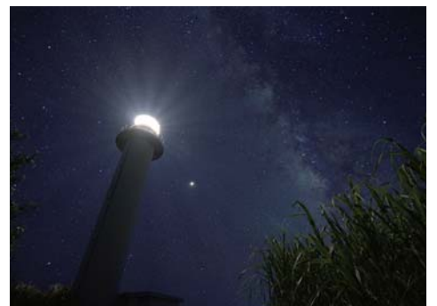
トビヲ(トンビ)崎灯台下