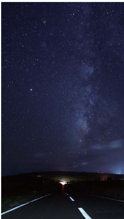
サトウキビの一本道

詳しくなればなるだけ観察の楽しみも増すこと間違いなし。今年の夏は家族の人たちと一緒に星空観察をしてみよう。天の川や星座、流れ星、流星群を観察するのもきつと楽しいよ。この夏、自分たちだけの素敵な観察スポットを見つけよう! ※夜間の観察は必ず保護者の方と一緒に!