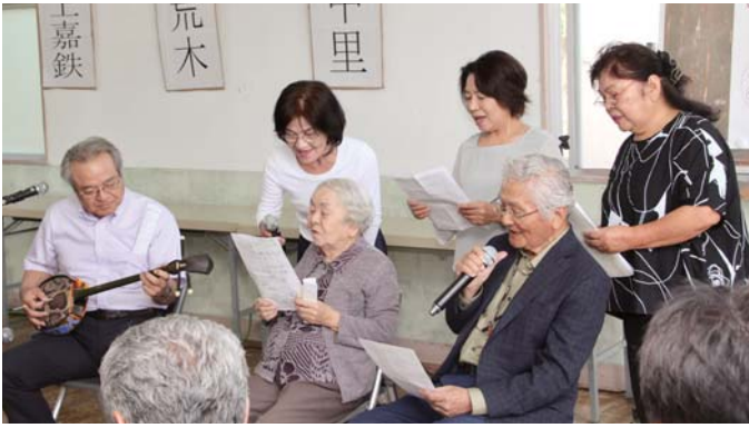
創作いちゆんにやかな：湾集落代表