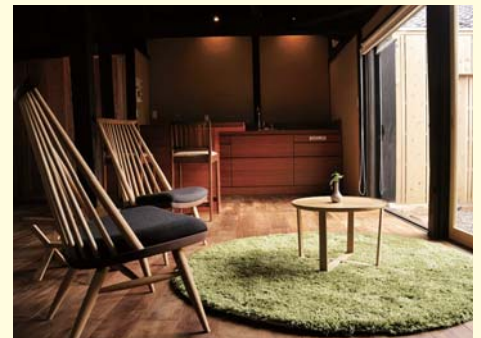
雰囲気あるたたずまいの古民家

現在までに古民家レストラン1棟、古民家ゲストハウス1棟、古民家ステイ4棟を整備しました。この古民家ステイ及び古民家ゲストハウスは小値賀島に点在し、趣も周りの風景も異なっています。それぞれの建物の歴史やたたずまいを感じ、「暮らすように旅することができるよう1組1棟貸し切りの宿泊形態としています。