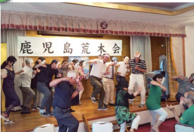
みんなで カーモンベイバー アラキッチュ〜♪〜

第67回鹿児島荒木会総会（益田親雄会長）が6月2日、鹿児島市の宴会場で開催された。