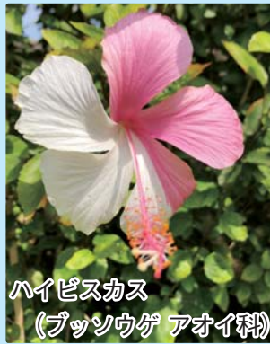
ハイビスカス (ブツウゲ アオイ科)