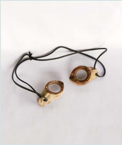
水中眼鏡（ミーカガン） （喜界町歴史民俗資料室所蔵）

日に日に暑くなり、夏の到来を感じるこの頃ですが、みなさんはもう海へは行きましたか？今月は海にまつわる、こんな民具をご紹介します。なんとこちらは、昔の水中眼鏡なんです！沖縄の方言で、「ミーカガン」と呼ばれる、木製の水中眼鏡です。