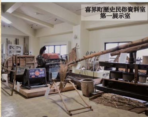
喜界町歴史民俗資料室 第一展示室