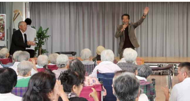
老人ホーム「オアシスケア喜界」と「ひまわり苑」を慰問!