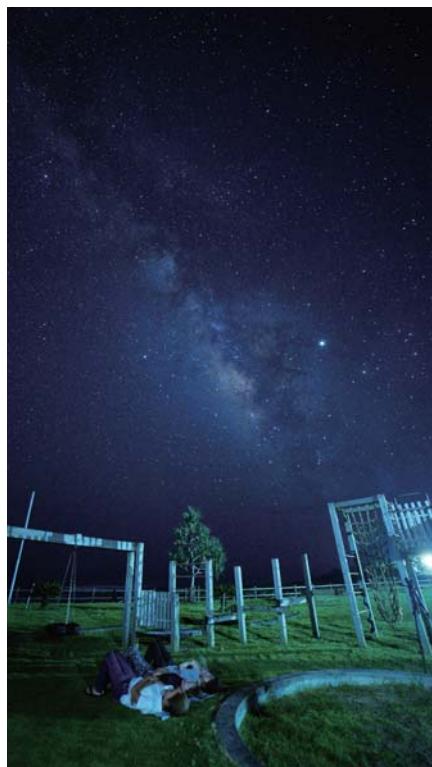
阿伝集落の農村公園