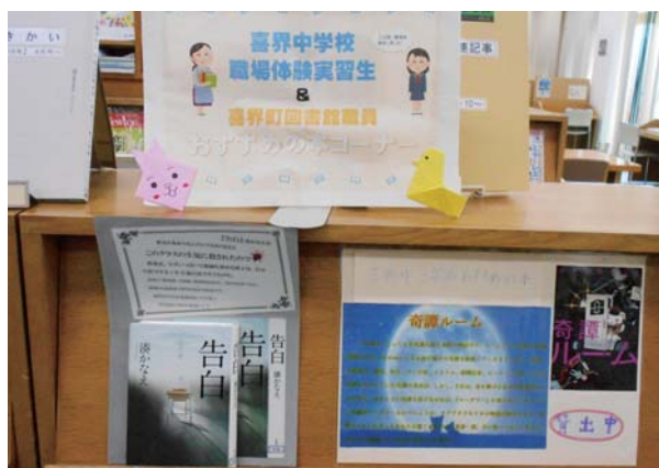
おすすめ本の展示コーナー