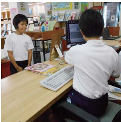
図書館の貸出業務

最後に、おすすめ本の展示コーナー作成を行いました。2人ともわかりやすく、魅力的な展示コーナーを作っていました。