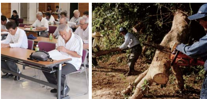
左から通常総会の様子と伐採作業の様子

喜 界町シルバー人材センターの2019年度通常総会が6月6日、役場多目的ホールで行われた。同センターは平成14年に設立され、60才以上の会員で構成され、大工や刈払機による草刈り・除草、庭木の剪定作業、お墓参り代行等幅広い作業を請け負っている。年々、受注件数も伸びてきており、民間企業及び一般家庭からの受注が6割、公共機関からの受注が4割となっている。好調な受注件数と並行して「元気な新規会員」も随時募集をしている。加入については喜界町シルバー人材センター（☎55-3663）まで！