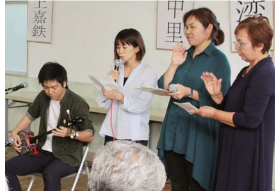
創作いちゆんにやかな：荒木集落代表