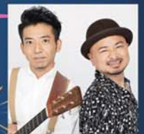
歩行者天国に「どぶろっく」が出演