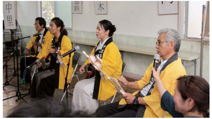
創作いちゆんにやかな：中里集落代表