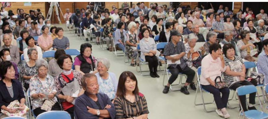
会場は詰めかけた聴衆で超満員 本物の歌声に酔いしれました♪