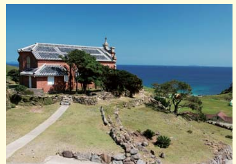
観光客も多く訪れる野崎島の集落跡