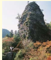
岩屋神社と権現岩