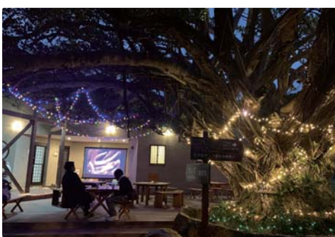
サンゴバー開店中

1月13日(日) サンゴバーを開催しました！今回の限定メニューは、ドイツとフィリピンの郷土料理と、ホットグリューワインをご用意しました。ドイツとフィリピンは研究所の研究協力機関や大学があり、長く交流のある国です。今後も、喜界島のみならず夜の研究所を楽しんでいただいたり、世界各地の珍しい料理を提供したり、サンゴ礁のさまざまな研究の話が聞けるイベントを開催していきます。イベントのお知らせは、各種SNSにて発信していきますので、フォローをお願いします！