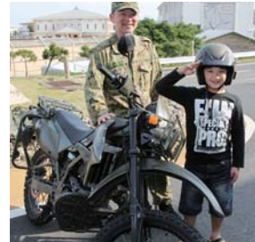
敬礼もさまになってる!