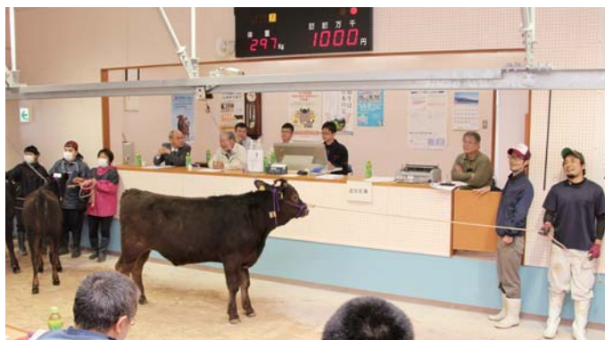
1頭目に最高額の100万円を記録！

JA県経済連が主催する子牛の初セリ市が1月13日、喜界家畜市場で開催された。平均価格が68万5897円で前回は9802円高。めすの部の最高価格は85万8000円、去勢の部の最高価格は100万円。185頭が売却され、総売り上げ金額は約1億2680万円だった。町の畜産担当者は「台風被害の影響で一部発育のよくない牛が見受けられた。5月セリまでは影響が残ると思われる。今後も購買者のニーズにこたえられる喜界島らしい牛を、生産者や関係機関一体となって生産していきたい」と力を込めた。 ※価格は税抜き