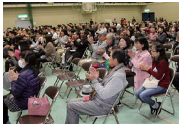
来場者も拍手喝采!