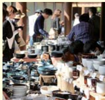
春の民陶むら祭り