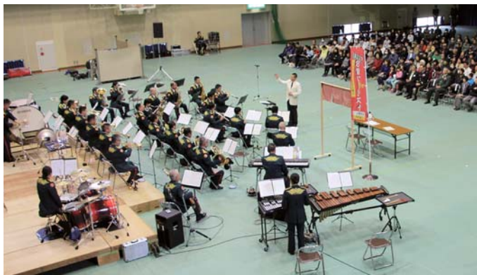
演奏技術の高さとバラエティに富んだ演出で大盛況!

隊車両の体験搭乗が役場駐車場周辺で行われた。96式総輪装甲車や軽装甲機動車と偵察用オートバイの計4台が展示され、多くの親子連れらが来場した。車両に乗り込んで役場周辺を回る体験搭乗は順番待ちの列ができるなど人気で、他にも自衛隊の制服に身を包んで記念撮影する子どもの姿も見られた。