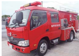
左から資機材搬送車と水槽付小型動力ポンプ車