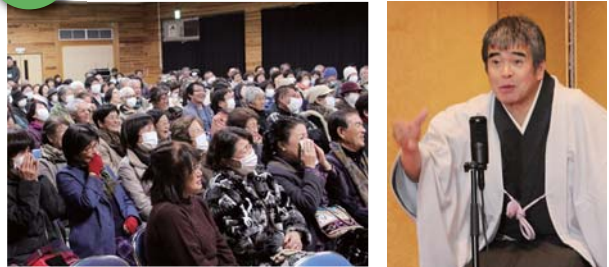
2時間笑っぱなしで大盛況！

鹿児島出身で落語家の三遊亭歌之介師匠の独演会が1月26日、自然休養村管理センターであった。前半は政治、時事、子どもの頃の体験談、自身の子育ての話に至るまで身近な話題を絡めた新作落語を披露。後半は短めに古典「勘定板」を披露した。約2時間、息もつかせぬ展開に約300人が集まった会場は爆笑の渦に包まれた。