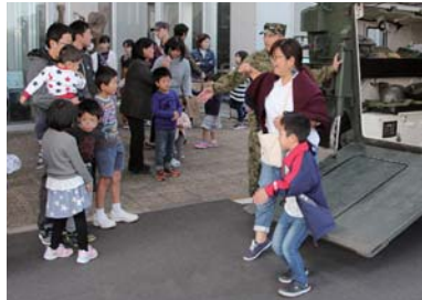
乗り物はみんな大好き一番人気!

隊車両の体験搭乗が役場駐車場周辺で行われた。96式総輪装甲車や軽装甲機動車と偵察用オートバイの計4台が展示され、多くの親子連れらが来場した。車両に乗り込んで役場周辺を回る体験搭乗は順番待ちの列ができるなど人気で、他にも自衛隊の制服に身を包んで記念撮影する子どもの姿も見られた。