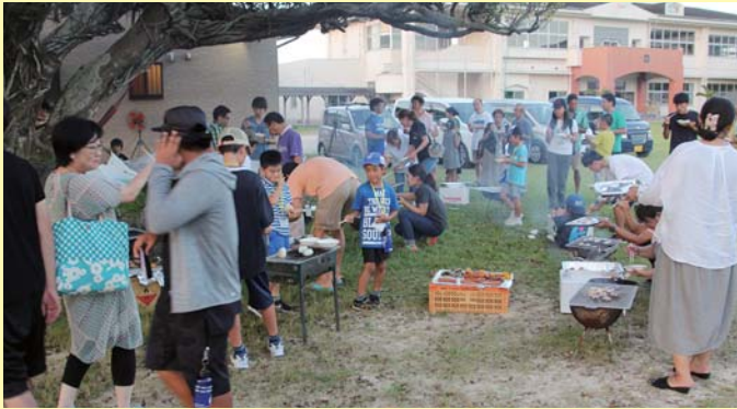
③さあ初日の最大のお楽しみ バーベキュータイム

4年目を迎えた「サンゴ礁サイエンスキャンプ in 喜界島」が今夏も開催された。小学3年生から中学生までを対象としたジュニアコースが8月4日～8日、今年から新設された高校生対象のアドバンスドコースが8月8日～15日の日程でNPO法人喜界島サンゴ礁科学研究所（渡邊剛理事長）にて行われた。島内から15人、島外から27人（北は北海道から南は沖縄永良部島まで）の子どもたち、計42人が参加した。 子どもたちは6つの班に分かれ、サンゴの成長やサンゴ礁の生き物、サンゴの化石などについて調査・研究を行い、その成果をシンポジウムで発表した。 今回は10人の博士を含む13人の講師陣と14人のスタッフ陣が「将来の研究者の卵たち」を育てるべく、全力サポートで充実のキャンプを成功させた。 今回はジュニアコースを中心に「サンゴ礁サイエンスキャンプ in 喜界島」の一部始終をご紹介します。