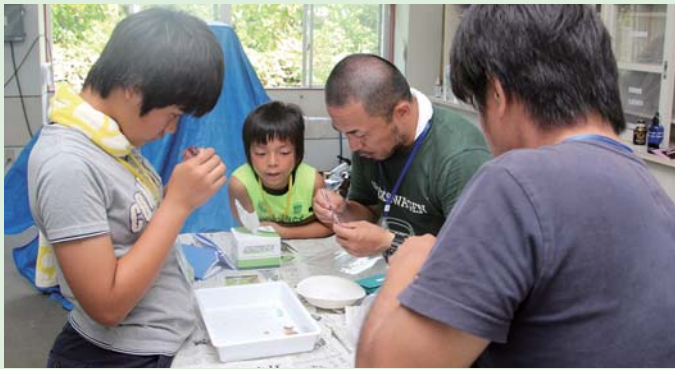
魚を丁寧に解剖しながら魚の暮らしのヒントを探ります