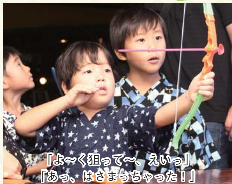
「よ〜く狙って〜、えいっ」 「あっ、はさまっちゃった!!」