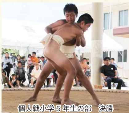
個人戦小学5年生の部 決勝