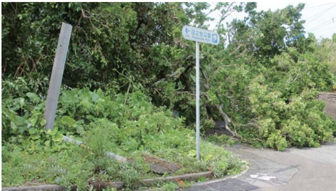
西目から大朝戸に向かう道路が倒木で通行止め

名瀬測候所によると、21 日昼過ぎに暴風域に入った喜界町では、午後 5 時 59 分に 8 月の最大値を更新する 40.6m/s の最大瞬間風速を記録した。その影響で一時島内全域で停電に見舞われたほか、強風による家屋や公共施設の窓ガラスや屋根の破損、倒木による通行止め箇所などが発生した。また、強風による白ゴマやサトウキビへの被害額は、約 2 億 6 千万