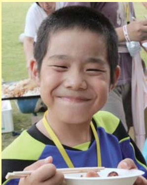
④楽しい時間に笑顔がこぼれます おいしい食事に皆打ち解けました