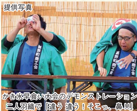
かき氷早食い大会のデモンストラーション 三人羽織で「違う 違う! そこっ、鼻!!!」