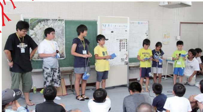
各班ごとに研究ポスターを作成し、研究成果を発表！