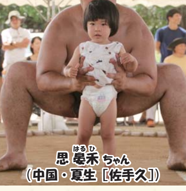
思 尾禾 ちゃん (中国・夏生 [佐手久])