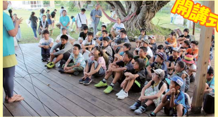
①一堂に会してまずはキャンプのねらいやルールについて説明