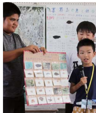
魚のクイズを出題！

「サンゴの化石発掘隊「サンゴ礁地質・化石班」 どんな岩石が喜界島にあるのか。サンゴの化石がどの時代にどのよう分布していたのかを調査。 岩石は泥岩と石灰岩の2種類が見つかり、泥岩の中には有孔虫の化石を多く見つけることができた。サンゴの化石は畑や海岸で多く見つかった。化石の種類からトンビ崎は浅い海で花尾神社は深い海だったことがわかった。サンゴの化石だけで昔の土地の環境まで見え、化石は偉大な物だと感じた。