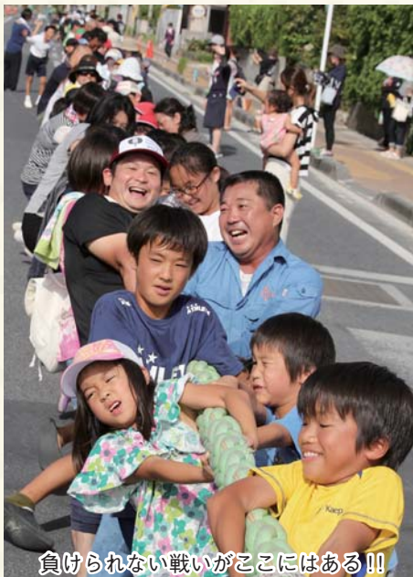
負けられない戦いがここにはある！！