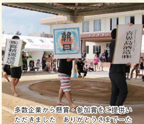
多数企業から懸賞・参加賞をご提供いただきました ありがとうございます