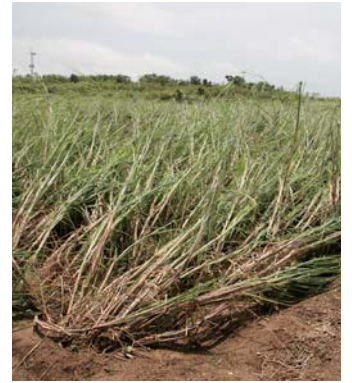
強風で倒れたサトウキビ