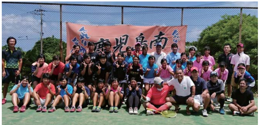
鹿児島南高校と喜界高校、喜界中学校の合同練習後の一枚

お詫びと訂正 先月号の「教育委員会のまど」スポーツ交歓大会・女子バレーボール競技紹介記事の中で「喜界町チームは全力プレーで健闘しましたが、惜しくも予選リーグを勝ち上がることはできませんでした」と掲載しましたが、正しくは「喜界町チームは予選を勝ち上がり、惜しくも準決勝で敗れました」でした。お詫びして訂正いたします。