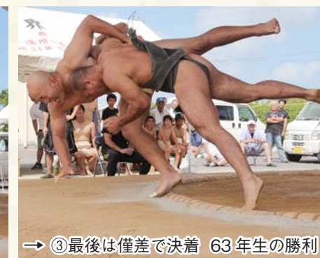
→ ③最後は僅差で決着 63年生の勝利