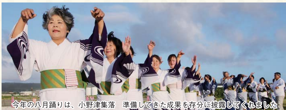
今年の八月踊りは、小野津集落 準備してきた成果を存分に披露してくれました