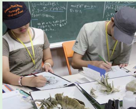
サンゴを詳細にスケッチ中