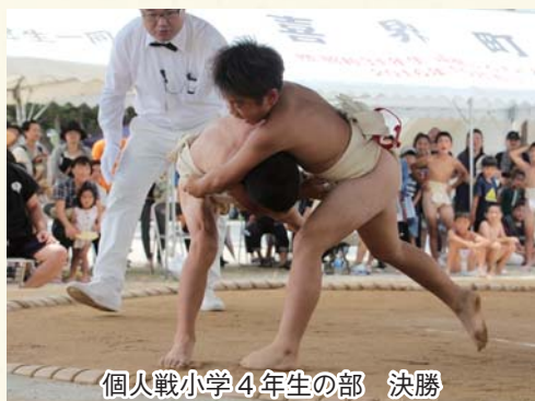
個人戦小学4年生の部 決勝