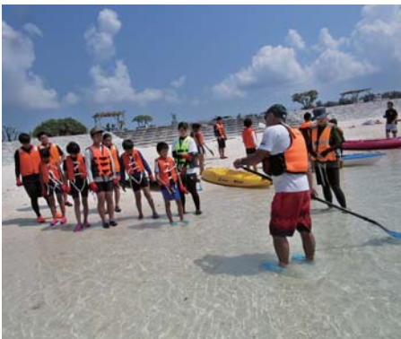
早く泳ぎたい! はやる気持ちを抑えてまずは漕ぎ方の練習から