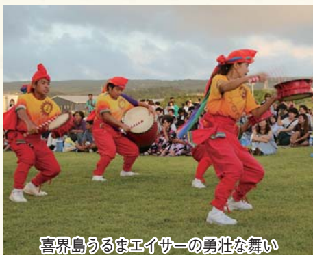
喜界島うるまエイサーの勇壮な舞い