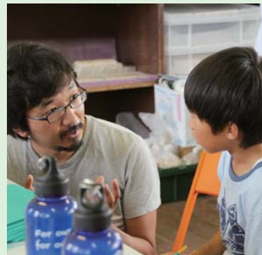
マンツーマンで熱のこもった指導