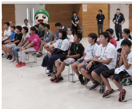
役場を表敬訪問 よろこびとも登場し歓迎ムードを味わいました!

「喜界島は海がきれいでスノーケリングでは魚がはつきり見えました。自然あふれる喜界島にまた来たいです」と話す笑顔が印象的でした。