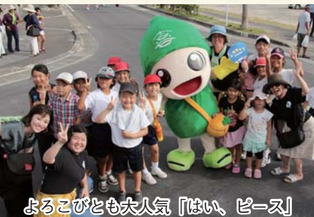
よろこびとも大人気「はい、ピース」