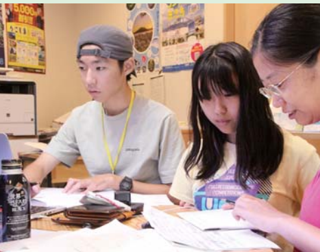
アドバンスコース研究レポート作成追い込み中