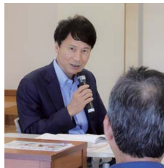
要望に丁寧に回答する知事