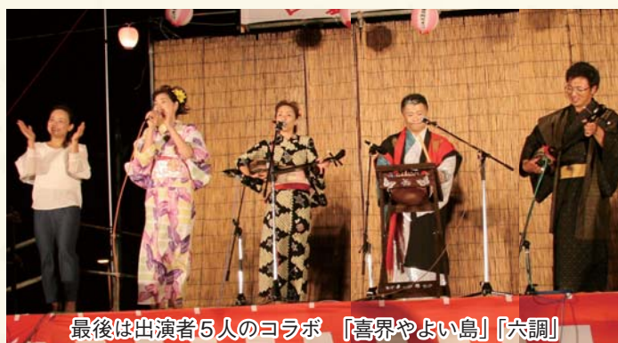
最後は出演者5人のコラボ 「喜界やよい島」「六調」