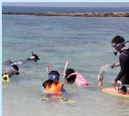
はやる気持ちを抑えつつ、いざ出陣!