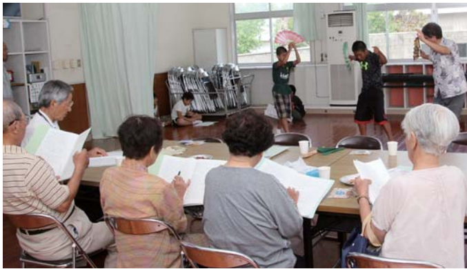
方言講師の方々が台本片手に真剣指導です

まず、子どもたちはしまゆみたでのセリフ暗記に四苦八苦。普段耳にすることはあってもほとんど使わない方言はなかなか手強い。そして、セリフ暗記をした後は、イントネーションの壁が立ち上がる。狂言