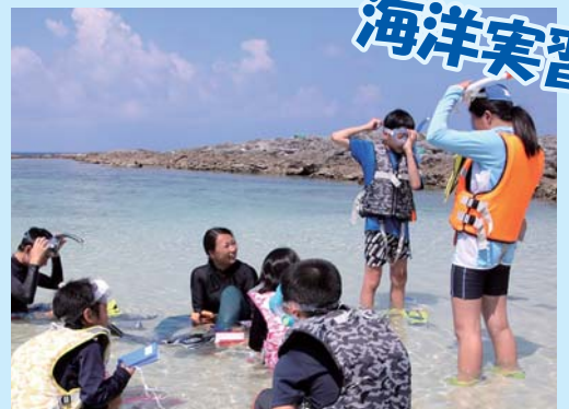
安全面にも十分配慮し万全の準備で!