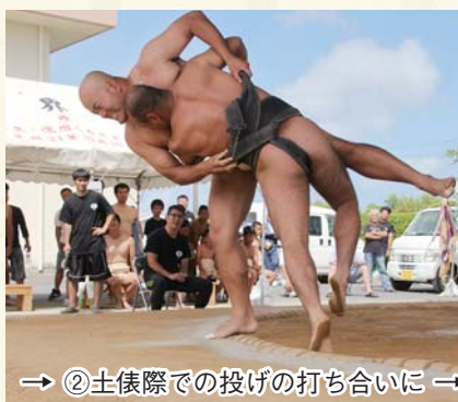
→ ②土俵際での投げの打ち合いに →