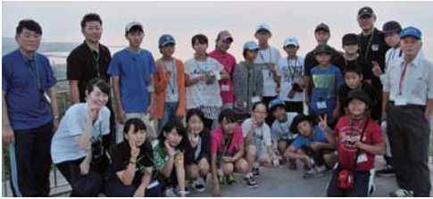
早朝に到着した一行は百之台で太平洋と東シナ海を望む雄大な景色を堪能!

今年度は戦時中の学童疎開が縁で姉妹都市盟約を結ぶ伊佐市から小学生で構成された「伊佐市青少年交流団」20名が来島し、合同でキャンプを行いました。キャンプでは島唄・三味線体験や喜界島について学ぶ