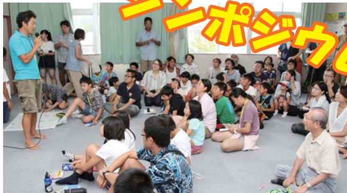
シンポジウムには関係者をはじめ一般の方も詰めかけました

「サンゴ礁さかな班」 サンゴ礁の魚の暮らし調査隊 色々な魚を解剖して体の特徴を調査。刺し網、釣り、投網、筒による方法で魚を採取し解剖し、消化管、生殖腺、胃の内容物を観察し、最後に耳石を取り出した。 耳石の大きさは魚の大きさに関係ない。魚の腸の長さや太さで肉食かどうかかわかる。ウツボの卵巣は左右で量が違う。ウツボの心臓は2回冷凍しても動いた。ヘリシロウツボとアセウツボは夏に産卵することなどがわかった。