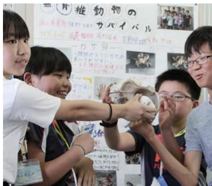
ヤコウガイの貝殻を用いてわかりやすく説明