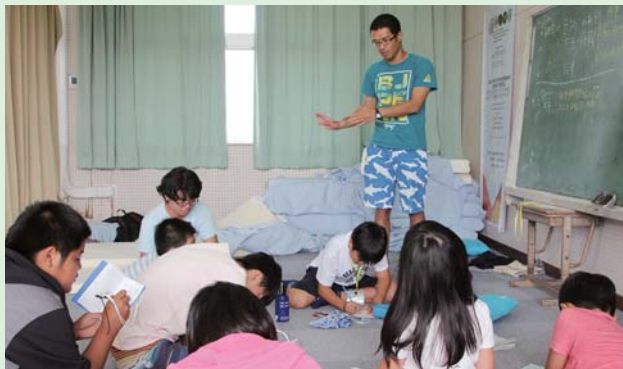
講師の先生の話をしっかりメモして考察に生かします