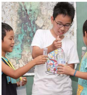
実際に実験をして見せて説得力を増す工夫をする班も！

海の環境とサンゴの成長を調べ隊「うみぼうずハンターズ班」 サンゴの種類と成長速度は環境に関係があるか調査。岸から10メートルごとに海水の水温、塩分、PHなど測定。また、一定地点のサンゴを採取、レントゲン撮影での年輪測定を行った。 PHの値はどこも8に近く岸から30メートル以降は上がり続けた。水温は20メートルまでは高く、20〜40メートルにかけ下がった。塩分は沖に出るごとに高くなった。エダコモンサンゴとチヂミコモンサンゴは、ハマサンゴよりも成長量は大きく、環境によって生息場が異なる。