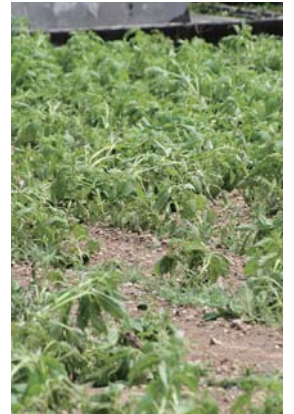
被害を受けた白ゴマ

円と見られている。農業振興課の担当者は「今年は白ゴマの栽培は場面積が確保できており、豊作も見込まれていただけに大変残念。サトウキビも被害を受けたが、今後持ち直して目標の 8 万トンの近い数字まで回復してくれることを願いたい」と悔しい胸の内を語った。