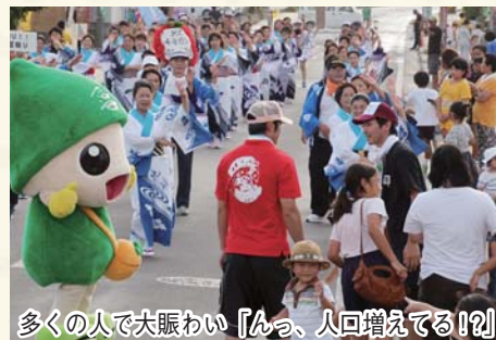
多くの人で大賑わい「んっ、人口増える!?!」