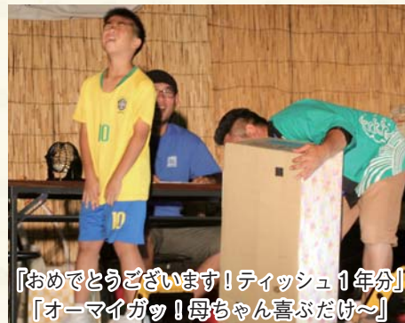
「おめでとございます! ティッシュ1年分」 「オーマイガッ! 母ちゃん喜ぶだけ〜」