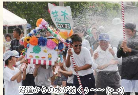
沿道からの水が効くう〜(๑_๑)