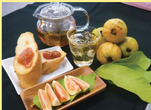
素敵なティータイムを過ごしてみても♪

皆さんの身近にある「バンシロー」果実も葉も体に良いので、この機会にぜひ活用してみたいかがでしょうか？詳しくは、喜界町農産物加工センター（☎651-3666）へご連絡ください。