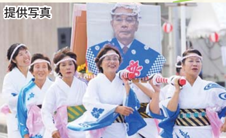
「町長みこし」だ ワッショイワッショイ♪