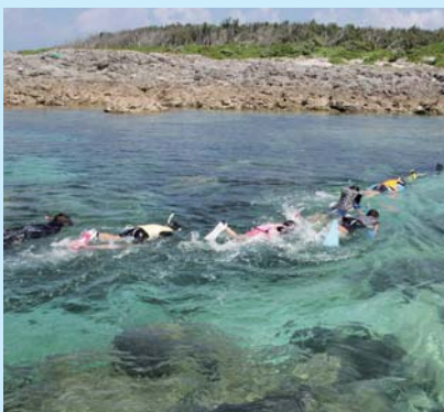
それぞれの研究試料を探します