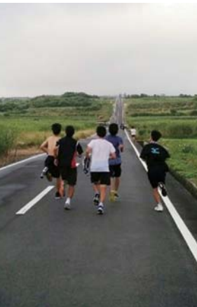
暑さ厳しい中、精力的に練習に取り組みました!

「喜界島は海がきれいでスノーケリングでは魚がはつきり見えました。自然あふれる喜界島にまた来たいです」と話す笑顔が印象的でした。