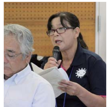
現状を真摯に訴える出席者