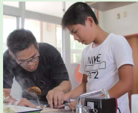
サンゴを切断し年輪を調べます