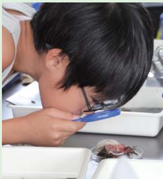
ウニのつくりを細部までよく観察