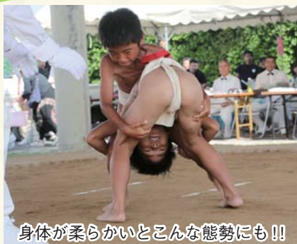
身体が柔らかいとこんな態勢にも!!