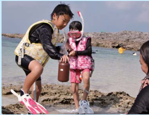
研究用に海水を採取