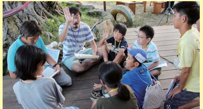
②その後それぞれの班に分かれて今後の流れなどの打ち合わせ