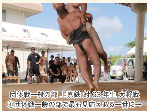
団体戦一般の部 上嘉鉄 対 63年生 大将戦 ①団体戦一般の部で最も見応えある一番に→