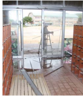
正面玄関が破損した喜界小学校