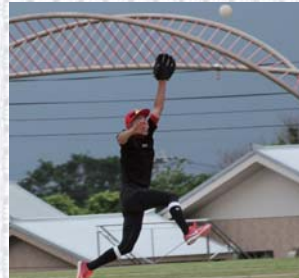
珍プレー・好プレーも盛りだくさん