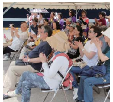
演芸イベントを楽しむ乗客ら