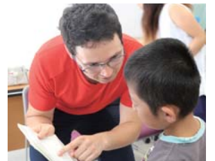
ナサ先生と会話する子ども

子供たちはくじを引いて、英語の質問一覧シートにある、どの質問をどの先生にするかを決め、一人一人自分のことを英語で先生に紹介し