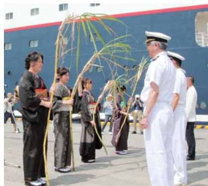
大好評だったサトウキビ贈呈