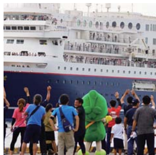
最後の最後までお見送り