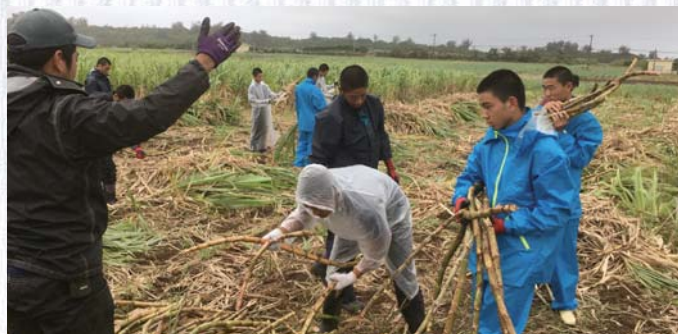
サトウキビ栽培、最後の収穫作業

クラウドファンディングは 7 月 31 日まで受け付けており、支援の手続きやチーム KUBO の取り組みについては、インターネットで「キャンプファイ