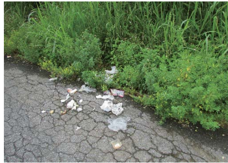
ティッシュ・包装容器・缶・ビン・ペットボトル・新聞誌に包んだ大便など