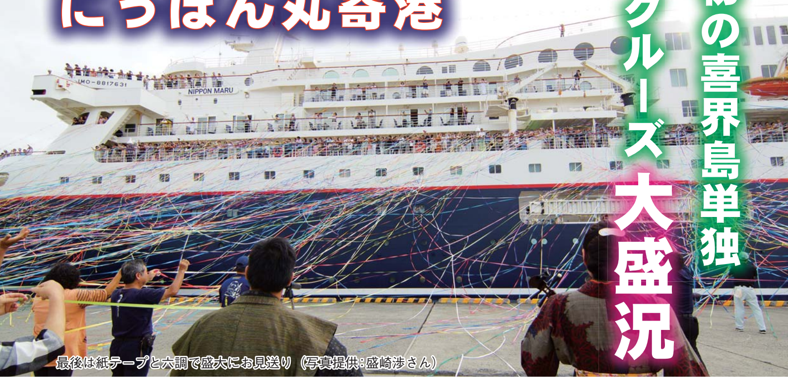
最後は紙テープと六調で盛大にお見送り