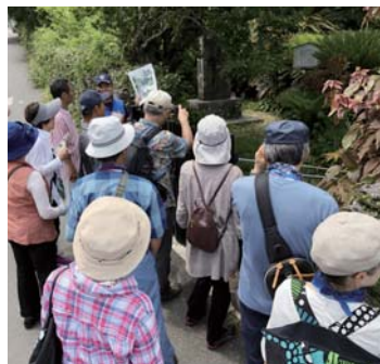
好評だったシマあるき