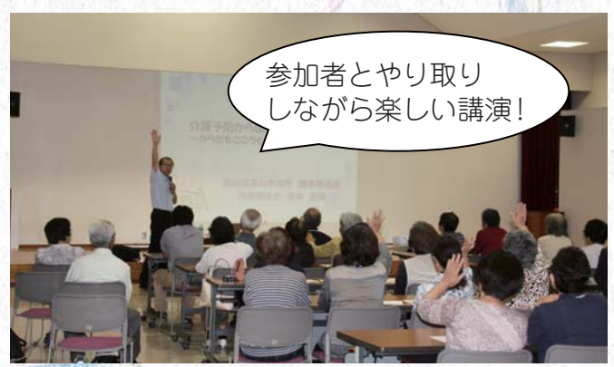
参加者とやり取りしながら楽しい講演!