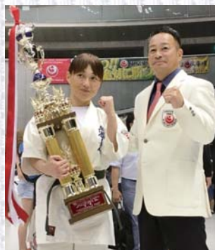
新極真会の緑健児代表理事とガッツポーズ!