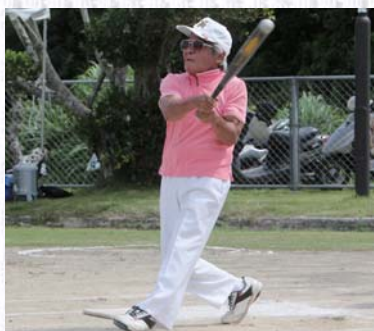
豪快なフルスイングも大会のみどころ