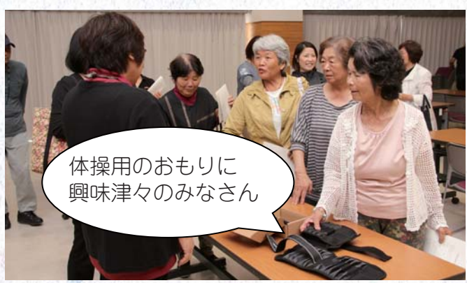
体操用のおもりに興味津々のみなさん