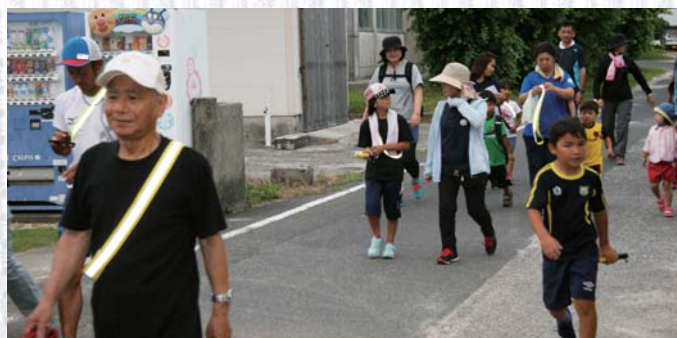
ムタグラウンドをスタートする参加者たち

1 00スポーツクラブ主催によるサンセット健康ウォークが6月30日、荒木ムタグラウンドをスタートし、手久津久を通り旧第二中学校で折り返す9 キロ のコースで行われた。当イベントは今回が4回目で、約100人の参加者らは健康チェックを行った後、午後6時30分にグラウンドをスタートした。夕日観察スポットとして名高い荒木うりばまを通り、手久津久へ向かった。この日は曇りだったため、夕日は見れなかったが、参加者は会話を楽しみながら、ゴールを目指した。ゴール後には、お楽しみ抽選会があり、景品を笑顔で受け取る様子が見られた。