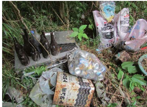
塩ビパイプ・トタン・ペットボトル・缶・焼酎ビン・植木鉢・肥料袋・製氷機など