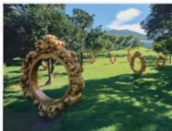
チェ・ジョンファ《あなたこそアート》