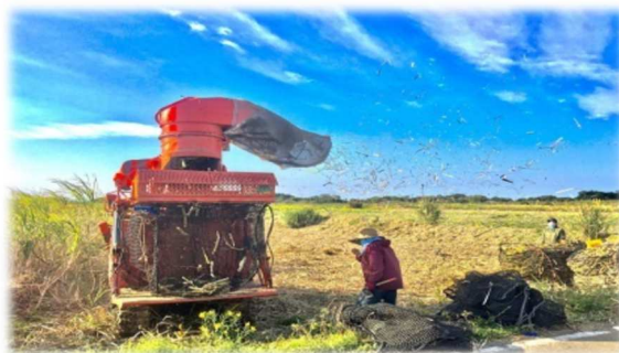
基幹作物であるサトウキビの収穫風景