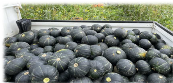
重点品目のかぼちゃの収穫風景